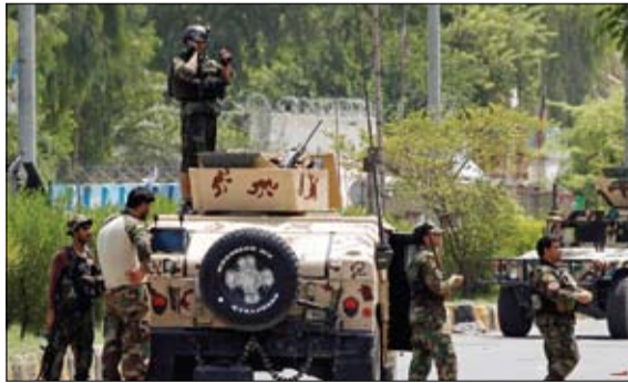
قوات الأمن الأفغانية تنتشر في محيط السجن بجلال آباد

وبخسب السودان ومصر أن يؤدي السد، الذي يهدف إلى توليد الكهرباء وتبلغ كلفته 4 مليارات دولار، إلى نقص في حصة كل منهما من المياه.