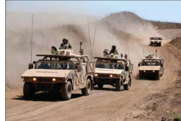
قوات الاحتلال خلال تدريبات في الجولان المحتل

إلى عدم وقوع إصابات بين صفوف الجنود الاسرائيليين خلال العملية في جنوب مرتفعات الجولان. ويشهد الوضع المتوتر أصلاً تصعيداً في الأونة الأخيرة بين عيوب ناسفة على سياج أمني عند الحدود مع سوريا. وقال بيان صادر عن الجيش الإسرائيلي مطلع تموز يوليو. إنه ردا على ذلك أغارت طائرات ومروحيات حربية على عدد من الأهداف الإرهابية التابعة لمنظمة حماس في قطاع غزة، مشيراً إلى استهداف بني تحتية تحت أرضية تابعة لحماس.