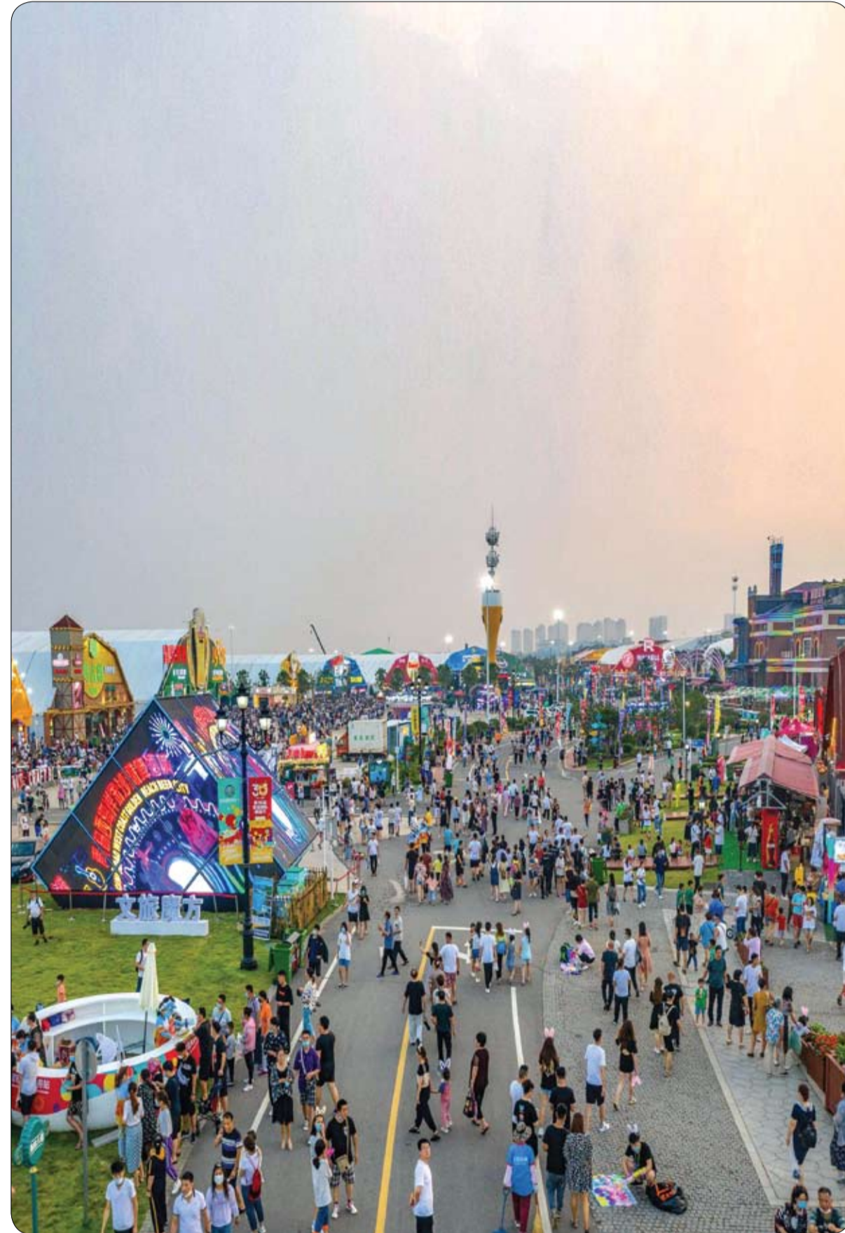
صورة جوية ملتقطة لعدد كبير من الأشخاص يشاركون في مهرجان بيرة تشينغداو السنوي في تشينغداو بمقاطعة شانغونغ شرق الصين.

ومن المعروف أن أسماك القرش الحوتي والحيتان الحدياء موجودة بكثافة في هذه المنطقة البحرية، لكن الأسماك من هذين النوعين تلزم الحذر عادةً عندما تكون قريبة من المراكب والبشر.