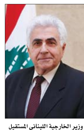
وزير الخارجية اللبناني المستقبل

وسط تعثر حكومي بات واضحاً لا سيما على الصعيد الاقتصادي والسياسي، قدم وزير الخارجية اللبناني ناصيف حني، صباح الاثنين، استقالته إلى رئيس الحكومة حسان دياب، وغادر السراي الحكومي دون الإدلاء بأي تصريح. وفي بيان صدر لاحقاً، أوضح الوزير أسباب قراره هناك، مؤكداً أن غياب الرؤية الإقتصادية للبلاد دفعه للاستقالة. كما نبه إلى انزلاق لبنان إلى مصايء الدول الفاشلة، وسط تعثر حكومي بات واضحاً لا سيما على الصعيد الاقتصادي والسياسي، قدم وزير الخارجية اللبناني ناصيف حني، صباح الاثنين، استقالته إلى رئيس الحكومة حسان دياب، وغادر السراي الحكومي دون الإدلاء بأي تصريح. وفي بيان صدر لاحقاً، أوضح الوزير أسباب قراره هناك، مؤكداً أن غياب الرؤية الإقتصادية للبلاد دفعه للاستقالة. كما نبه إلى انزلاق لبنان إلى مصايء الدول الفاشلة،