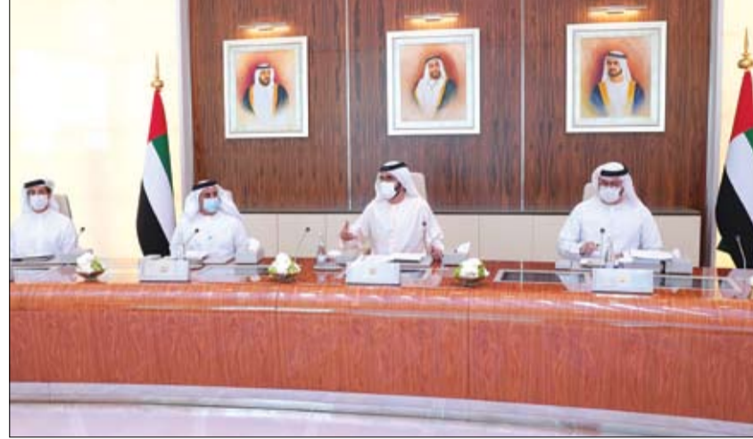
محمد بن راشد خلال ترؤسه اجتماع مجلس الوزراء

وفيما يتعلق بتطوير اللقاحات، أوضح العويس أن الدولة تحقق بالتعاون مع مجموعة كبيرة من الشركاء الدوليين تطوراً ملحوظاً، إذ تواصل حالياً المرحلة الثالثة من التجارب السريرية التي انطلقت