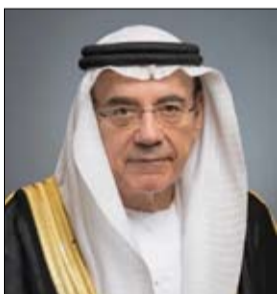
وأوضح أن تشغيل محطة "براقة" يؤكد مكانة الإمارات على الخارطة

وصف معاليه نجاح تشغيل أول مفاعل سلمي للطاقة النووية بأنه إنتصار للإرادة والعزيمة القوية لتدشين مسيرة "الخمسين" نحو مستقبل مشرق لبناء الإمارات والمنطقة .