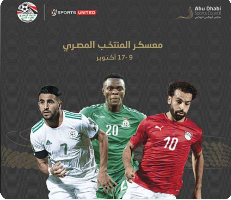
معسكر المنتخب المصري 17-9 أكتوبر