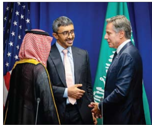
وزراء خارجية الإمارات والسعودية والولايات المتحدة خلال لقاءهم في نيويورك

نيويورك - وام: التقى سمو الشيخ عبدالله بن زايد آل نهيان وزير الخارجية في نيويورك، عددا من وزراء خارجية الدول المشاركة في أعمال الدورة الـ78 للجمعية العامة للأمم المتحدة كل على حدة. من جهة أخرى بحث سمو الشيخ عبدالله بن زايد آل نهيان وزير الخارجية وصاحب السمو الأمير فيصل بن فرحان بن عبدالله وزير خارجية