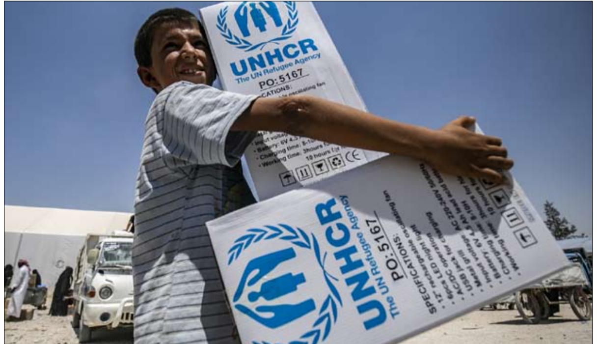
المساعدات الإنسانية من أمم الادوار التي تلعبها المنظمة الدولية