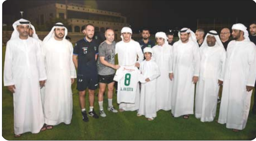
كان لها وقعها النفسي لدى مجلس الإدارة واللاعبين والجهازين الإداري والفني مؤكداً أن انعكاساتها الإيجابية تصب في مصلحة النادي إلى الأمام لتحقيق آفاق النجاح.