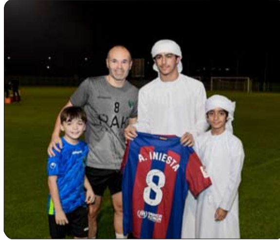
إيجاباً على مسيرة النادي والفريق خلال المرحلة المقبلة وقال: الزيارة