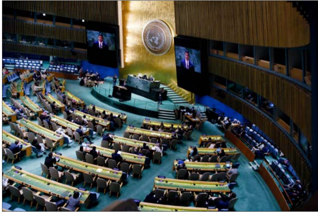
رغم كل العقبات الدائمة يظل الحفاظ على الأمم المتحدة ضرورياً أكثر من أي وقت مضى

مع الواقع في عام 2023 والآن تطرق اليابان والهند وباكستان والبرازيل وألمانيا وأبوها، وتفاوض كل منها قتلها الدولي في المطالبة بنفس الامتيازات التي يتمتع بها "الخمس الدائمون" الحاليين. لكن الإصلاح محكوم عليه بالفشل في مواجهة المصالح المتنافسة للعشائر المختلفة، والمنافسات الغربية والاستبدادية وعدم الانحياز والجوار. أوكرانيا تحتج على استمرار روسيا، وريثة السلطة في الاتحاد السوفيتي، في الجلوس في مجلس الأمن. في حين تم تصنيفها صراحة كدولة معتدية منذ 24 فبراير 2022 ويبدو الاستبعاد مستحيلاً؛ فهو يتطلب إجماع الدول الأعضاء الدائمة. ومع ذلك، يمكن التحايل على هذا المأزق، أعاد القرار الأقل. في 26 أبريل 2022، أعاد القرار الذي قدمته ليختشتاين الصغيرة وأيدته 83 دولة الجمعية العامة إلى فضائلها العامة، من خلال إلزام الدول الأعضاء التي استخدمت حق النقض على أن تأتي وتشرح على النصبة قبل عشرة أيام دواعي رفضها الفيتو. ويجري استكشاف سبل أخرى للإصلاح في ضوء قمة المستقبل، المقرر عقدها في سبتمبر 2024. وتقر لجنة تفكير حول