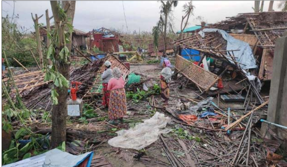
الأمم المتحدة تساهم في مكافحة الكوارث المستمرة في أنحاء العالم

هل فشلت الأمم المتحدة؟ إن "الصوت الشعبي" يدين بسهولة الأمم المتحدة، بسبب إخفاقاتها العديدة والمهملية؛ ألم ينشر أصحاب الخوذ الزرقاء مرض الإيدز في كمبوديا بين عامي 1992 و1999، أو الكوليرا في هايتي في عام 2010، أو لم يرتكبوا عمليات اغتصاب بشعة في جمهورية أفريقيا الوسطى في عام 2021؟ وفي قبرص والصحراء الغربية، وهما من أقدم الصراعات في العصر الحديث، حيث استمر الوضع الراهن اليائس لعقود من الزمن. وفي مجلس الأمن، ينتظر الشلل، الذي يرهق أصعب الدبلوماسيين المرططين في النشاط؛ فقد استخدمت روسيا حق النقض 143 مرة منذ عام 1946، مقابل 86 مرة للولايات المتحدة و 30 مرة لبريطانيا العظمى و 18 مرة للصين وفرنسا. وكشف تسعة أمراء عامون متقاعدون عن مدى عجزهم، أمام الإبادة الجماعية للتوتسي في رواندا عام 1994، أو الغزو الأمريكي للعراق عام 2003، أو الروس وأوكرانيا عامي 2014 و2022، أو حروب المدنيين في اليمن وسوريا والسودان، ويبدو أن المعرفة الدبلوماسية للأمم المتحدة قد تراجعت وتبتلي