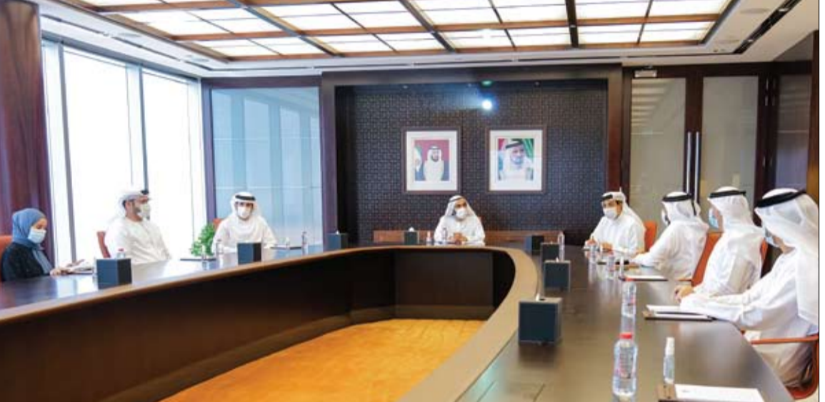
محمد بن راشد خلال ترؤسه اجتماعا مع فريق المنظومة الاقتصادية في حكومة دولة الإمارات لمرحلة ما بعد كوفيد-19

•• أبوظبي-وام: أعلن معالي عبدالرحمن بن محمد العويس، وزير الصحة ووقاية المجتمع، أن الإمارات تجاوزت 6 ملايين فحص مخبري لفيروس كورونا المستجد كجزء مهم من الإستراتيجية التي تبنتها الدولة لمواجهة الفيروس وحماية المجتمع من تداعياته السلبية. جاء ذلك خلال الإحاطة الإعلامية التي عقدتها حكومة الإمارات في أبوظبي، أمس والتي أكد العويس خلالها أنه بالإضافة إلى اتخاذ التدابير الاستباقية لمواجهة الوباء على الصعيد الصحي والاجتماعي والاقتصادي.. تواصل حكومة الإمارات دعم البحث العلمي لاسيما في المجالات الطبية. (التفاصيل ص7)