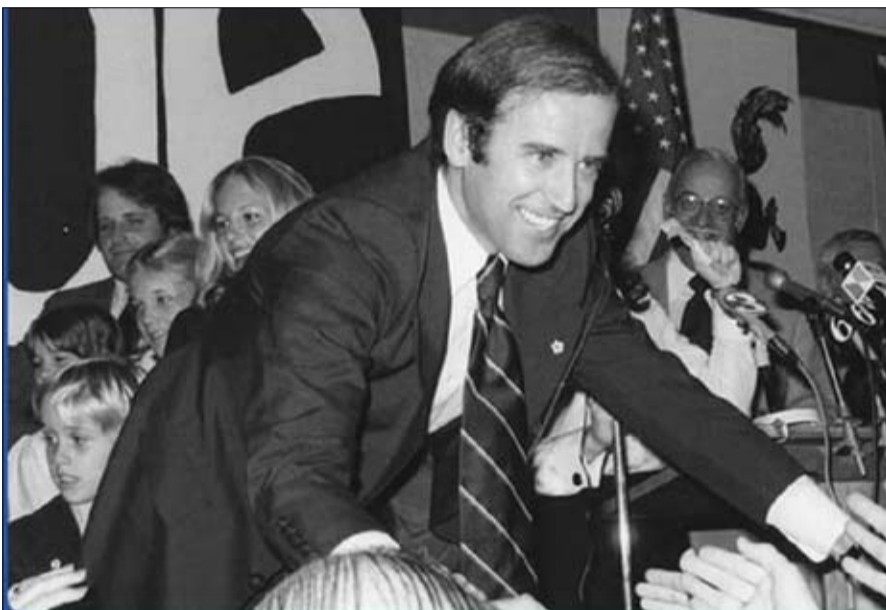
أصبح جو بايدن سناتوراً عن ولاية ديلاوير عام 1972

انزلق تدريجياً إلى اليسار في عوده الانتخابية. ولإرضاء الجناح التقدمي في الحزب، دعا النجمة الشابة المنتخبة، الاسكندريا أوكاسيو كورتيز، لقيادة فريق العمل المناخي. وانتهى الحنين إلى الماضي، فهو يستخدم الآن تعبيرات مثل "تغيير النظام" أو "تغيير البلد"، التي سمعناها سابقاً في أفواه ساندرز وإلزابيث وارين. وكصدي لمقترحات هذه الأخيرة، دعا إلى إلغاء ما لا يقل عن 10 الاف دولار من ديون الطلاب لكل شخص خلال الأزمة، وزيادة المعاشات التقاعدية بمقدار 200 دولار شهرياً.