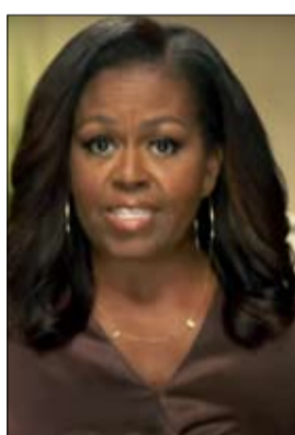
•• ميلووكي-أ ف ب

بشكل غير مسبوق افتراضياً بسبب وباء كوفيد-19، لكنه يُقام حتى العشرين من آب/أغسطس في ولاية ويسكونسن البالغة الأهمية والتي فاز فيها ترامب بشكل مفاجئ عام 2016 بتقدم ضئيل جداً. وفي معرض حديثها عن الأزمة الصحية الخطيرة التي أودت بحياة أكثر من 170 ألف شخص في الولايات المتحدة، والركود الاقتصادي وموجة الغضب التاريخية ضد العنصرية، قالت أوباما إن الرئيس الجمهوري كان "لديه أكثر من الوقت اللازم لإثبات أنه يستطيع القيام بهذا العمل. من الواضح أن الوضع تخطاه.. وأضاف في مقطع فيديو "أسمحوا لي أن أكون صادقة وواضحة قدر الإمكان. دونالد ترامب ليس الرئيس الصالح لبلدنا.. ووضعت ميشيل أوباما حول عنقا عقدا يحمل أحرف كلمة "صوتوا" بالانكليزية. ودعت في خطاب مؤثر الأميركيين إلى الإدلاء بأصواتهم في الثالث من تشرين الثاني/أكتوبر حتى لو كان ذلك يعني الانتظار "طوال وجهت السيدة الأميركية الأولى السابقة ميشيل أوباما في افتتاح مؤتمر الحزب الديموقراطي الانتقاد إلى الرئيس الأميركي دونالد ترامب معتبرة أنه رئيس غير كفء يظهر "افتقاراً تاماً للعاطفة"، داعية للانتخاب خصمه الديموقراطي جو بايدن في اقتراع الثالث من تشرين الثاني/نوفمبر. وقالت ميشيل أوباما إنه "في كل مرة نلتقي إلى البيت الأبيض بحثنا عن بعض القيادة أو المماساة أو أي مظهر من مظاهر الثبات، فإن ما نحصل عليه في المقابل هو الفوضى والانتقام والافتقار التام والمطلق للتعاطف.. وهذه انتقادات غير مسبوبة من جانب سيدة أولى أميركية سابقة لرئيس في الحكم. وألقيت كلماتها في ختام الليلة الأولى من المؤتمر الذي يُعقد