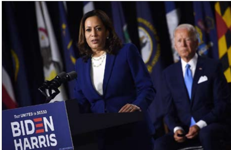
كامالا هاريس جرعة اوكسيجين للحملة

أعطى تعيين كامالا هاريس حياة جديدة للحملة الافتراضية للمرشح الديمقراطي