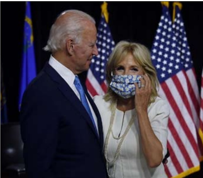
جو بايدين مع زوجته جيل الأستاذة الجامعية