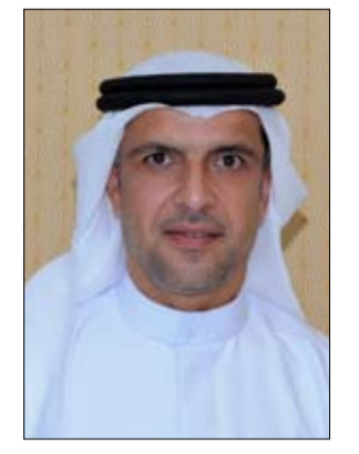
الجانِب الإنساني الذي يتمثل في احتياجات الشعوب، ومن هنا نجحت الإمارات في أن تصنع الفارق

في مجال العمل الإنساني، الأمر الذي ترجم على أرض الواقع، باحتلالها لسنوات عديدة المركز الأول عالمياً كأكبر جهة مانحة للمساعدات الخارجية في العالم قياساً إلى دخلها القومي. وأشار الخوري إلى الوقفة الإنسانية المتميزة للإمارات التي كسرت كل القيود والحدود خلال جائحة كورونا وإرسال المساعدات الطبية العاجلة إلى العديد من الدول حول العالم. جدير بالذكر أن دولة الإمارات أرسلت حتى اليوم، أكثر من 1277 طناً من المساعدات لأكثر من 107 دول، استفاد منها أكثر