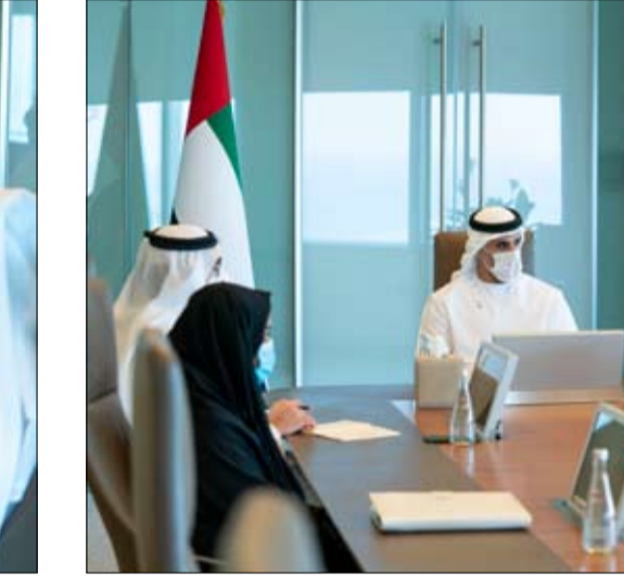
سمو الشيخ خالد بن محمد بن زايد آل نهيان يترأس الاجتماع الأول لمجلس إدارة أبحاث التكنولوجيا المتطورة.

ترأس سمو الشيخ خالد بن محمد بن زايد آل نهيان، عضو المجلس التنفيذي لإمارة أبوظبي رئيس مكتب أبوظبي التنفيذي رئيس مجلس أبحاث التكنولوجيا المتطورة، الاجتماع الأول لمجلس إدارة مجلس أبحاث التكنولوجيا المتطورة في أبوظبي وذلك لتحديد أولويات الأبحاث والتطوير في الإمارة.