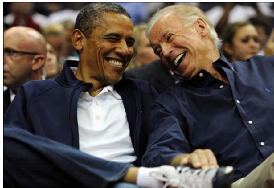
باراك أوباما وجو بايدن من المناظرة الى الصداقة

وكان يواجهها بحفظ قصائد طويلة يقرأها بصوت عال أمام المرأة، وحتى اليوم، يمكننا أن نسمعه يتعثر في كلمات معينة، ويشدأز الذين يعاونون من نفس مشكلة النطق. وفي الانتخابات الرئاسية، سيعتمد على نائبه، السناتور كامالا هاريس، الخبيرة في المبارزة اللفظية، لسد ثغراته في هذه المسألة. عندما كان مراهقاً، انتقلت عائلته إلى ماينيلد، بلدة للطبقة الوسطى في ديلاوير، وهي ولاية صغيرة جداً على الساحل الشرقي الأمريكي، وبسبب الوباء قام في الأشهر الأخيرة بحملته انطلاقاً من منزله، هناك التحق بالجامعة، حيث درس التاريخ والعلوم السياسية.