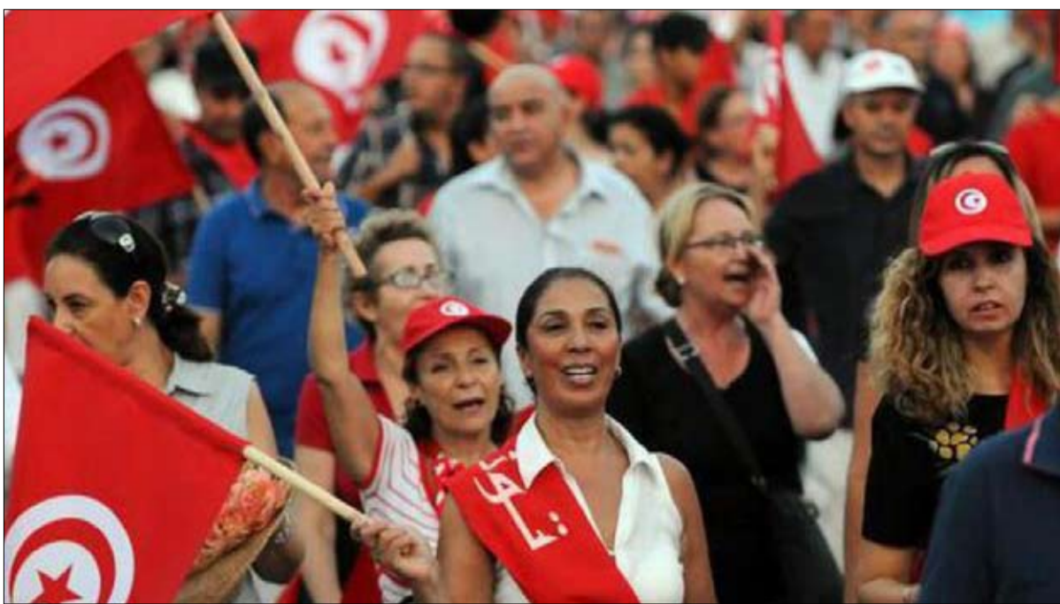
التشاؤم سيد الموقف

الغنوشي والشاهد يواصل تصدر قائمة الشخصيات التي لا يرد لها لعب دور في المستقبل بـ 74 في المئة للأول و60 في المئة للثاني. حملة الهمامي ونبيل القروي بـ 59 بالمئة لكلية ثم رئيس الحكومة الأسبق والقيادي بالهضبة على العريض بـ 54 بالمئة. بالمئة، متبوعا بالثلاثي رئيس الحكومة السابق ورئيس حزب تحيا تونس يوسف الشاهد بـ 60 في المئة وأمين عام حزب العمال أما بخصوص مؤشر انعدام الثقة كليا فنجد رئيس مجلس نواب الشعب ورئيس حركة النهضة راشد الغنوشي في المقدمة بـ 67