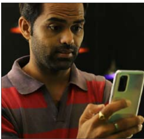
اعتقد الكثيرون أنها كانت مزحة

كانت تطلب بالفعل معلومات عن التدخلات الانتخابية المحتملة بهذه الطريقة.