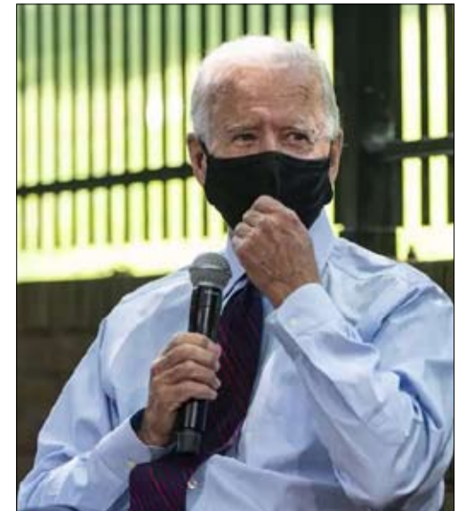
بعد بداية كارثية للحملة أصبح بايدين هو المفضل وفقاً لاستطلاعات الرأي

أعطى تعيين كامالا هاريس حياة جديدة للحملة الافتراضية للمرشح الديمقراطي