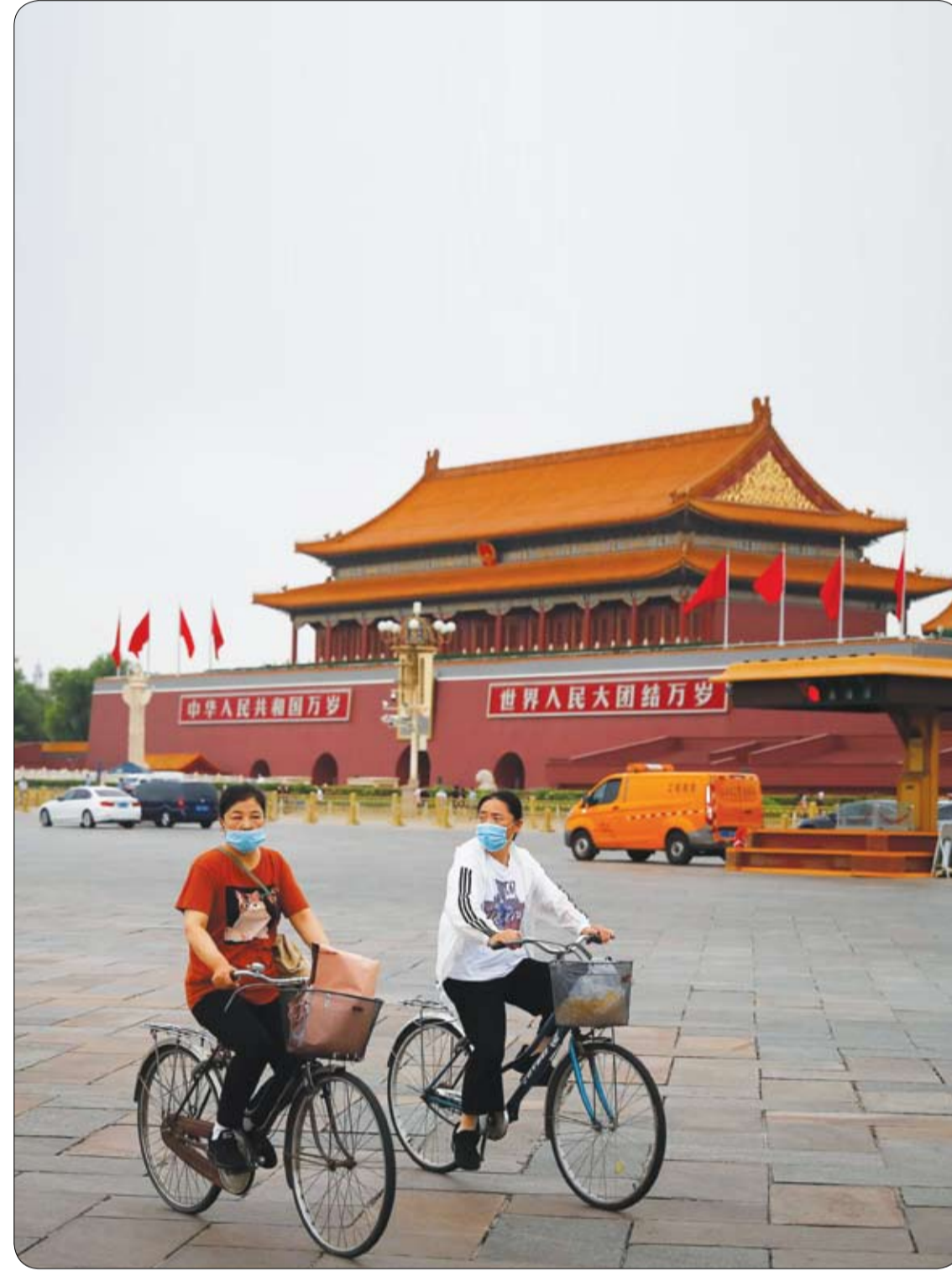
سيدتان تركبان دراجتين عبر ساحة تيانانمن مرتديتان قناع الوجه بعد تفشي فيروس كورونا في بكين، الصين.

وإذا مللتم شرب الماء النقي، أضيفوا إليه شرائح الليمون الحامض أو قطع الخيار أو أوراق النعناع.