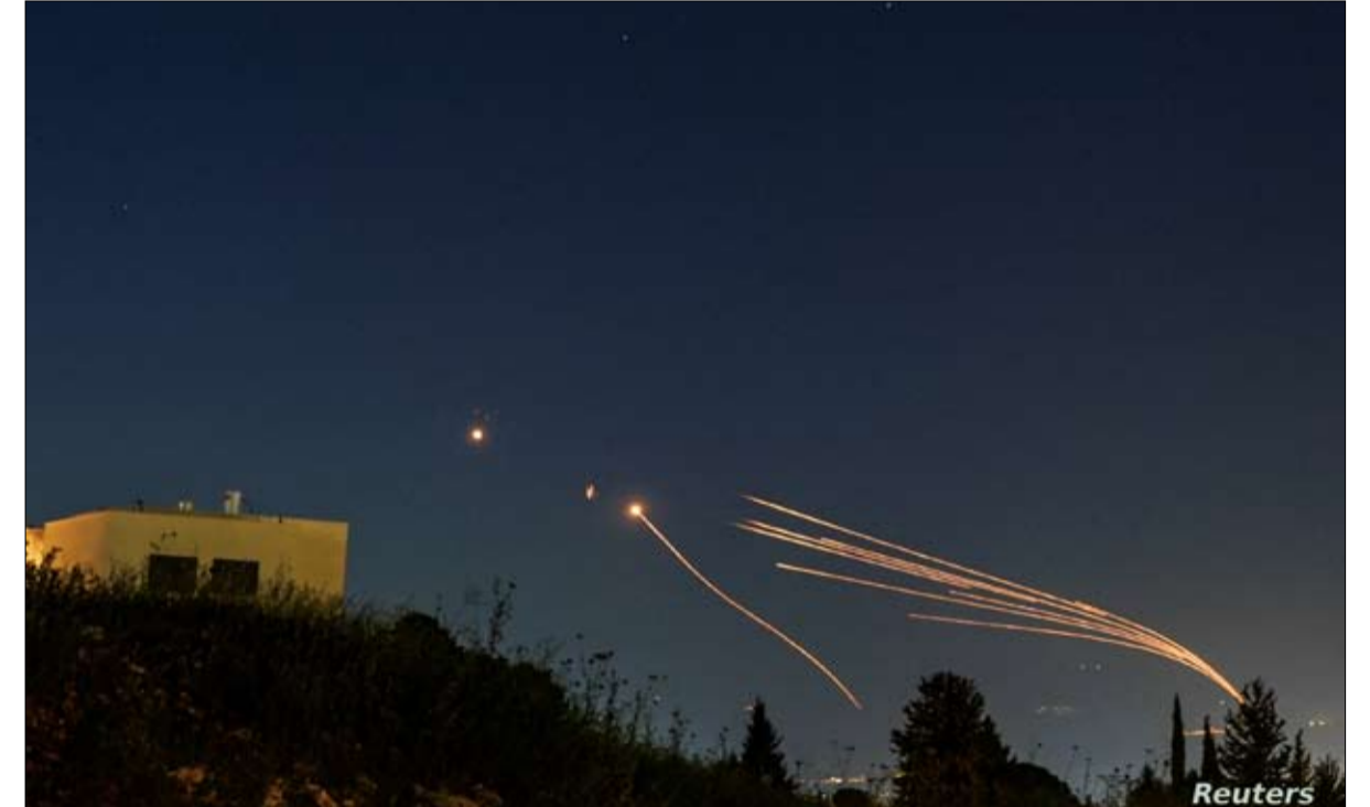
مليارات دفعت في يوم واحد لصد الهجوم الإيراني على إسرائيل