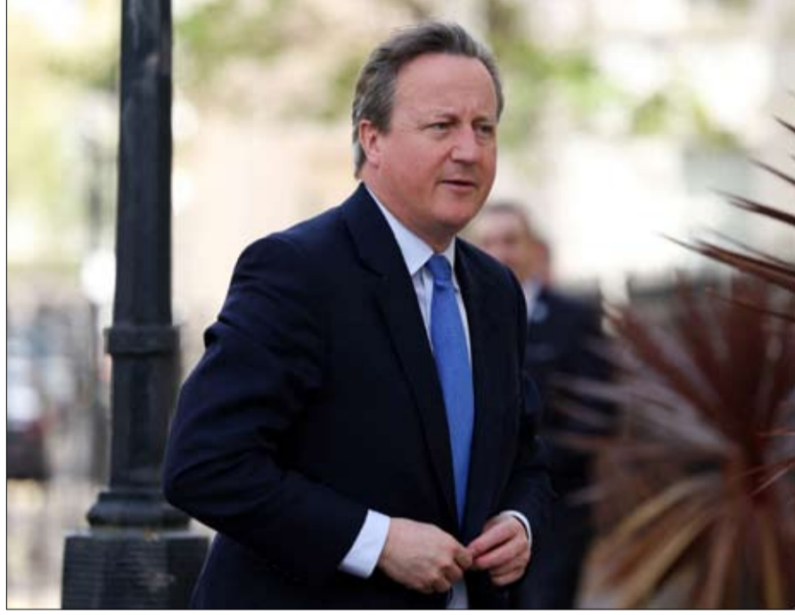
رئيس الدبلوماسية البريطانية، ديفيد كامبيرون

كان للتدخل الفوري لحلفاء إسرائيل لاعتراض مئات الطائرات بدون طيار والصواريخ التي أطلقتها إيران ضد أراضيها ليلة السبت 13 أبريل-نيسان