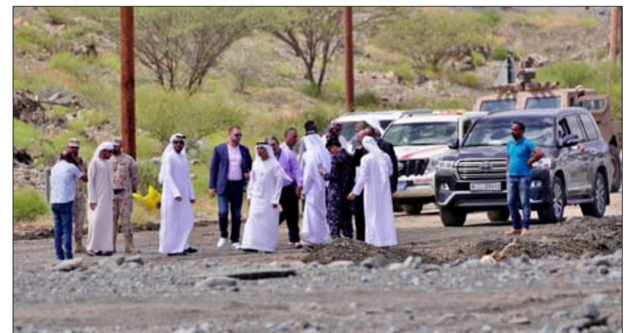
•• رأس الخيمة-وام:

وجه اللواء علي عبد الله بن علوان قائد عام شرطة رأس الخيمة رئيس فريق الطوارئ والأزمات والكوارث المحلي الفريق بالنزول الميداني للوقوف عن كثب على آثار المنخفض الجوي الأخير ورفع التقارير اللازمة التي تتطلب حولا عاجلة تعزيزاً للاستجابة الفورية وتدوين الملاحظات التي من شأنها أن تسهم في عودة الحياة إلى طبيعتها لضمان الحفاظ على السلامة العامة، وفق منظومة استباقية متكاملة من الإجراءات المتعلقة بتصريف الأمطار، وآليات الاستجابة السريعة والفورية، للتعامل بالحالات الطارئة والبلاغات عند حدوثها، على