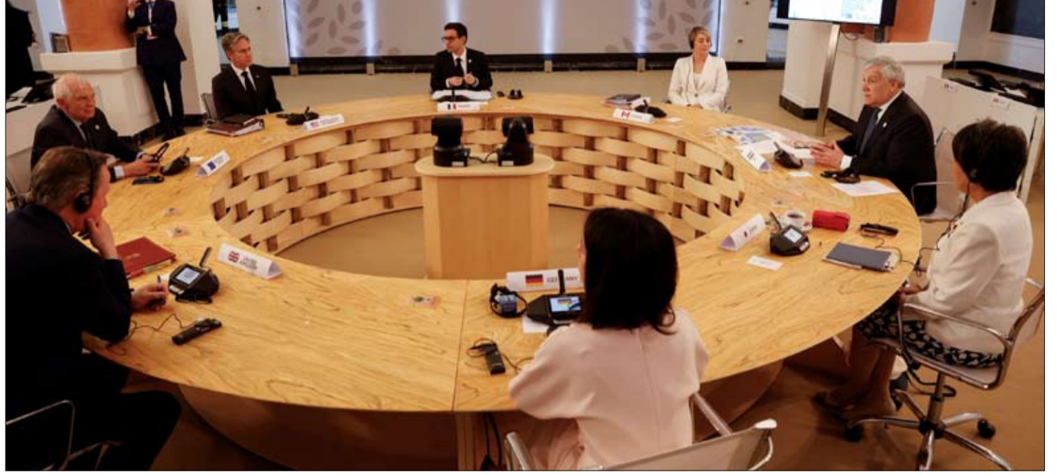
مجموعة السبع تبحث تطورات الأوضاع

المبادرة الأكثر شعبية هي مبادرة جمهورية التشيك، والتي تتألف من عمليات شراء جماعية لمئات الآلاف من قذائف المدفعية خارج الاتحاد الأوروبي. ظلت البلاد تحشد قواها منذ أشهر لإفناء الدول الأخرى بتحويل صندوق يهدف إلى شراء الذخيرة التي لا يستطيع الاتحاد الأوروبي إنتاجها بكميات كافية. وفي يوم الاثنين، أشار رئيس الوزراء التشيكي بيتر فيالا، في عمود بصحيفة فايننشال تايمز البريطانية اليومية، إلى أن بلاده تعمل على العثور على 300 ألف قطعة ذخيرة، وأنه سيتم تسليم 180 ألف قطعة منها إلى الجبهة الأوكرانية في الأشهر المقبلة.