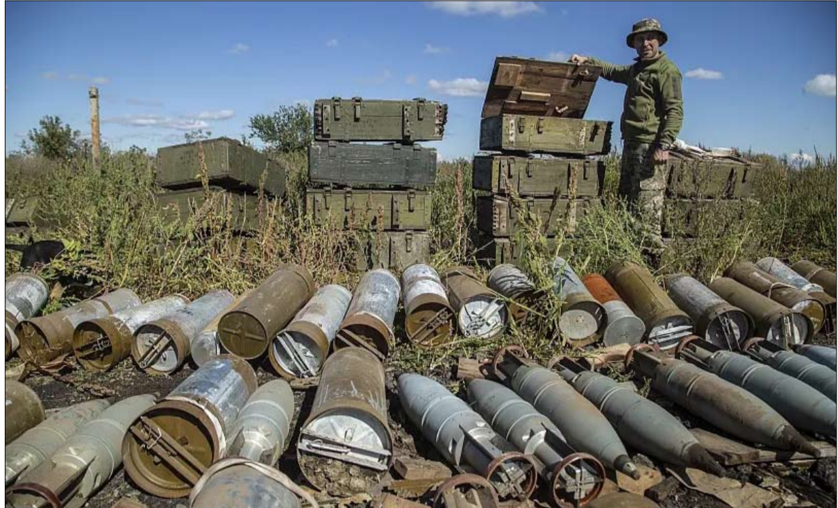
أوكرانيا تعاني نقص الذخيرة

ويضيف: «من الصعب جدًا قبول اعتبارك شريكًا من الدرجة الثانية، على شبكات التواصل الاجتماعي. وأدنى مؤسس المنظمة الخيرية المخصصة للجيش، العودة حيا، فيتالي دينيغيا، بهذه الملاحظة: «الحياة الأوكرانية أقل قيمة من الحياة الإسرائيلية. بالطبع يمكننا إلقاء اللوم على الشركاء والدول الغربية. ولكن ماذا ستغير هذا؟» ولم يُخف الرئيس الأوكراني أيضًا مرارته مساء الاثنين في خطابه للأمم. وقال فولوديمير زيلينسكي، «من خلال الدفاع عن إسرائيل، أثبت العالم الحر أن مثل هذه الوحدة ليست ممكنة فحسب، بل فعالة أيضًا بنسبة