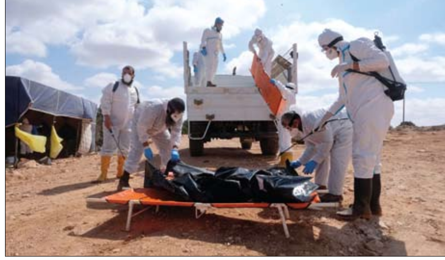
متطوعون يقومون بتطهير جثة قبل دفنها في مقبرة جماعية، في درنة.

المنطقة الأولى هي المنطقة الأشد ضرراً ويمنع الدخول إليها إلا من قبل الفرق الطبية والإسعاف والطوارئ وفرق الإنقاذ على أن يمنع دخول المواطنين إليها. والثانية هي المنطقة الهشة، وهي أقل ضرراً من الأولى، ويمنع دخول النساء والأطفال إليها ومعهم كبار السن، ويسمح فقط لأزياب الأسر بالدخول من أجل متابعة الأرزاق لا أكثر، على أن يمنع شرب المياه فيها منعاً باتاً بسبب اختلاط مياه الشرب بالمياه الجوفية، مؤكداً أن التحاليل أثبتت ذلك. أما المنطقة الثالثة، فهي المنطقة