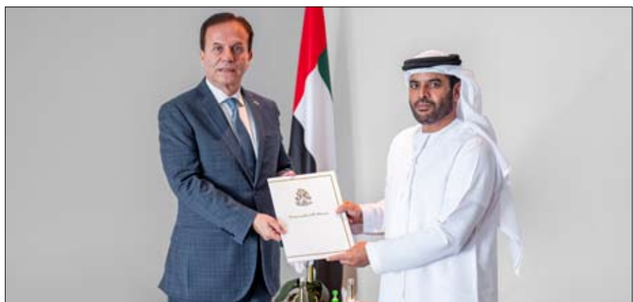
محمد بن زايد آل نهيان رئيس الدولة "حفظه الله".