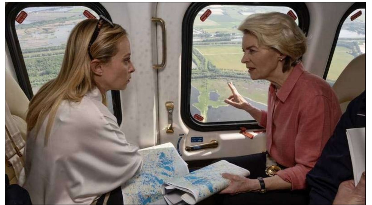
رئيسة المفوضية الأوروبية ورئيسة وزراء إيطاليا يعاينان مناطق تدفق اللاجئين في جزيرة لامبيدوزا

وبالتالي، ترغب المفوضية في تسهيل نقل الأشخاص الذين يصلون إلى لامبيدوزا إلى دول أوروبية أخرى. ولكن هل سيسمع حقا إلى ما هو أبعد من هذه التصانح؟ لقد أكدت برلين نهاية هذا الأسبوع أن ألمانيا أظهرت دائما تضامنها وستواصل ذلك. قبل أن تصيغ أن عمليات النقل التي تنص عليها آلية التضامن الأوروبية الطوعية يمكن إعادة تنفيذها في أي وقت إذا أوفت إيطاليا بالتزامها بإعادة اللاجئين، ”وفقا لقواعد الاتحاد الأوروبي. علاوة على ذلك، ظل الاتحاد الأوروبي يناقش الأمر دون نجاح منذ ذلك الحين وتم خلال هذه الأشهر التوصل إلى اتفاق بشأن اللجوء والهجرة يهدف إلى تنسيق السياسات الأوروبية. وينص هذا النص على زيادة الفحص على الحدود، وتطوير اتفاقيات إعادة القبول في بلدان الأصل لأولئك الذين تم رفض حقهم في اللجوء، وإنشاء آلية تضامن تلزم دول الاتحاد الأوروبي باستقبال عدد معين من