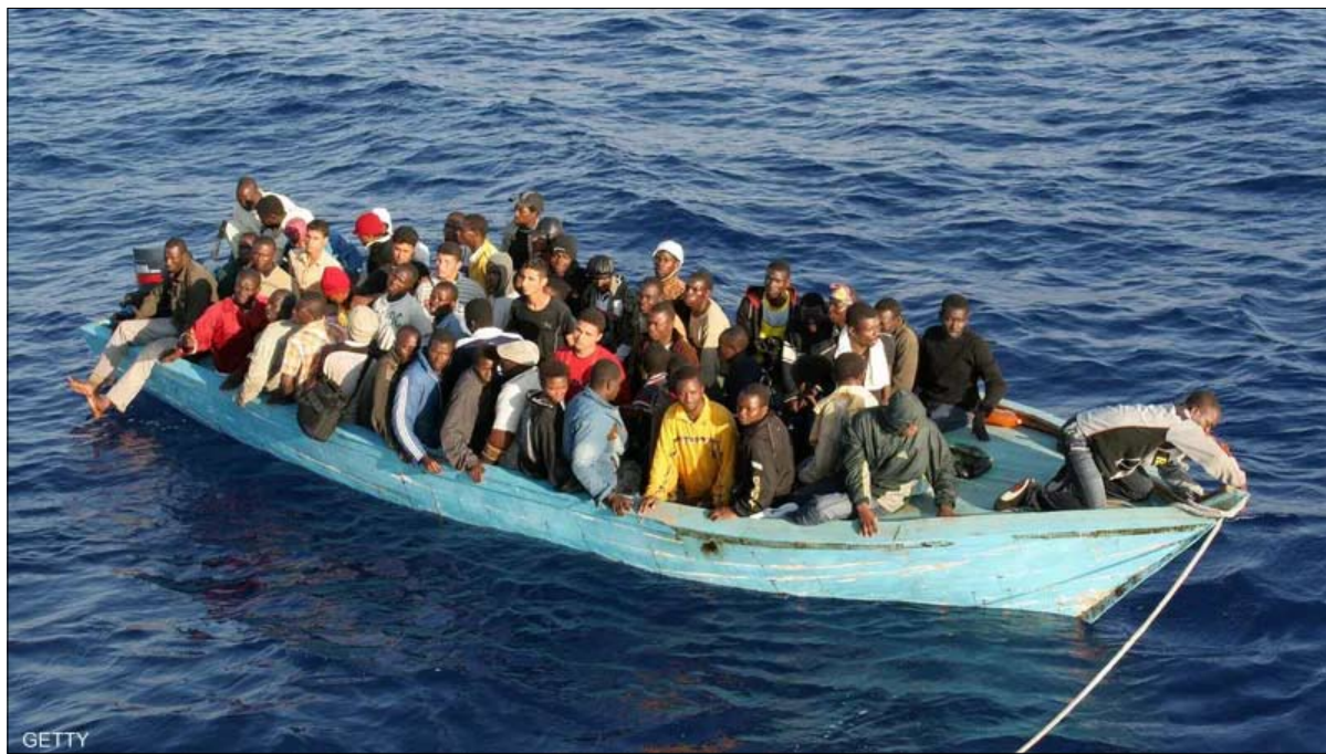
ارتفاع حاد في عدد المهاجرين الذين يستقون قوارب إلى لامبيدوزا

بينما وصل آلاف المهاجرين إلى جزيرة لامبيدوزا في الأيام الأخيرة، توجهت رئيسة المفوضية الأوروبية إلى عين المكان لتعاین تدفق أعدادهم الكبيرة وتحديات وجودهم على الأراضي