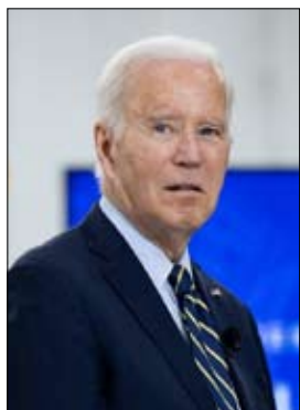
جوزيف بايدن، أكبر رئيس أميركي في تاريخ الولايات المتحدة، إنه يتفهم التركيز على سنه لكنه سيخوض السباق إلى البيت الأبيض لأن دونالد ترامب يريد "تدمير" الديمقراطية الأميركية.

قال جو بايدن، أكبر رئيس أميركي في تاريخ الولايات المتحدة، إنه يتفهم التركيز على سنه لكنه سيخوض السباق إلى البيت الأبيض لأن دونالد ترامب يريد "تدمير" الديمقراطية الأميركية. وعادة ما يتجنب الرئيس البالغ 80 عاماً ذلك ولكنه تطرق إليها خلال حملة لجمع تبرعات في مسرع في برودواي في نيويورك، موضحاً أن تجربته ساعدته في التعامل مع أزمات مثل الحرب في أوكرانيا وجائحة كوفيد، وأضاف بايدن "يبدو أن كثراً يركزون على سنّي. أنا أقفم ذلك، صدقوني، أعرف ذلك أكثر من أي شخص آخر، وتابع "أنا سأترشح لأن الديمقراطية على المحك، لأنه في العام 2024 سيكون مصير الديمقراطية مرتبطاً بورقة الاقتراع مجدداً. ليكن واضحاً، دونالد ترامب والجمهوريون المناصرين له مصممون على تدمير الماضي إلى عدم الترشح، قائلًا إن بايدن