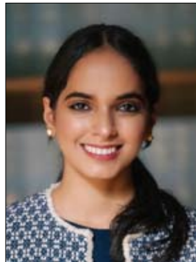
دبي أبو الهول