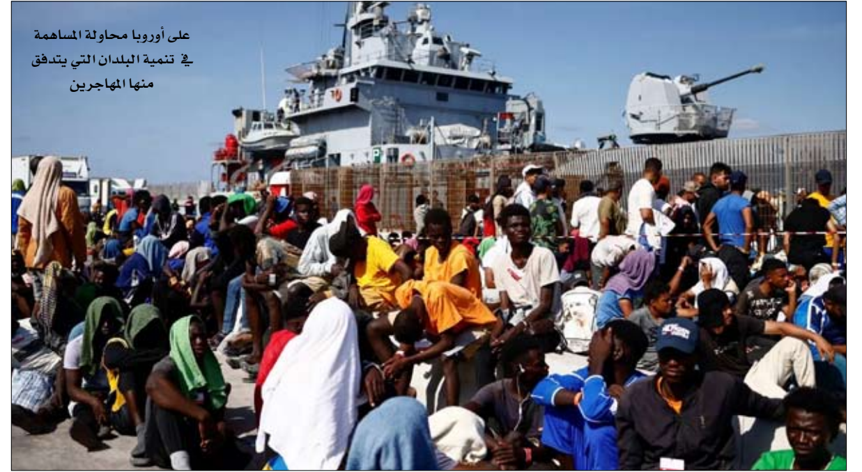
على أوروبا محاولة المساهمة في تنمية البلدان التي يتدفق منها المهاجرين