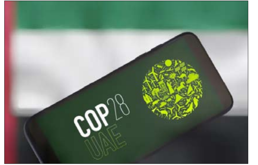
الإمارات عاصمة المعارض والمؤتمرات العالمية