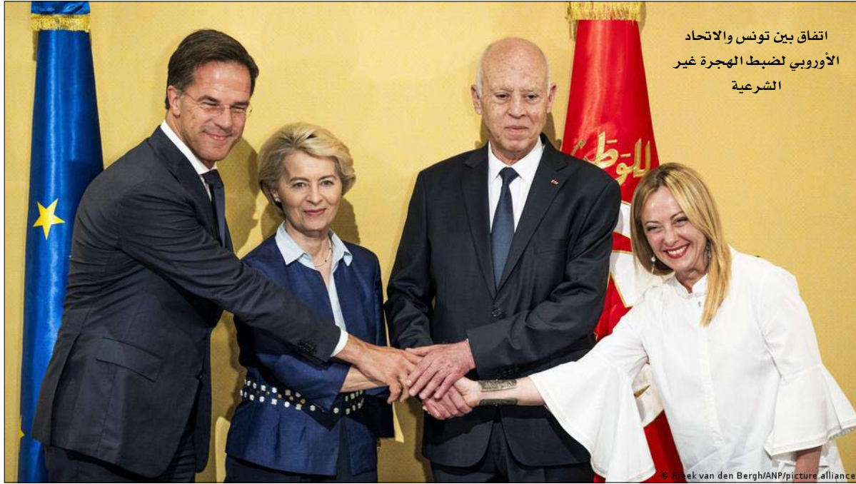
اتفاق بين تونس والاتحاد الأوروبي لضبط الهجرة غير الشرعية

وقالت رئيسة المفوضية أورسولا فون دير لاين إن أوروبا ستكون حاضرة، وأعلنت بعد زيارة قصيرة إلى مركز الاستقبال في لامبيدوزا إن ”الهجرة غير النظامية تشكل تحديا أوروبيا يحتاج إلى استجابة أوروبية“. وفي هذه الأثناء قدمت رئيس المفوضية خطة طوارئ لمساعدة إيطاليا في حين اعترضت روما و برلين في الأيام الأخيرة، على تطبيق القواعد الأوروبية المتعلقة برعاية المهاجرين الذين تم رفض حقهم في اللجوء. بالنسبة لروما، فإن حالة الطوارئ موجودة، ويمكن رؤيتها بوضوح في لامبيدوزا. في غضون أيام قليلة، استقبلت الجزيرة الصغيرة ما يقرب من 11 ألف مهاجر، أي ما يقرب من ضعف عدد السكان المحليين الذين قدموا على متن عشرات القوارب الصغيرة من شمال إفريقيا. وقد تم إعداد مركز استقبال خاص لاستيعاب 400 شخصا سرعان ما تجاوز طاقة