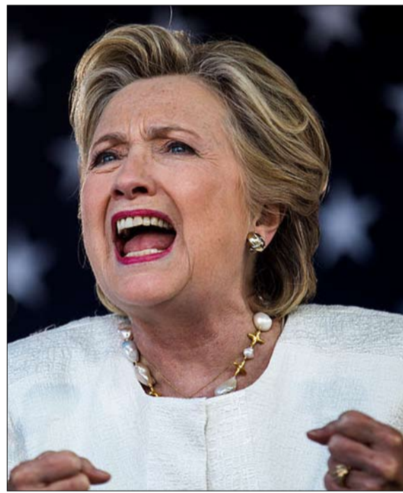
هيلاري مهدت الطريق

هذا الغموض حول هذه القضية. ففي استطلاع للرأي أجرته إيبسوس / ديلي بيست، قال 74 بالمئة من الأمريكيين إنهم مرتاحون لإمكانية وصول امرأة رئيسة، لكن 33 بالمئة فقط يعتقدون أن جيرانهم يشاركوهم هذا الصفاء. نعوت تمييزية إن قضية التمييز على أساس الجنس تتجاوز مسألة القدرة على هزم ترامب. خلال حملتها