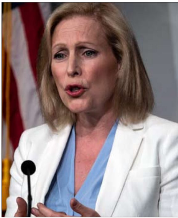
كريستين جيلبيراند تخلت عن المناهضة

الانتخابية، تم تصوير وارن على أنها "استاذة قاسية" أو "أخلاقية" أو "كاشطة" أو "حاددة" أو "صاحبة" أو "مشاهدة"، وهي نعوت تنسب حتماً إلى النساء اللواتي خطيئتهن الوحيدة هي عدم الخجل من