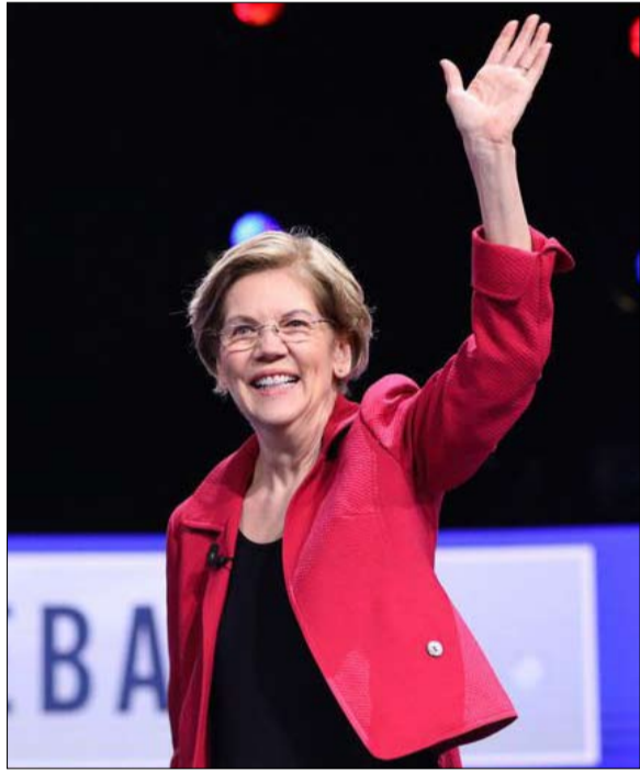
إليزابيث وارن ترمي المتدبل

طموحهن ومؤهلاتهن. في النهاية، إن حقيقة كون إليزابيث وارن امرأة ليست السبب الرئيسي لهزيمتها، تقول كيلي ديتمار من مركز النساء الأمريكيات والسياسة، لكن ذلك لعب دوراً وقد عدت وارين، عندما أعلنت اعتزالها يوم الخميس، بأن "لديها الكثير لتقوله لاحقاً في هذا الشأن". وستكون بلا شك قادرة على تسليط الضوء على التقدم المحرز، حقيقة أنها جعلت الآلاف النساء تحلمن، وأنها أبرمت مع مئات الفتيات الصغيرات، هذا الوعد بـ "أن تكن مرشحات للرئاسة لأن هذا ما تفعله الفتيات.. وفي غياب الرئاسة، يمكن لوارن تسليط الضوء على التقدم المحرز في مجال السياسة بالنسبة للمرأة، ويرجع الفضل في ذلك إلى حد كبير لها وإلى هيلاري. في دراسة مثيرة عام 2019 حول "أسطورة القابلية لأن تُنتخب" المرأة، استعرض فينك شاتك التفسير الديمقراطي لهذا التقدم. وخلال ست سنوات، زاد عدد المرشحات بنسبة 40 بالمئة في الكونغرس و27 بالمئة في المجالس التشريعية للدولة... إنه ليس البيت الأبيض بعد، لكنه يهدم الطريق عن لئونفوال أوبسرفاتور