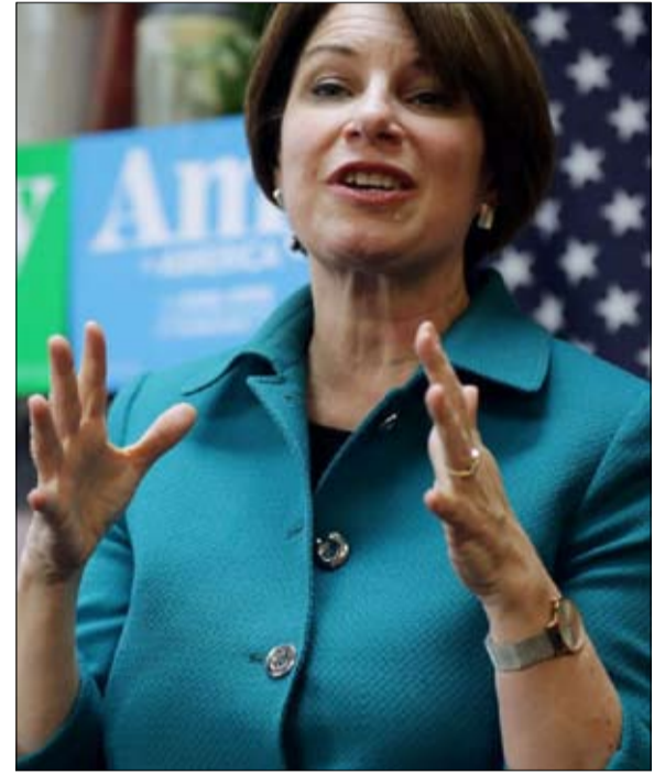
أمي كلوبشار عاشت نفس المعاناة

عندما سُئلت إليزابيث وارين عما إذا ساهم التحيز الجنسي في هزيمتها، قدمت هذا الجواب المثالي: «هذا سؤال فخ للنساء. إذا قلت: نعم، كان هناك تحيز جنسي في هذه الحملة»، سيرد عليك الجميع أنك: «بكأة وترفضين الهزيمة»! وإذا قلت، «لا، لم يكن هناك تحيز جنسي»، ستقول ملايين النساء، «على أي كوكب تعيش هذه؟» تحيز جنسي، أم لا؟ حقيقة لا يمكن إنكارها؛ إذا وضعنا جانباً المترشحة العرضية تولسي غابارد، لم تعد هناك أي امرأة (ولا أي مرشح ملون) في السباق الرئاسي الديمقراطي.