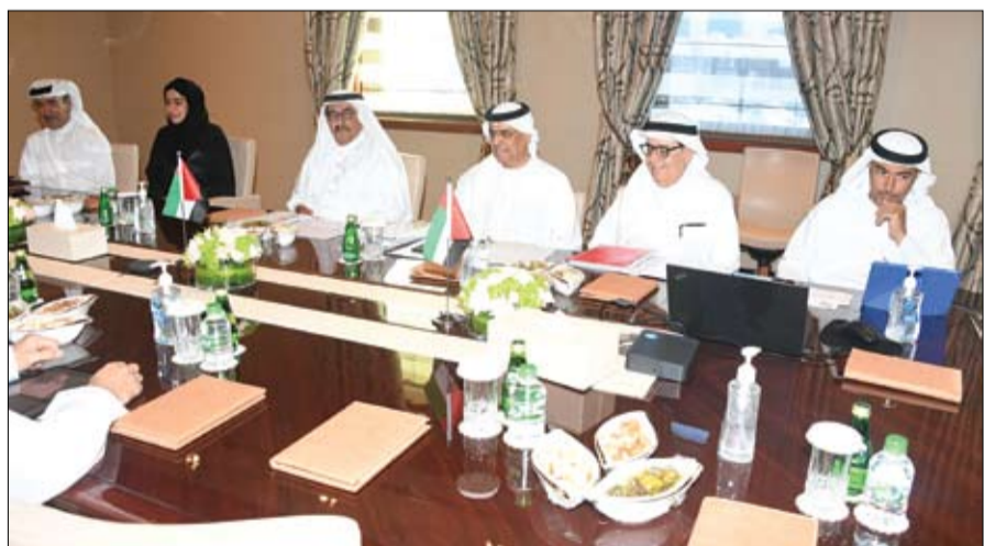
وتسعى الخدمة كذلك إلى تسهيل وصول المسنين إلى الخدمات المختلفة وتهئية البيئة التمكينية ووسائل الدعم من الأجهزة الطبية والمعينات المختلفة بما يتناسب مع احتياجاتهم.