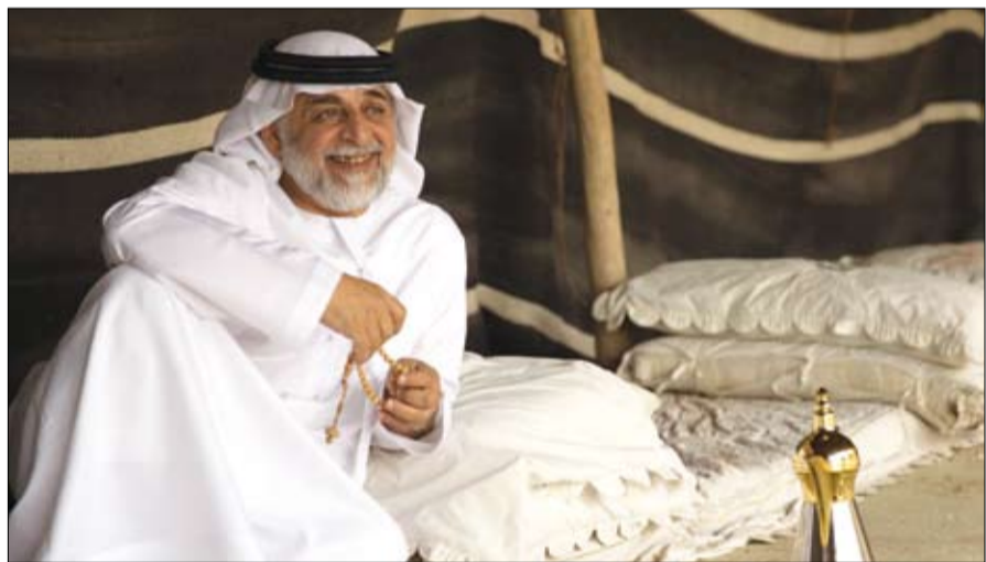
وتسعى الخدمة كذلك إلى تسهيل وصول المسنين إلى الخدمات المختلفة وتهئية البيئة التمكينية ووسائل الدعم من الأجهزة الطبية والمعينات المختلفة بما يتناسب مع احتياجاتهم.

الخطورة على المسن وأسرتهم من خلال بناء شراكات فاعلة مع مقدمي الخدمات، وتقديم الرعاية الاجتماعية والنفسية والصحية والنهائية الوقائية والعلاجية والتثقيفية والمنزلية للمسنين في بيئاتهم الأسرية لتمكينهم من البقاء داخل نطاق أسرهم أطول وقت ممكن، وتقديم أسر المسنين بمطالباتهم والخدمات التي توفرها الدولة وآلية الحصول عليها، وتشجيعهم على رعايتهم في المنزل بأسلوب سليم.