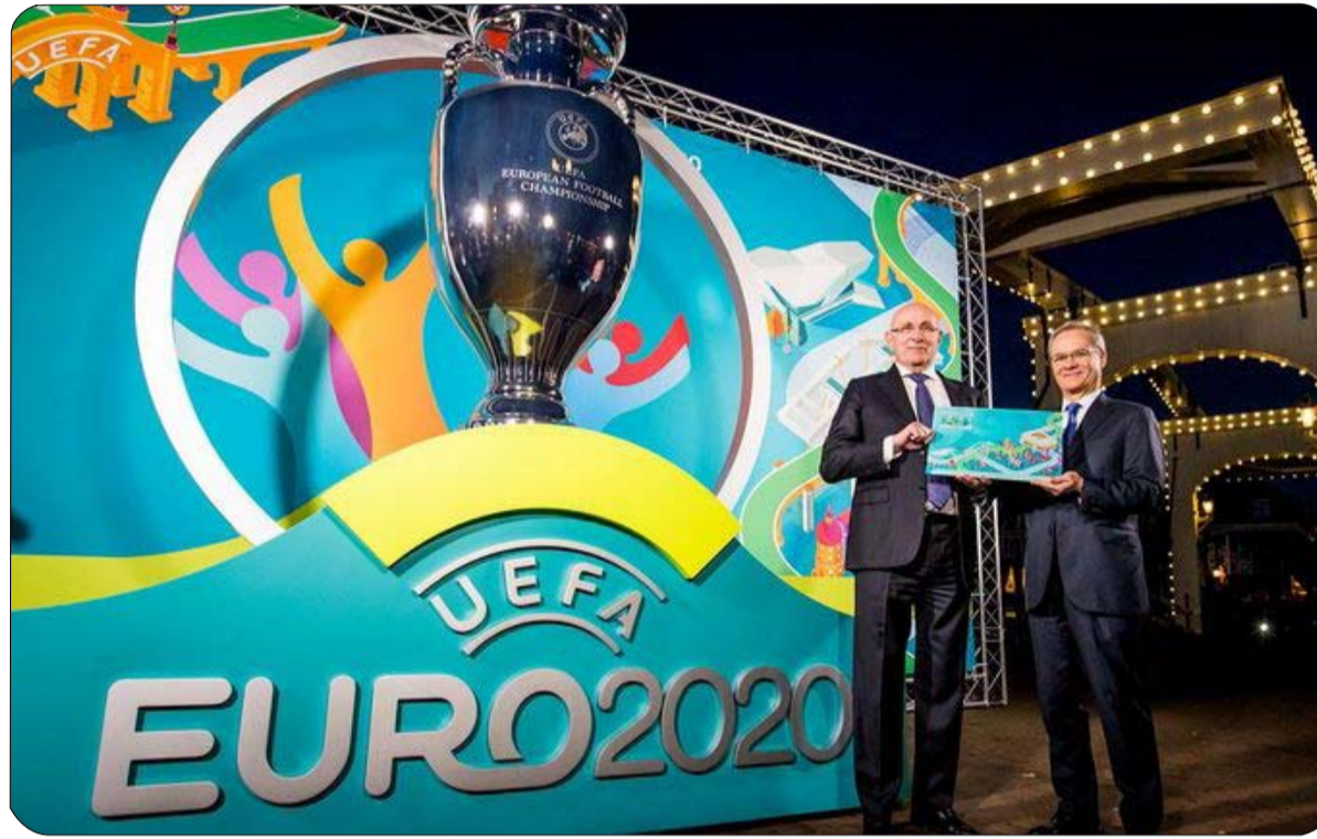
الأقل، بعد القيود الكبيرة التي فرضها الفيروس والإجراءات الصارمة العتمدة للحد من انتشار وباء أودى بحياة أكثر 7063 شخصا حتى صباح الثلاثاء.

وكان ويضا قد أشار الى ان اجتماعه اليوم سيبحث في مصير "كل البطولات الوطنية والمسابقات القارية، إضافة الى كأس أوروبا 2020" التي تفرض تحديات إضافية هذا العام كونها مقررة في 12 مدينة موزعة في 12 بلداً، بدلا من إقامتها كالعادة في بلد أو بلدين. ويحسب مصدر معني بكرة القدم العالمية، كان ويضا أمام احتمال وحيد هو تأجيل المنافسات المقررة. وقال المصدر في تصريحات سابقة "لا خيار أمام ويضا: يجب تأجيل كأس أوروبا ودوري الأبطال في الوقت عينه، وتابع "يجب ان يعود الجميع الى الطاولة عندما تنتهي الأزمة لإعادة جدولة كل شيء. يجب عندها إعادة إعداد كل الروزنامة العالمية" للأحداث الرياضية، والتي تعرضت لتأثير هائل بسبب الفيروس. وبدأت في الأيام الأخيرة الدعوات لإرجاء منافسات المسابقتين القاريتين وبطولة كأس أوروبا، لاسيما من إيطاليا التي تعد الأكثر تضررا من الفيروس في القارة العجوز، وكانت الأولى من بين دولها الكبرى التي أعلنت وقف كامل المنافسات الرياضية حتى الثالث من نيسان-أبريل. ويحسب التقارير، يفسح تأجيل النهائيات المجال أمام استكمال البطولات الوطنية والمسابقتين القاريتين في حزيران/يونيو. ونقلت هيئة الاذاعة البريطانية "بي بي سي" الاثنين ان من بين الاقتراحات استكمال مسابقتي الأندية بصيغة مختصرة، أي إقامة ربع النهائي ونصف النهائي من مباراة واحدة بدلا من مباراتي ذهاب وإياب. ويجد ويضا نفسه أمام مروحة خيارات شديدة التعقيد، نظرا لأن أي قرار بشأن التمتي من الموسم الحالي أو متعلق بالموسم المقبل، سيرتبط بالعديد من العوامل المتداخلة محليا وقاريا، ويحتاج إلى دراسة من جوانب مختلفة، منها الصحي والتنظيمي والمالي والتعاقد وغيرها.