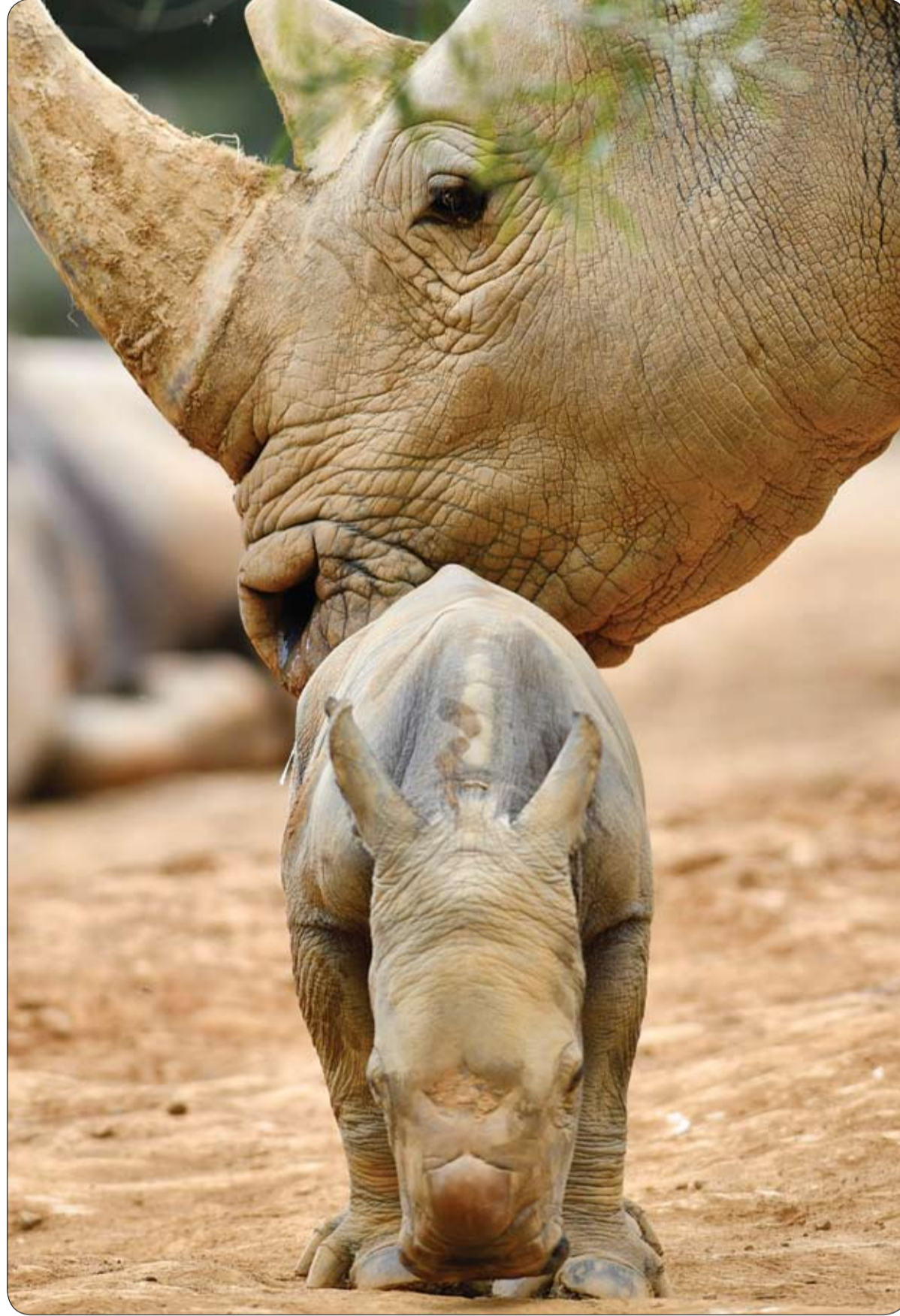
صغير وحيد القرن الأبيض الجنوبي يبلغ من العمر يوماً واحداً يقف بجانب والدته في منتزه قرية ليوفو بشمال تايوان. ا ف ب

قضت محكمة يوكوهاما في اليابان، بعبودية الإعدام لرجل قتل 19 شخصا يعانون من إعاقات عقلية في العام 2016، في واحدة من أسوأ جرائم القتل في تاريخ البلاد. ولم ينف ساتوشي يوماتسو البالغ من العمر 30 عاما التهمة الموجهة له بقتل الأشخاص في مركز متخصص للمعاقين عقليا في ضاحية طوكيو حيث كان يعمل سابقا. ونقلت وكالة "فرانس برس" عن القاضي كيوشي أونوما قوله: "لقد سلبت حياة 19 شخصا هذا أمر في غاية الخطورة ولا مجال للرافة". وكانت النيابة العامة قد طلبت إنزال عقوبة الإعدام على المتهم، في حين دفع محامو يوماتسو ببراءته خلال المحاكمة، مؤكداً أن موكلهم كان "مضطربا عقليا" عند وقوع الجريمة بسبب تناوله المخدرات. لكن القاضي قال ردا على ذلك: "لقد خطط لفعليته مسبقا وكان ينوي القتل. ولا يمكننا هنا أن نقول إنه يعاني من أمراض عقلية مرتبطة بالماريفونا". يذكر أن يوماتسو تسلل إلى مركز للمعاقين في ضاحية طوكيو حيث كان يعمل سابقا، ليلا عندما كان معظم القيمين فيه نياما. وانتقل من غرفة إلى أخرى لطعن القيمين فيه مما أدى إلى مقتل 19 شخصا وإصابة 26، نصفهم بجروح خطيرة. وتوجه بعد ذلك إلى مركز للشرطة وكان لا يزال يحمل السكاكين الممزجة بالدماء واعترف بجريمته.