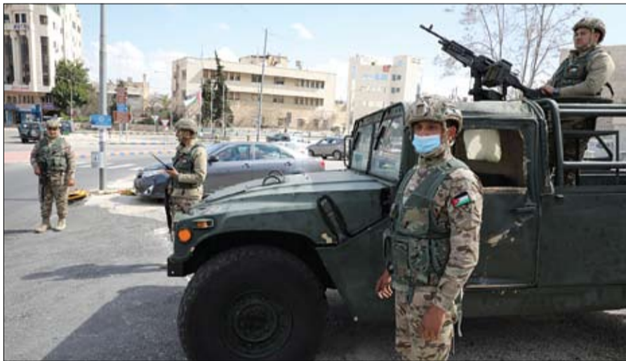
جنود من الجيش الأردني أمام أحد الفنادق تحول إلى مقر للحجر الصحي

أصدر مجلس الإمارات للإفتاء فتوى حول أحكام أداء العبادات الجماعية وذلك نظراً لما تقتضيه الصحة العامة في التعامل مع فيروس كورونا المستجد كوفيد - 19 وضرورة تعاون جميع الجهات في الدولة للتصدي لهذا المرض والحد من فشوه واعتبارا لوجوب طاعة ولي أمر المسلمين في كل ما يأمر به من تعليمات. (التفاصيل ص2)