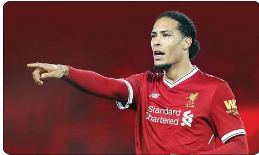
نتيجة في المباريات الأربع هي على أذى الفريق بشكل جيد في سلسلة مباريات وخسرنا جهود (كريس) فيدرا ونجح في تعويضه، وقال دايك: "ربما تكون أهم الأزرع الفوز على ساوثامبتون،

اختير مدرب بيرنلي شون دايك كأفضل مدرب في الدوري الإنجليزي الممتاز لكرة القدم خلال فبراير "شباط" الماضي، متفوقاً على مدرب آرسنال ميكيل أرتيتا، ومانشستر يونايتد أولي جونار سولشار ومدرب شيفيلد يونايتد كريس وايلدر. ولم يخسر بيرنلي في فبراير "شباط"، وفاز على ساوثامبتون وبورنموث وتعادل مع آرسنال ونيوكاسل يونايتد، وخرج فريق دايك بشباك نظيفة ثلاث مرات خلال تلك الفترة واستقبل هدفاً واحداً ليقتفز إلى المركز العاشر في جدول الترتيب.