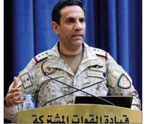
العقيد الركن تركي المالكي

البحرية والتجارة العالمية بمضيق باب المندب وجنوب البحر الأحمر. وأوضح أن المليشيا الحوثية تتخذ من محافظة الحديدة مركزا لإطلاق الصواريخ الباليستية، والطائرات بدون طيار، والزوارق المفخخة والمسيرة عن بعد، وكذلك نشر الألغام البحرية عشوائيا، في انتهاك صارخ للقانون الدولي الإنساني. وبحسب المالكي، فإن مليشيا الحوثي تنتهك نصوص اتفاق ستوكهولم واتفاقية وقف إطلاق النار بالحديدة، حيث بلغ عدد الزوارق المفخخة والمسيرة عن بعد التي تم رصدها وتدميرها 46، وبلغ عدد الألغام البحرية التي تم اكتشافها وتدميرها 153. وأشار إلى أن قيادة القوات المشتركة للتحالف تواصل تنفيذ الإجراءات الصارمة والردعة ضد هذه المليشيا الإرهابية، وتحييد وتدمير مثل هذه القدرات التي تهدد الأمن الإقليمي والدولي.