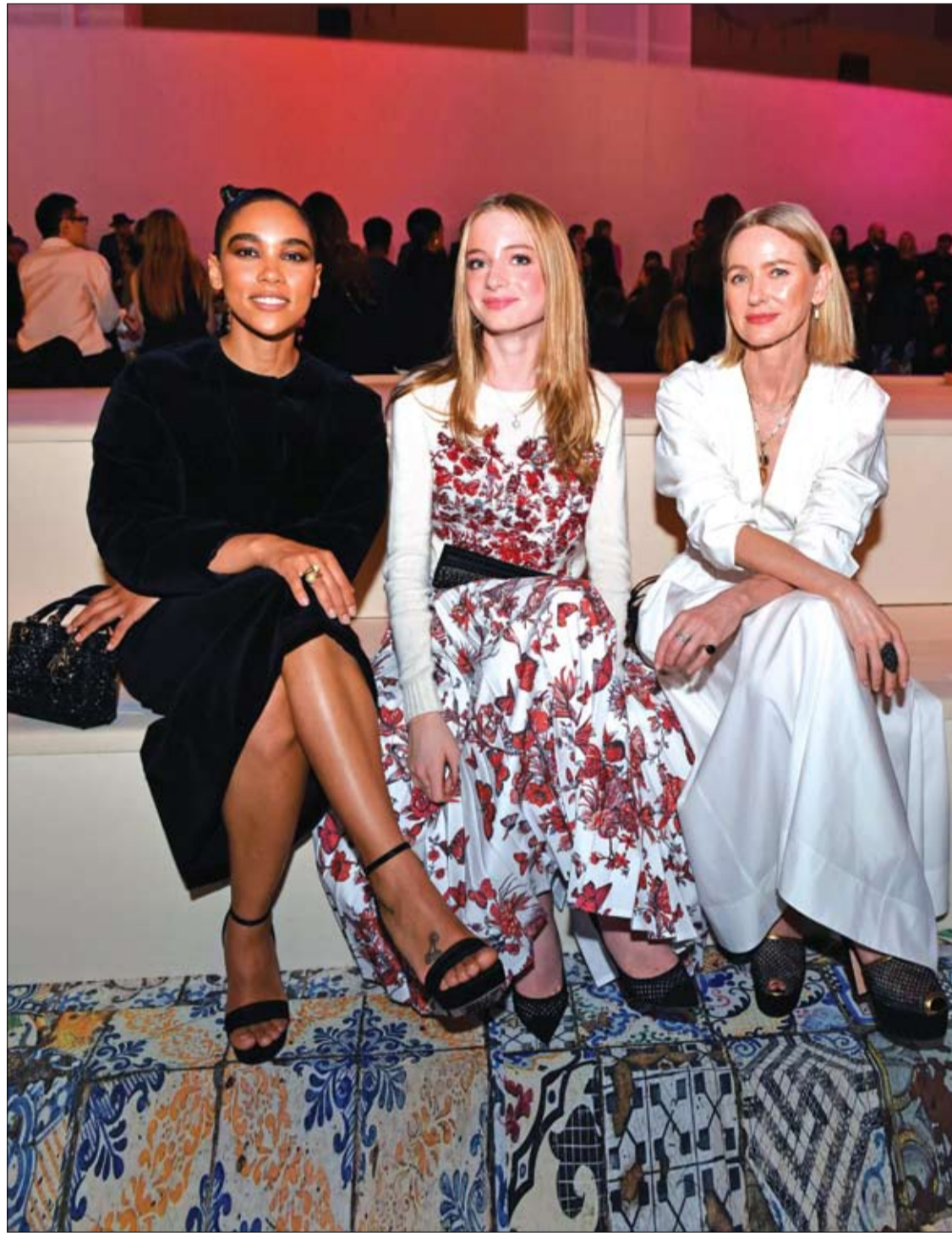
الممثلة الأمريكية ألكسندرا شيب والممثلة البريطانية ناعومي واتس وابنتها كاي تحضر عرض أزياء ديور لما قبل الخريف في متحف بروكلين في نيويورك.

هو مرض عصبي يؤدي إلى العمى الكامل. ينجم هذا المرض عن عدم انتقال الصورة عبر ألياف العصب البصري، ما يؤدي إلى تضيق المجال البصري. ويعتبر ارتفاع الضغط داخل العين أحد أعراض الغلوكوما. وتسمح استشارة طبيب العيون بصورة دورية ومراقبة مستوى الضغط داخل العين بتشخيص المرض مبكراً وعلاجه باستخدام الأدوية وقطرات خاصة وعملية باستخدام أشعة الليزر وفي الحالات الحرجة الخضوع لعملية جراحية لإبطاء تطور المرض والحفاظ على الرؤية لسنوات طويلة.