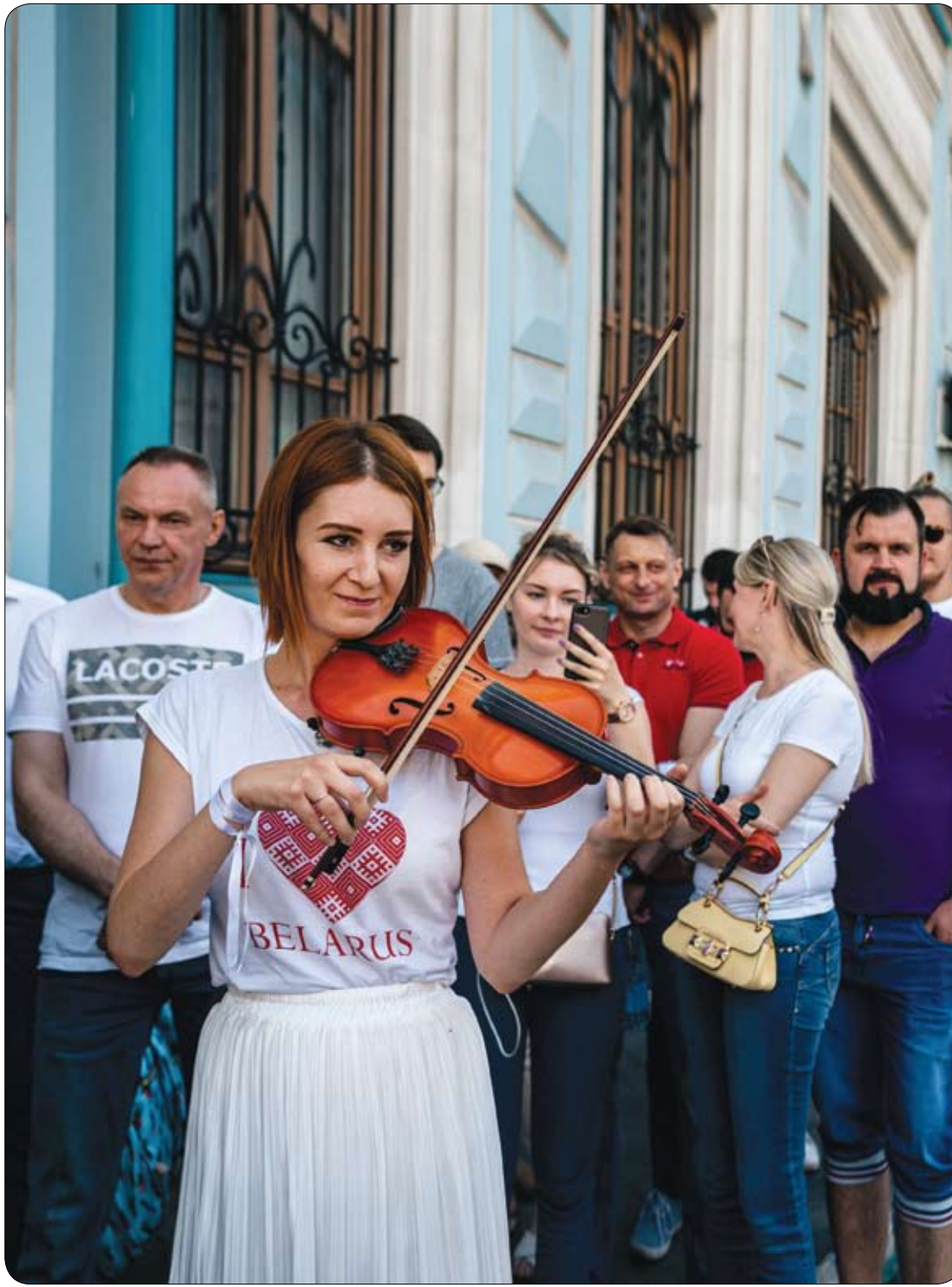
امرأة تعزف على الكمان أثناء وقوفها في طاير أمام السفارة البيلاروسية للإداء بصوتها في الانتخابات الرئاسية في موسكو.

يمكنك اتباع مجموعة من الطرق للوقاية من التسمم الغذائي، لعل أبرزها: - غسل اليدين جيداً بالماء الدافئ والصابون قبل وبعد تحضير الطعام. - تنظيف أواني وأدوات الطبخ والأواني التقطع جيداً بالماء الساخن والصابون. - الترتيب الصحيح للأطعمة في الثلاجة، حيث توضع الأغذية الجاهزة للأكل في الأعلى، والأغذية النيئة في الأسفل. - عدم خلط الأغذية النيئة مع باقي الأطعمة عند إعداد الطعام وعند التسوق. - عدم استخدام الأدوات غير الآمنة والمكسورة. - طبخ الطعام بدرجة حرارة لا تقل عن 62 درجة مئوية فأعلى، حسب نوع الطعام، لقتل الكائنات الحية الضارة في داخله (يمكنك استخدام ميزان الحرارة الخاص بالطعام لمعرفة إذا ما تم طهي الأطعمة في درجات حرارة آمنة). - استهلاك الطعام خلال ساعتين من تحضيره، وفي حال عدم استهلاكه يوضع في الثلاجة (إذا كانت درجة حرارة الغرفة أعلى من 32 درجة مئوية، يجب وضع الطعام في الثلاجة خلال ساعة واحدة). - تجميد الطعام المجمد بطريقة آمنة: إما بوضعه في البراد، أو عن طريق استخدام المايكروويف (خيار "فك التجميد") ثم طهيه على الفور. - التخلص من الطعام المخزن بشكل غير سليم، أو في حال الشك بسلامته. - نصيحة: حاولي عدم تناول الطعام في المطاعم المشكوك بها، واطلبي دائماً للحوم المطهية جيداً.