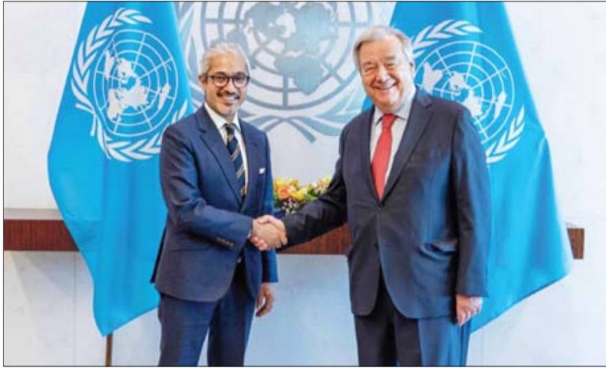
مكرم نائب رئيس الدولة رئيس مجلس الوزراء حاكم دبي "رعاه الله" وسمو الشيخ منصور بن زايد آل نهيان نائب رئيس مجلس الوزراء رئيس ديوان الرئاسة، وسمو الشيخ عبدالله بن زايد آل نهيان وزير الخارجية. وعقب اجتماعه مع معالي الأمين

الشرق الأوسط. وأشاد معالي أنطونيو غوتيرش، بالعلاقة الوثيقة التي تجمع دولة الإمارات والأمم المتحدة، والدور الهام الذي تضطلع به الدولة في بناء الجسور في الأمم المتحدة، وبشكل خاص خلال فترة عضوية الدولة في مجلس الأمن لعامين 2022-2023. كما أشنى معاليه على الجهود التي تبذلها دولة الإمارات على الصعيدين الإقليمي والدولي. وخلال مراسم تسليم أوراق الاعتماد، نقل سعادته إلى معالي الأمين العام للأمم المتحدة، تحيات صاحب السمو الشيخ محمد بن زايد آل نهيان رئيس الدولة "حفظه الله" وصاحب السمو الشيخ محمد بن راشد آل