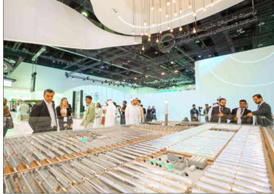
من 16 إلى 18 إبريل 2024

ضمن جهودها لمشاركة أفضل الممارسات وأحدث التقنيات في قطاعي الطاقة والمياه، تشارك هيئة كهرباء ومياه دبي في الدورة الـ 16 من القمة العالمية لطاقة المستقبل 2024، التي تستضيفها شركة أبوظبي لطاقة المستقبل (مصدر) من 16 إلى 18 إبريل 2024 في مركز أبوظبي الوطني للمعارض، وتعد من أبرز الفعاليات في مجال الطاقة المستدامة ودعم التحول نحو اعتماد مصادر الطاقة المتجددة والنظيفة. وتسلط الهيئة الضوء على منصتها في القاعة رقم 5 (قاعة الطاقة) على أبرز مشاريعها في قطاع الطاقة المتجددة والنظيفة، ومبادراتها الذكية وجهودها لدفع عجلة التنمية المستدامة وتعزيز التحول نحو الاقتصاد الأخضر، بما يرسخ دعائم مستقبل أكثر استدامة ويدعم مكانة دبي كعاصمة عالمية لطاقة المستقبل، ومن أبرز المشاريع والمبادرات التي تتضمنها منصة الهيئة: