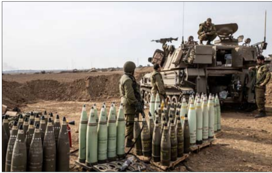
إسرائيل في ما يتعلق بالحد من الضحايا بين المدنيين وهو إلى حد كبير السبب في معارضة إدارته إحداث وزيادة المساعدات الغذائية بشكل واسع.

وبينما بدأت تنتشر مجاعة كارثية في غزة، يواجه المسؤولون في إدارة بايدن أسئلة يومية حول عدم اشتراط استمرار المساعدة العسكرية، بتغيير سلوك