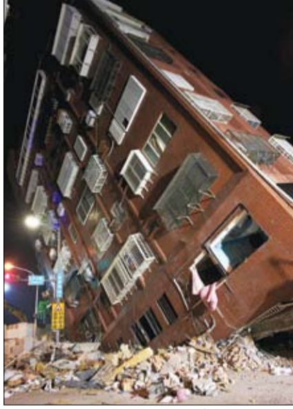
مبنى منهار جزئياً بفعل زلزال كبير ضرب شرق تايوان

هز زلزال، بقوة 7.2 درجة على مقياس ريختر، تايوان، أمس، وفقاً لإدارة الأرصاد الجوية المركزية، ما أدى إلى حدوث أمواج تسونامي صغيرة وصلت إلى بعض الجزر في جنوب غرب اليابان. ووقع الزلزال الساعة 07:58 صباحاً بالتوقيت المحلي، على عمق 15.5 كيلومتر. وقالت إدارة الأرصاد إن مركز الزلزال كان على بعد حوالي 25 كيلومتراً جنوب شرق هوالين في شرق تايوان. وأعقب ذلك العديد من الهزات الارتدادية القوية، بما في ذلك هزة بقوة 6.5 درجة. وقبرت هيئة المسح الجيولوجي الأمريكية قوة الزلزال بـ 7.4 درجة. وذكرت وسائل إعلام محلية أن بعض المباني هوالين تضررت بشدة، بسبب الهزات العنيفة. وأظهرت الصور مبنى منهاراً متعدد الطوابق. وتم تعليق خدمة القطارات عالية السرعة، وفقاً لتقارير محلية، كما تم تعليق خدمة النقل الجماعي السريع في المدن الكبرى، بما في ذلك تايبيه. وفي مدينة نيو تايبيه، التي تحيط بالعاصمة في شمال الجزيرة، انهار مستودع مما أسفر عن إصابة 3 أشخاص.