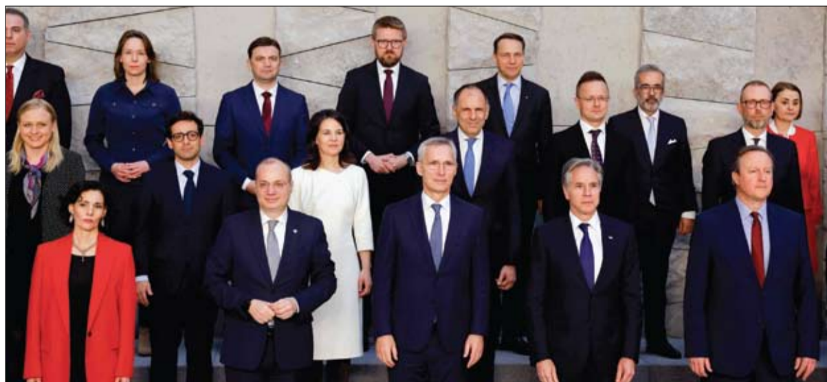
عدد من وزراء خارجية مجلس شمال الأطلسي وأمين عام الناتو في صورة رسمية بمقر الحلف في بروكسل.