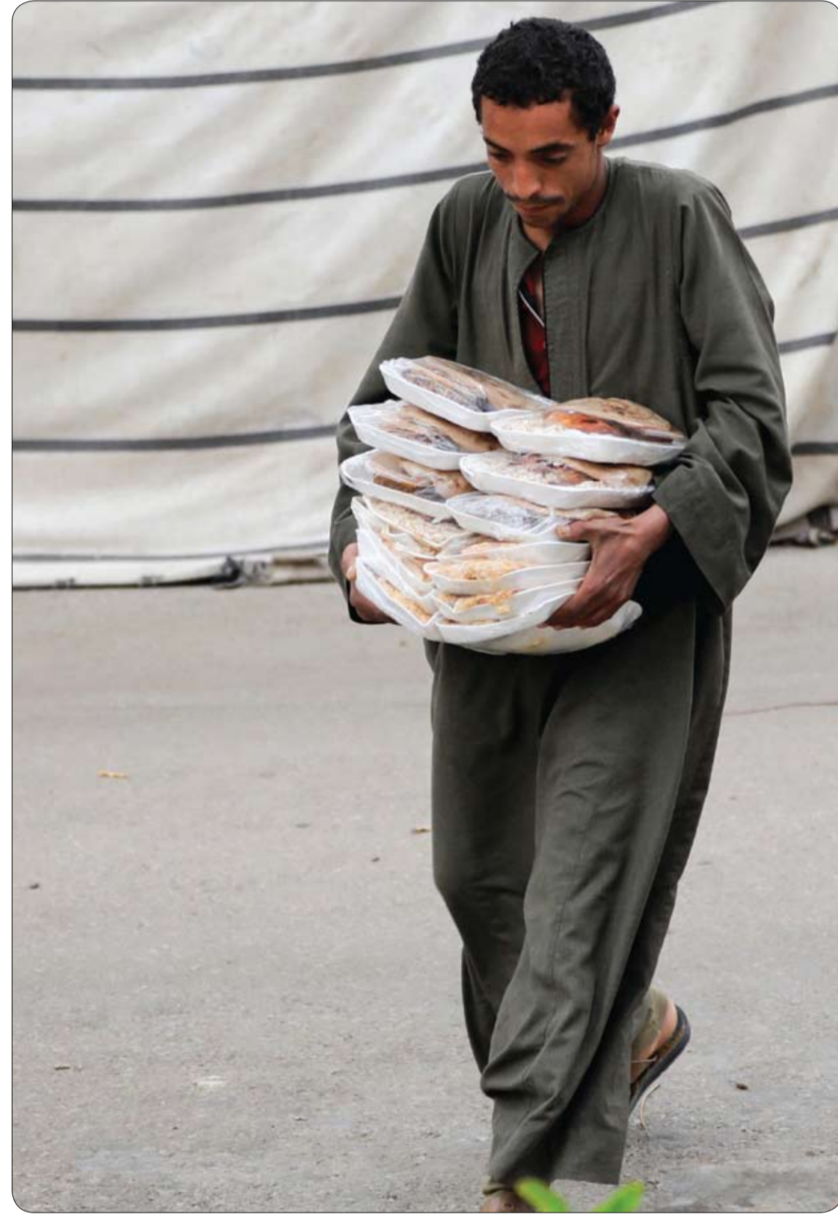
رجل يحمل وجبات ساخنة وزعها متطوعون على الصائمين خلال شهر رمضان المبارك في القاهرة، مصر

وجاء في بيان غينيس عام 2022 "في سن الخامسة، بدأ العمل مع والده ووخته في الزراعة وساعد في حصاد قصب السكر وحبوب البن". وأصبح بيريز رئيس بلدية قريته وكان مسؤولاً عن حل النزاعات المتعلقة بالأراضي والعائلات، بينما كان لا يزال يعمل في الزراعة.