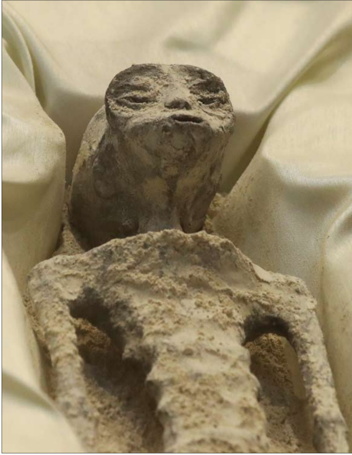
بقايا كائن «غير بشري» شوهدت معروضة خلال مؤتمر صحفي حول الأجسام الطائرة مجهولة الهوية، في قصر سان لازارو التشريعي، في مكسيكو سيتي.

تسلط NHS الضوء على أهمية لغة الجسد عند التواصل مع شخص مصاب بالخرف. يمكن للإيماءات والحركة وتعبيرات الوجه أن تنقل المعنى أو تساعدك في إيصال الرسالة. وتصبح لغة الجسد والاتصال الجسدي مهمين عندما يكون الكلام صعبا بالنسبة لشخص مصاب بالخرف. لذلك، إذا كان شخص ما يواجه صعوبة في التحدث أو الفهم، فيجب عليك: - التحلي بالصبر والهدوء، ما يساعد الشخص على التواصل بسهولة أكبر. - حافظ على نبرة صوتك إيجابية وودودة، حيثما أمكن ذلك. - تحدث معهم على مسافة محترمة لتجنب تخويفهم - أن تكون في نفس المستوى أو أقل مما هم عليه (على سبيل المثال، إذا كانوا جالسين) يمكن أن يساعد أيضا. - رتب على يد الشخص أو أمسكها أثناء التحدث معه للمساعدة في طمأننته وجعله يشعر بأنك أقرب - راقب لغة جسده واستمع إلى ما يقوله لتري ما إذا كان مرتاحا لقبامك بذلك. وتشمل الأعراض الأخرى للخرف ما يلي: - فقدان الذاكرة. - الصعوبة في التركيز. - الصعوبة في تنفيذ المهام اليومية المألوفة. - الخلط بين الزمان والمكان. - التغيرات في المزاج.