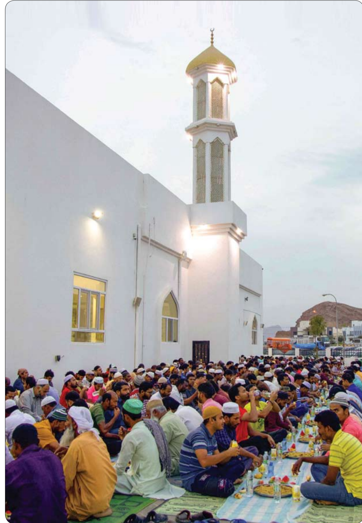
يتجمع المسلمون لتناول الإفطار في باحة أحد المساجد في مسقط، خلال شهر رمضان المبارك.

كما أفادت شركة "سيرفينو سبا"، الشركة المسؤولة عن إدارة التليفريك، أنه حتى أثناء عملية إخلاء الخط، والتي تمت وفق إجراءات السلامة الصارمة، تم تسجيل زيادة أخرى في سرعة الرياح.