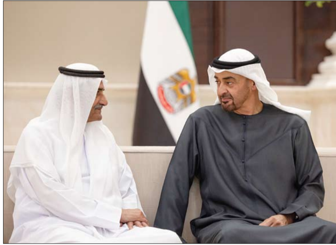
رئيس الدولة خلال استقباله حاكم الفجيرة