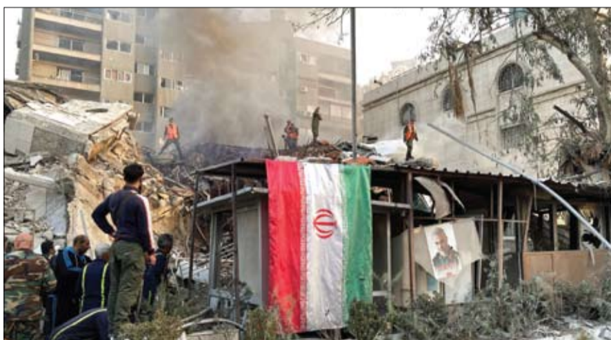
دخان تصاعد بعد غارة إسرائيلية على مبنى قريب من السفارة الإيرانية في دمشق.

الإمارات تدين استهداف البعثة الدبلوماسية الإيرانية في الهجوم الذي نفذته مقاتلات إف35.. ولم تعلق إسرائيل فوراً على الهجوم الذي يأتي على وقع تصاعد التوتر على خلفية حربها في غزة ضد حماس وبين إسرائيل والمنظمات التي تدعمها إيران في المنطقة. وشاهد مراسلو فرانس برس المبنى الملحق بالسفارة الإيرانية مدمراً بينما سارعت فرق الطوارئ لإسعاف الجرحى والبحث عن ضحايا تحت الأنقاض. وأغلقت قوات الأمن الموقع حيث انتشرت جرافات لإزالة الركام والمركبات المتفجعة على الطريق العام. وأفادت وزارة الدفاع السورية أدى العدوان إلى تدمير البناء بكامله واستشهاد وإصابة كل من بداخله ناتياهو يتهدد بحظر قناة الجزيرة في إسرائيل القدس - أ ف ب تهدد رئيس الوزراء الإسرائيلي بنيامين نتانياهو الإثنين التحرك فوراً لمنع بث قناة الجزيرة القطرية في إسرائيل وذلك بعيد تصويت الكنيست على قانون يسمح له بحظر وسائل إعلام أجنبية تضر بالأمن في إسرائيل. ويعد مصادقة البرلمان على النص قال نتانياهو في منشور على منصة إكس إن قناة الجزيرة (الإرهابية) حسب وصفه لن تبت بعد الآن من إسرائيل. أعتزم التحرك بما يتوافق مع القانون الجديد لوقف أنشطة هذه القناة. يمنع هذا القانون الذي أقر بأغلبية 70 صوتاً مقابل 10 لرئيس الوزراء إمكان حظر بث القناة المستهدفة، وصولاً إلى إغلاق مكاتبها في إسرائيل. وسبق أن تعهد نتانياهو اتخاذ إجراء فوري لإغلاق قناة الجزيرة في إسرائيل فور إقرار النص. واتهم نتانياهو قناة الجزيرة بأنها جهاز دعائي لحماس وأنها شاركت بشكل نشط في مجزرة السباع من أكتوبر. وتنفي القناة بشدة صحة ما تنهيه به إسرائيل وتتهم بدورها الدولة العبرية باستهداف منهج موظفيها في قطاع غزة.