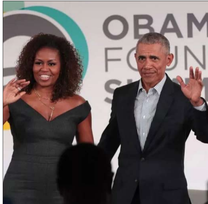
الاستجد بباراك أوباما