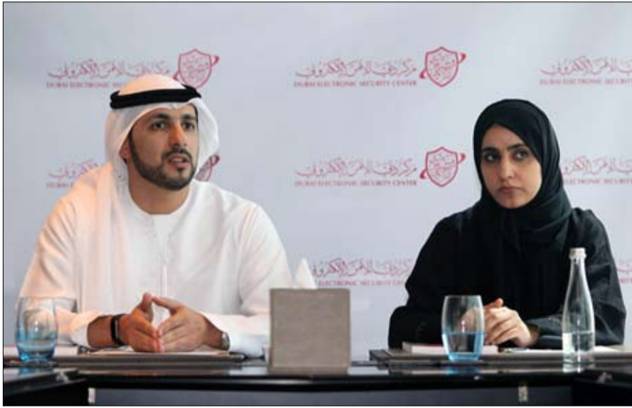
مواصفة أجهزة التحكم الصناعية فضلا عن سماع الاقتراحات من كل الجهات المشاركة.