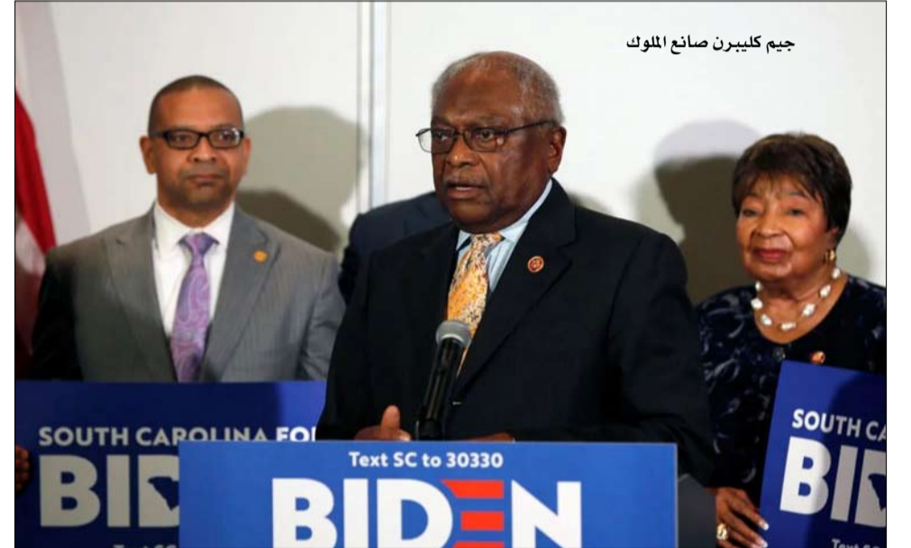
جيم كليبرن صانع الملوك