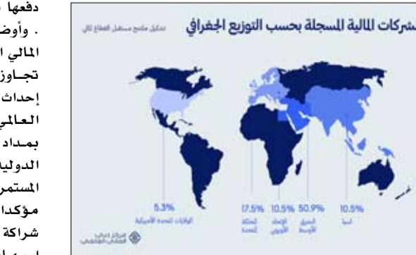
2019 - النمو بحسب طبيعة الشركة