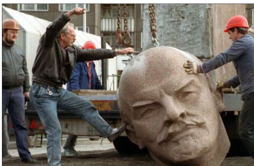
هدم تمثال لينين في برلين عام 1991