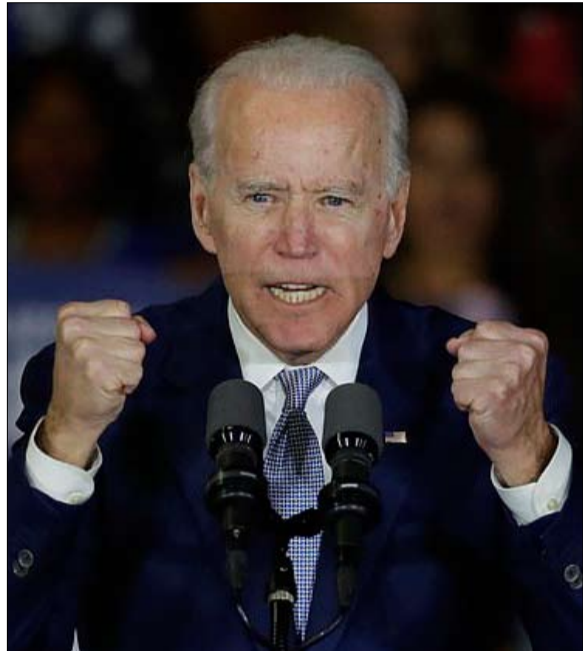
بايدن لم يصنع الفارق نهائياً