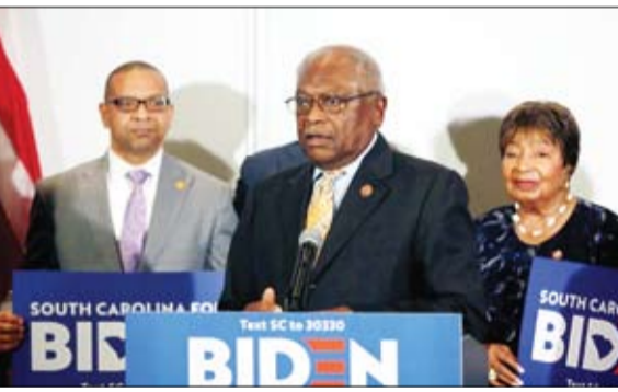
جيم كليبرن صانع الملوك

ستعلن الأمم المتحدة خلال الأيام القادمة خليفة للبعوث الأممي إلى ليبيا غسان سلامة الذي أبلغ عنها العام برغبته في الاستقالة، بعد عامين ونصف من محاولة توحيد الليبيين، فشل خلالها في التوصل إلى اتفاق سلام بين الأطراف المتنازعة على السلطة. ولا يتوقع أن يتأخر الأمم المتحدة في تعيين بديل لسلامة، من أجل استئناف الحوارات الداخلية بين الليبيين في المجالات السياسية والعسكرية والاقتصادية والتي تتولى قيادتها، خصوصا بعد تدهور الأوضاع على الأرض ونهب الهدنة المتفق عليها بين طرفي الصراع. وتصب الترشيحات لصالح 3 أسماء بارزة مرشحة لخلافة غسان سلامة، أبرزهم الأمريكية ستيفاني ويليامز التي تشغل منذ شهر يوليو 2018 منصب نائبة رئيس بعثة الأمم المتحدة في ليبيا.