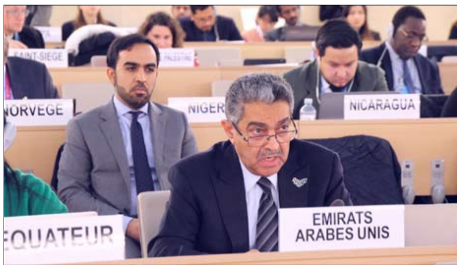
عمل الفريق العامل في مهامه، العمل المتعدد الأطراف وتدعيم سبل التعاون والتشاور في سبيل تحقيق التقدم المرجو على صعيد حقوق الإنسان.

نفذت وزارة تنمية المجتمع وهيئة الإمارات للمواصفات والمقاييس مواصفات وبلدية دبي، أول ورشة تدريبية على المستويين الاتحادي والمحلي، للجهات المعنية بتصاميم البيئة المؤهلة، والذي اعتمده مجلس الوزراء العام الماضي 2019، في إطار تزويد المباني والطرق وأنظمة النقل بأنواعها، بالمواصفات الفنية المناسبة والمرحبة لأصحاب المهام، بصورة تحقق لهم التمكين والسعادة. شارك في الورشة ممثلون عن وزارة تطوير البنية التحتية، ووزارة التربية والتعليم، وبرنامج الشيخ زايد للإسكان، وادارة البلديات والنقل بأبوظبي، فضلاً عن المجلس الاستشاري لإمارة الشارقة، وبلديات دبي ورأس الخيمة والضجيرة وعجمان وأم القيوين ودبا الفجيرة، في مسمى لضمان نشر الوعي بالكود على أوسع نطاق. وقد تضمنت الورشة تدريباً وأهياً شمل الجانبين النظري والعملية في ما يخص تطبيق الكود الجديد، فيما سيتم استكمال التدريب على جزئية النقل خلال الفترة المقبلة. ويشكل كود الإمارات للبيئة المؤهلة نقلة نوعية في تهيئة المنشآت ووسائل النقل والبنية التحتية