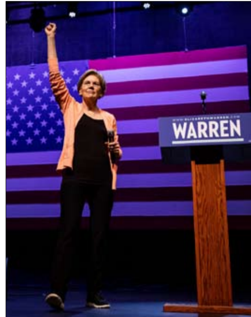
انسحاب وارن لن يخدمه بالضرورة

الثالثة بين الناخبين في هذا المجتمع، خلف بايدن ومايك بلومبرغ. عام 2016، فاز سناتور فيرمونت بولاية ميشيغان، لكن هذه المرة يتخلف بفارق سبع نقاط عن جو بايدن في استطلاع حديث.