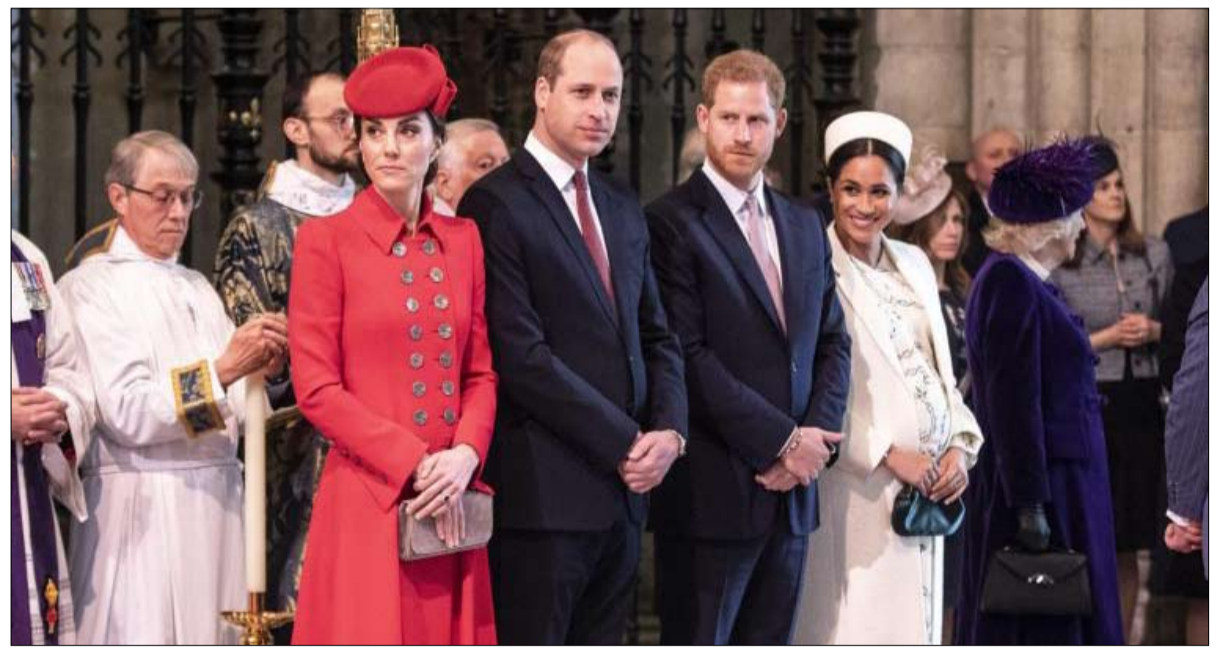
سيبتسمون للأعلام فقط