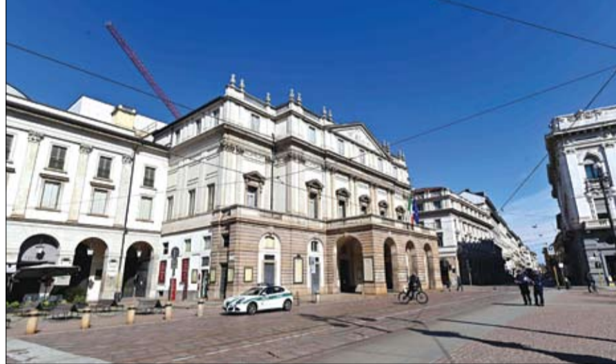
نابولي مدينة أشباح بعد عزل ثلث سكان إيطاليا في الحجر الصحي

الإجراءات الاستثنائية حتى 3 أبريل المقبل. وأعلن كوتني عبر حسابه الرسمي بموقع تويتر توقيع هذا المرسوم الذي سيفرض قيودا صارمة على الدخول والخروج إلى منطقة واسعة في شمال إيطاليا. إلى ذلك، أعلنت وزارة الصحة الإيرانية، أمس الأحد، أن العدد الإجمالي لحالات الإصابة بفيروس كورونا المستجد في البلاد ارتفع إلى 6566 حالة، بعد تخصيص 743 إصابة جديدة. كما أكدت الوزارة أن عدد الوفيات بسبب الفيروس قفز إلى 194 بعد تسجيل 49 حالة وفاة جديدة بسبب الوباء، وهو أكبر عدد وفيات خلال 24 ساعة في إيران منذ الإعلان الرسمي عن الإصابات الأولى بالمرض في 19 شباط