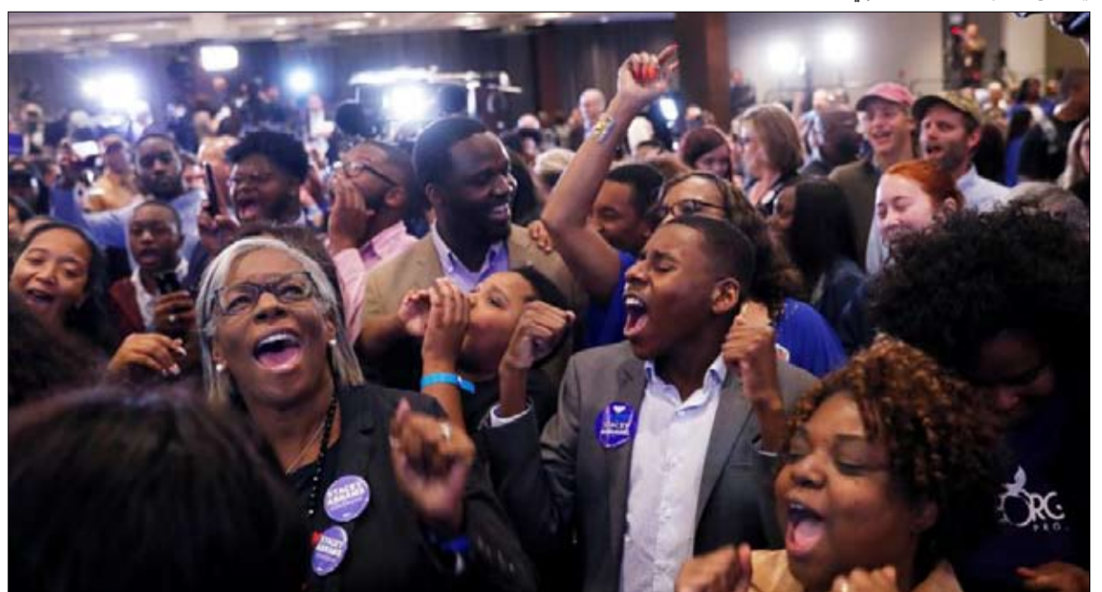
اصوات السود تظل هدف جميع المترشحين