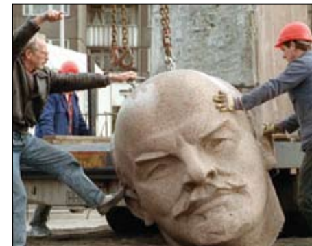
هدم تمثال لينين في برلين عام 1991

أبلغ مسؤولون أميركيون، أمس الأحد، رئيس الوزراء السوداني عبد الله حمدوك، بأن رفع اسم بلاده من قائمة الدول الراضية للإرهاب مسألة وقت لا أكثر، بحسب ما أفاد بيان صادر عن حمدوك. جاء ذلك خلال لقاء جمع حمدوك مع وفد من وزارة الخزانة الأمريكية لقيادة تمويل الإرهاب يزور الخرطوم حاليا، برئاسة مساعد الوزير مارشال بيلنغسلي. وأعرب الوفد الأميركي عن سعادته بزيارة للسودان، مؤكدا رفع القيود المالية والاقتصادية عن السودان.