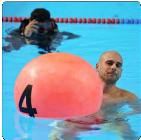
تفوق بولندي وعماني وكويتي