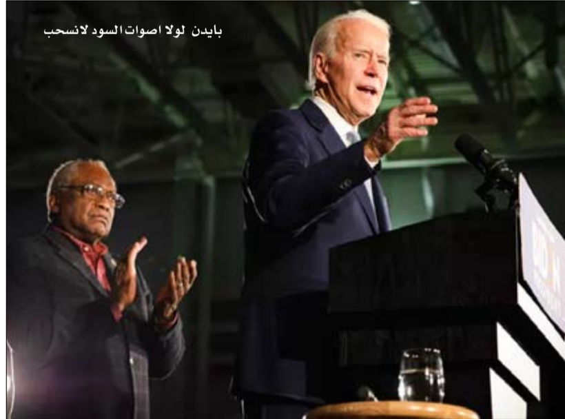
بايدن لولا أصوات السود لانسحب

سبق أن أطاح كليبرن عام 2008 بهيلاري كلينتون أمام أوباما بفارق 29 نقطة في التمهيدية