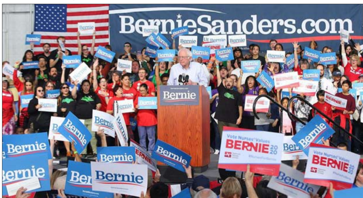
بيرني يبحث عن نفس جديد