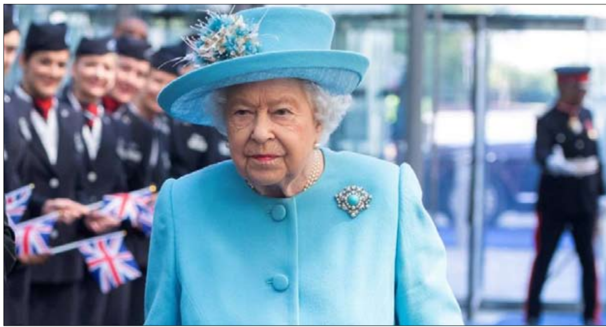
الملكة حسمت الموقف