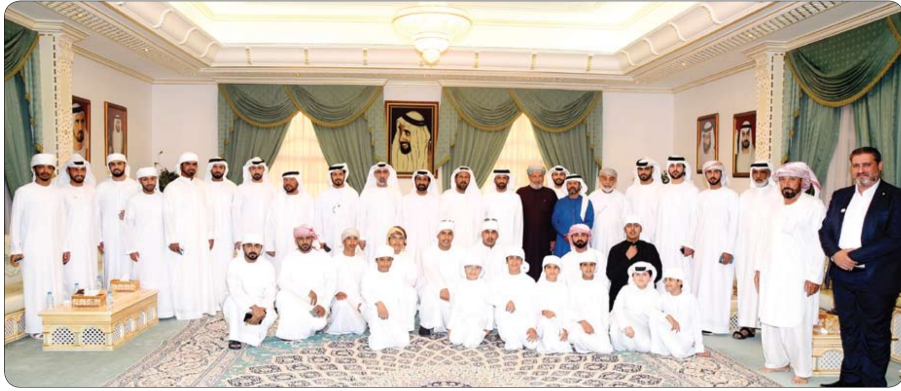
مجلس بن حم يشيد بمبادرة محمد بن زايد بإجلاء رعايا الدول من الصين