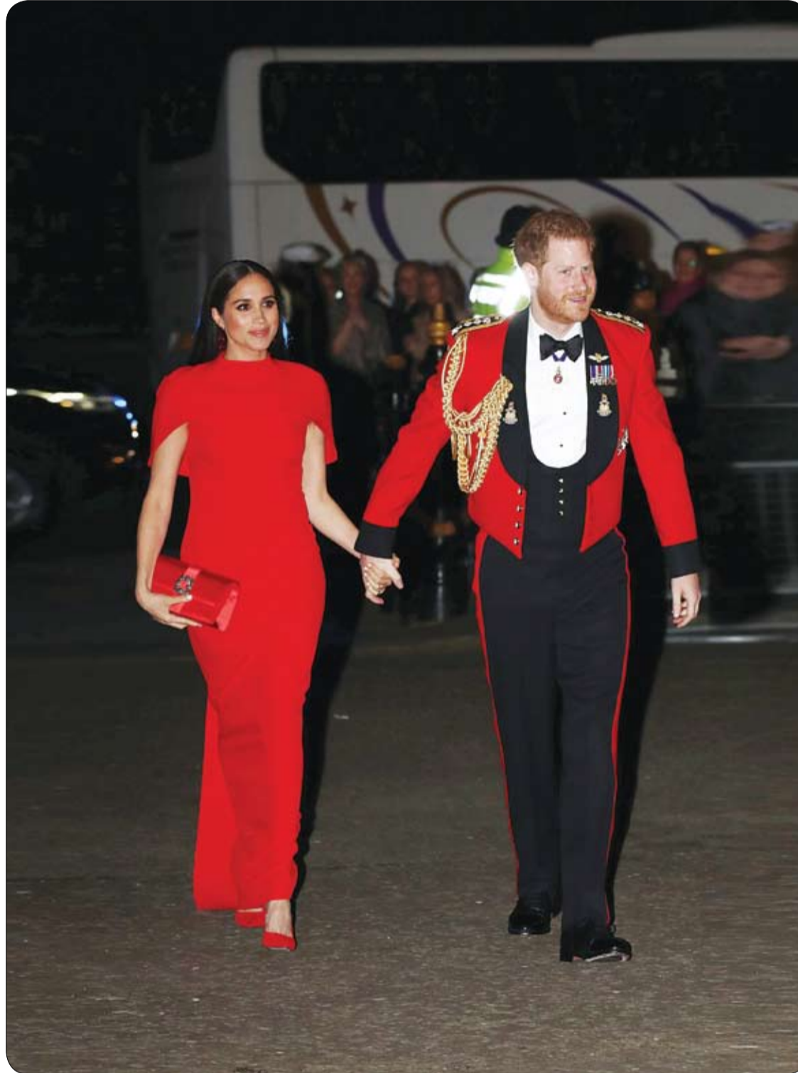
الأمير هاري وزوجته ميغان، لدى وصولهما لحضور مهرجان مونتباتن للموسيقى في قاعة ألبرت الملكية في لندن.

على الرغم من أنّ العدس يحتوي على نسبة عالية من الكربوهيدرات، إلا أنّ 10% من السعرات الحرارية المكتسبة من العدس، تأتي من السكريات البسيطة فيه.