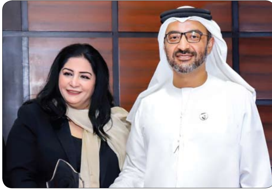
احتفاءً باليوم العالمي للمرأة