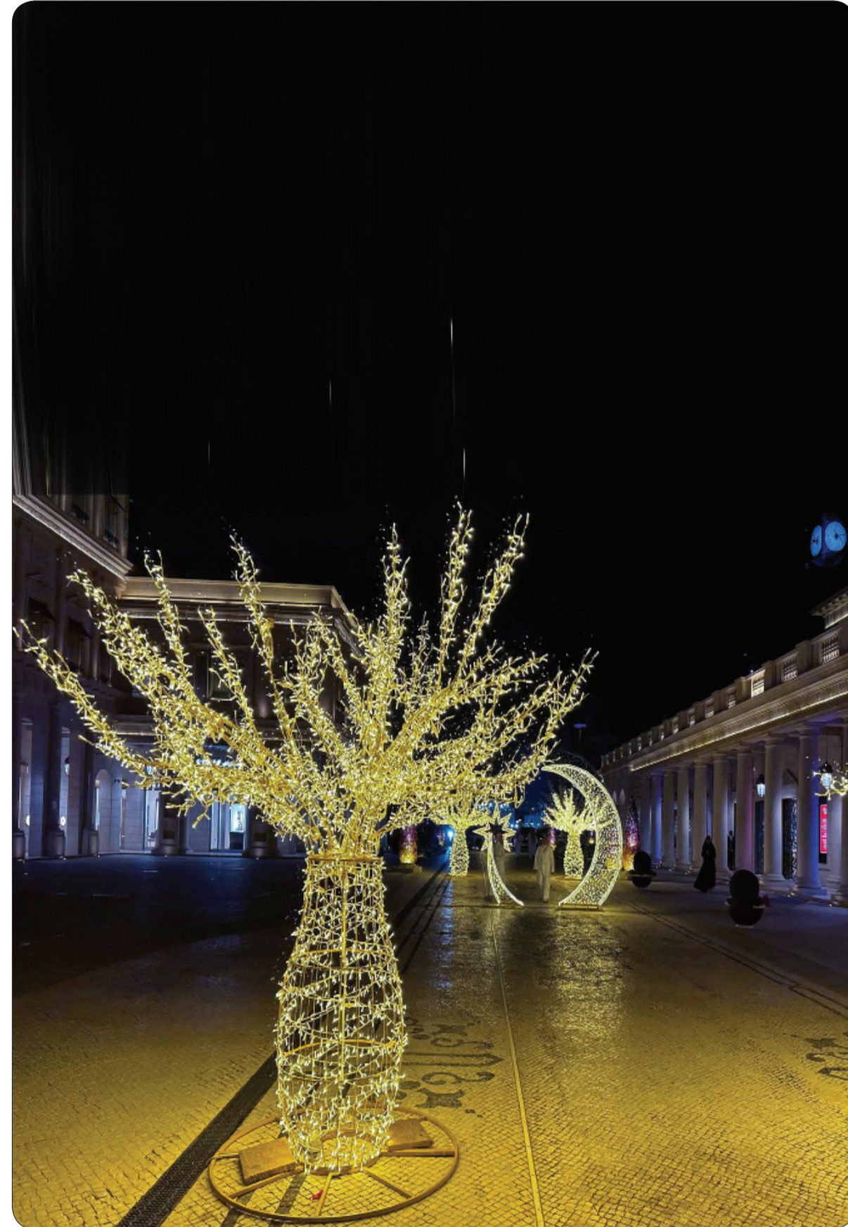
زينة في قرية كتارا الثقافية في الدوحة، خلال شهر رمضان المبارك.

قالت تقارير صحفية إن الأمير هاري علم بإصابة الأميرة كيت ميدلتون بالسرطان من خلال شاشة التلفزيون مثله مثل بقية الناس. وذكرت صحيفة "ذا تايمز" البريطانية، عقب يوم واحد من كشف أميرة ويلز، أنها تخضع لعلاج كيميائي وقائي، "من المفهوم أن تشخيص إصابة كيت بالسرطان لم تتم مشاركته مسبقا مع هاري وزوجته ميغان ماركل". وأضافت: "تؤكد عدة مصادر عدم وجود محادثات مسبقة بين الطرفين حول الإصابة، وأن الأمير هاري علم بذلك مثله مثل الجمهور من خلال شاشة التلفزيون". وقال الأمير هاري وزوجته ميغان يوم الجمعة الماضي إنهما يتمنيان الصحة والخصوصية لكيت زوجة الأمير ويليام، شقيق هاري الأكبر، بعد أن أعلنت أميرة ويلز أنها تتلقى علاجا عقب اكتشاف إصابتها بالسرطان.