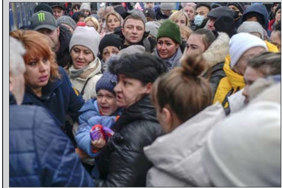
تكلفة عالية لتنظيم الانتخابات للايين اللاجئين الأوكرانيين

على الرغم من الحرب؟ وفي الأشهر الأخيرة، برز الموضوع في المناقشات السياسية تحت ضغوط دولية، لكنه يحرج الجميع لأنه لا يوجد حل جيد. ولو لم تكن روسيا قد شنت هجومها واسع النطاق في فبراير 2022، لكانت البلاد تستعد للتصويت في أكتوبر للانتخابات التشريعية، وفي مارس 2024 للانتخابات الرئاسية.