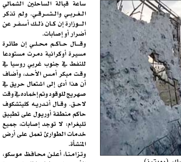
جندي أوكراني خلال اشتباكات في أندريفكا، بمنطقة دونيتسك.