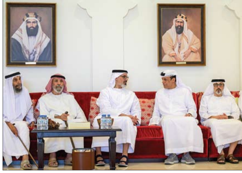
ولي عهد أبوظبي خلال تقديمه واجب العزاء لعلي وعبيد وحمد سالم بالحبالة الكتبي في وفاة والدتهم (وام)

بعد مرور أسبوع على فاجعة زلزال الحوز بالجنوب المغربي، ما زالت راحة الموت تنبعث من الساكن المدمرة حيث بقيت بعض الجثث عالقة تحت الأنقاض، ما خلف ذعرا في أوساط السكان وازدحمت القرى المتضررة من أهل الخير وعائلات الضحايا. ويصعب وصف شعور أهالي الضحايا بعد أن تعفنت جثث ذويهم وباتت تنبعث منها روائح كريهة، فيما تسابق فرق الإنقاذ الزمن لاقتسام ما تبقى عالقا قبل أن تبلغ الجثث درجات متقدمة من التحلل. وأعرب سكان عن تخوفهم من أن تتسبب الروائح المنبعثة من الجثث العالقة تحت الأنقاض في مشاكل صحية خطيرة من خلال نقل الأمراض والعدوى، وأشاروا إلى أن تلك الجثث بدأت تتحلل وتصبح مصدرا للميكروبات الضارة بعد أسبوع تقريبا من وقوع الزلزال الذي سجل سبع درجات على مقياس ريختر وخلف حوالي 3000 قتيل وآلاف المصابين. غير أن الدكتور عبد الجليل حمزاوي، المتخصص في البيولوجيا الإحيائية، أوضح أنه لا يوجد علميا أي خطر أو ضرر صحي يمكن أن تسببه الروائح المنبعثة من جثث المتوفين جراء كارثة طبيعية، بخلاف المتوفين بسبب أمراض شديدة العدوى مثل الإصابة بفيروس كورونا أو بالطاعون أو التيفوئيد. وأكد حمزاوي في حوار مع وكالة أنباء العالم العربي (AWP) أن الروائح المنبعثة من الجثث لا تشكل خطرا على الناس لأنها ليست سامة، إذ إنها نتاج مواد طبيعية داخل جسم الإنسان. لكنه لفت إلى وجود خطر بيئي إذا تحللت الجثث تحت الأنقاض وتسربت الميكروبات الموجودة في الجهاز الهضمي للمتوفى إلى المياه الجوفية وشرب الناس من منبع مياه تحللت بها الجثث.