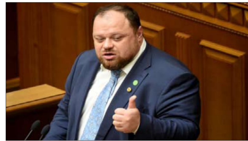
رئيس البرلمان الأوكراني: الدستور لا يحظر إجراء الانتخابات في أوقات الحرب

تكون شعبية الرئيس جيدة وهي القيمة التي يلوح بها الأوكرانيون بانتظام في قتالهم ضد روسيا. دون المجازفة بانهايتها إذا طال أمد الحرب. ويدعي الجزء الآخر من الفريق، على العكس من ذلك، أن تنظيم الانتخابات خلال الحرب ليس ضرورياً، لأنه "لن يؤدي إلا إلى الانقسامات والمشاكل الداخلية والأمنية"، يتابع السيد فيسينكو.