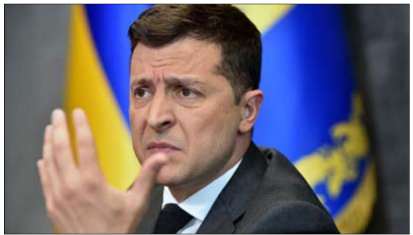
زيلينسكي يواجه معضلة الانتخابات في زمن الحرب

أوكرانيا إذا لم تكن الانتخابات مثالية. ولكن، إذا لم تنظمو الانتخابات، فيسكون لدى الجميع أسئلة ليطرحوها عليكم، مضيافاً أن الديمقراطية مستحيلة بدون انتخابات". في أوكرانيا، قوبلت هذه الدعوة بمزيج من عدم التصديق والغضب. يتذكر السياسي فولوديمير فيسينكو، رئيس مركز بنتا للدراسات السياسية قائلاً: "قد أثار هذا الكثير من الانتقادات بيننا. أي انتخابات؟ نحن نعرض للقفص كل يوم". و رغم كل شيء، وصلت الرسالة إلى طريقها. وفي يونيو، كسر رئيس البرلمان رسلان ستيفانوشوك الإجماع الذي كان سائداً حتى الآن، عندما أكد، خلافاً لكل التوقعات، أن الدستور لا يحظر بشكل مباشر إجراء الانتخابات في أوقات الحرب. وأوضح أنه لا يوجد مثل هذا الحظر في الدستور. وأضاف أنه من ناحية أخرى، فإن هذا الحظر موجود