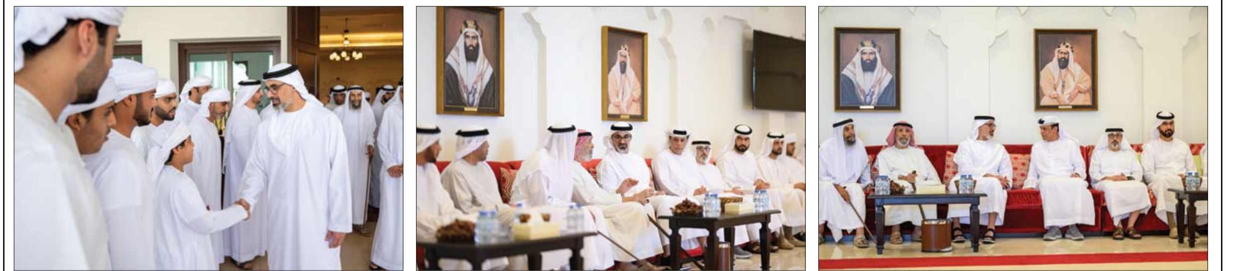
خالد بن محمد بن زايد خلال تقديمه واجب العزاء إلى علي وعبيد وحمد سالم بالجمالة الكتبي في وفاة والدتهم (وام)