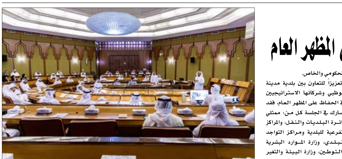
مناقشة الجلسة كيفية تطبيق الأفكار المطروحة في ورشة العمل، ومناقشة مجالات التحسين وتبادل الخبرات مع الجهات المعنية في منظومة التفيتش وسبل تحفيز الشركاء الاستراتيجيين لتفعيل دورهم في الحفاظ على المظهر العام.

جمهورية الصين. وقال إن علاقات الصداقة بين البلدين والشعبين الصديقين تاريخية وتعتز لأن الصداقة الحقيقية والحقيقية لا تعرف المسافة وتتنامى في ظل التواصل بين قيادات ومسؤولي البلدين، وأقامت شنغهاي ودبي شراكة، مشيدا بمعرض إكسبو دبي ومعرض شنغهاي وهما نقطة تحول كبرى في هذه العلاقات، لافتاً إلى أن مدينة شنغهاي شهدت تطورا وهي تعد أكبر المدن الصينية. وأكد معالي تشنغ جانجياو أهمية زيارة المجلس الوطني الاتحادي إلى جمهورية الصين، حيث تساهم الزيارات المتبادلة في تعزيز التعاون البرلماني وتبادل الزيارات والخبرات بما يصب في صالح البلدين والشعبين الصديقين، في ظل ما يشهده العالم من تطورات وتحديات كبيرة، وما يتطلبه ذلك من توحيد للمواقف والتوجهات حيال مختلف القضايا ذات الاهتمام المشترك.