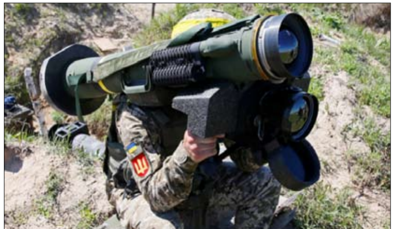
هل يمكن استقطاع اموال السلاح لتغطية نفقات الانتخابات؟

لقد عادت معضلة تنظيم الانتخابات في زمن الحرب للنقاش السياسي نهاية أغسطس الماضي عندما دعا السيناتور الجمهوري الأمريكي ليندسي غراهام السلطات الأوكرانية، خلال زيارة أداها إلى كييف إلى إجراء انتخابات "حرة وزيهة" بالرغم من الهجمات التي تشنها روسيا على البلاد. ورد فولوديمير زيلينسكي بأن التصويت يمكن أن يتم بشرط أن تنقسم الولايات المتحدة والاتحاد الأوروبي تكاليف تنظيمه، وأن يوافق المشرعون على تغيير القانون، وأن يتمكن جميع السكان من المشاركة وذلك من أجل إجراء انتخابات "شرعية". وقد تطور خطاب السلطات، الذي كان متردداً حتى الآن، فعلى مدى عام ونصف، ظل ممتلئاً