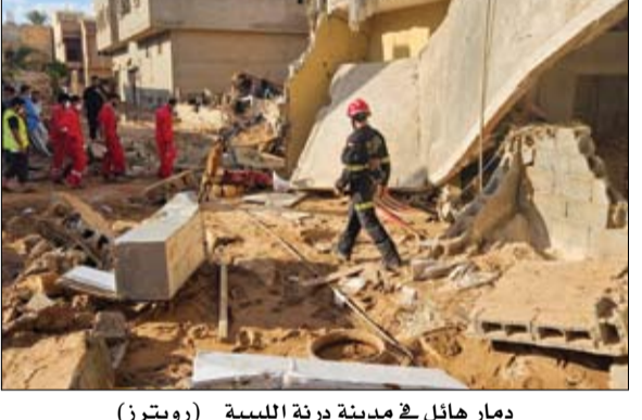
دمار هائل في مدينة درنة الليبية

الحكومة الليبية المكلفة عثمان عبيدالجليل أشار إلى أن عدد قتلى كارثة الفيضانات ارتفع إلى نحو 900 مبنى انهارت من 80 جثة جديدة، مؤكدا أن هذه الأرقام المسجلة تقلل أقل من التوقعات نظرا لحجم الكارثة. وفي السياق، قالت منصة حكومتنا الليبية نقلا عن فريق لحكومة الوحدة الوطنية إن نحو 900 مبنى انهارت تماما جراء السيول التي ضربت درنة وتم دفن 400 منزل تحت الوحل.