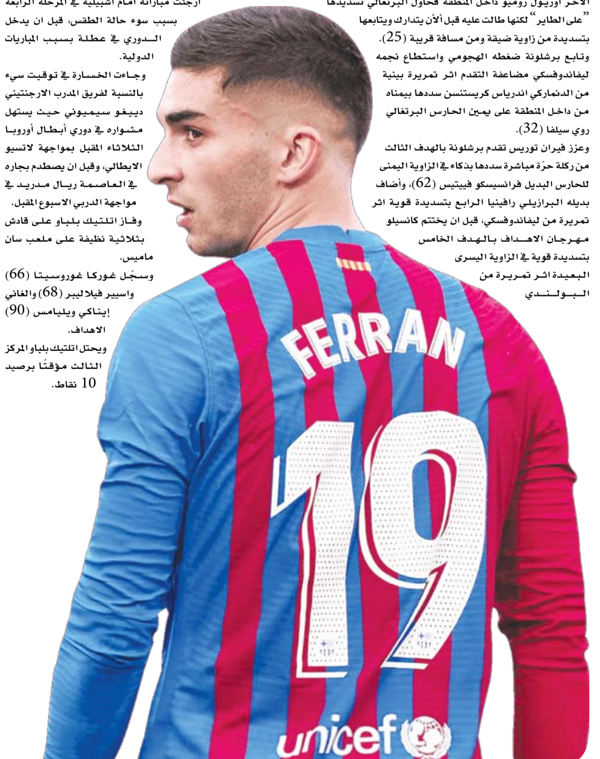
ويحتل أتلتيكو بلباو المركز الثالث مؤقتاً برصيد 10 نقاط.