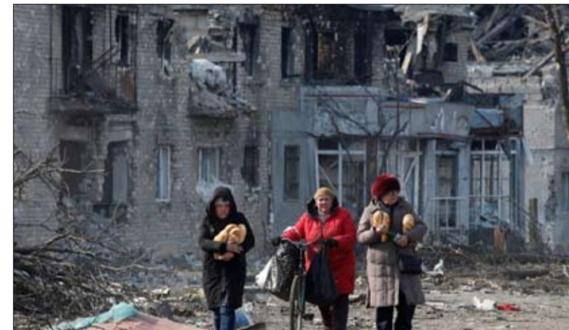
كيف يتمكن جميع السكان من المشاركة في الاقتراع؟