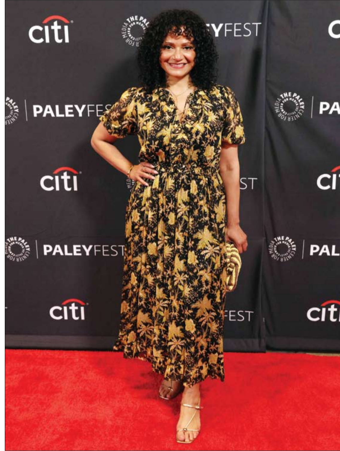
الممثلة الأمريكية جودي ريبس لدى حضورها عرض مسلسل Scrubs في مهرجان PaleyFest LA في هوليوود. ا ف ب

وقال البروفيسور توم بيتش، الباحث في مجال النشاط البدني بجامعة ليوستريت: إن تحليل البيانات أظهر بوضوح أن سرعة المشي تعد أقوى مؤشر منفرد للتنبؤ بالوفاة، خاصة لدى الأشخاص الذين يعانون من حالات صحية مسبقة.