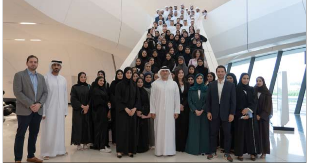
في إطار الاحتفاء بـ «عام الاستدامة»، وتمهيدا لاستضافة «مؤتمر الأطراف - قمة المناخ» COP28