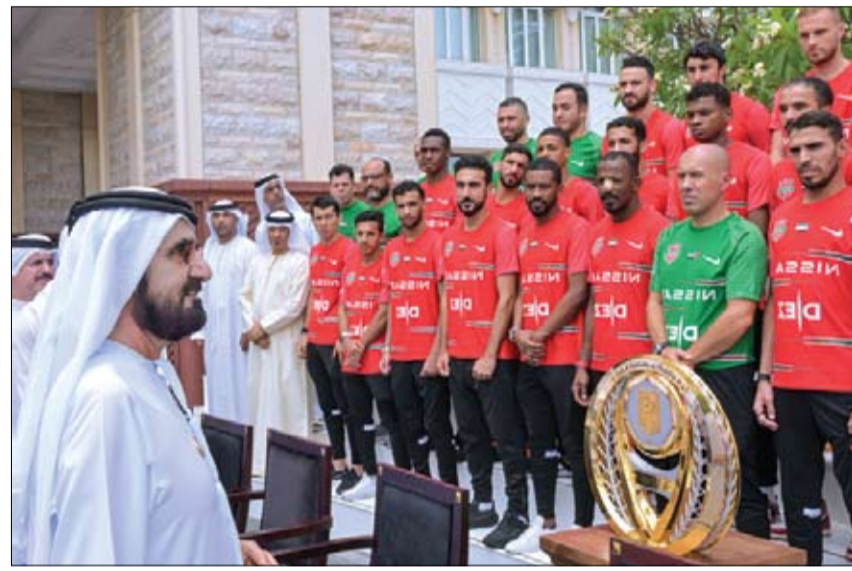
محمد بن راشد خلال استقباله فريق شباب الأهلي

•• دبي-وام أكد صاحب السمو الشيخ محمد بن راشد آل مكتوم، نائب رئيس الدولة رئيس مجلس الوزراء حاكم دبي رعاه الله أن دولة الإمارات وضعت قطاع الرياضة ضمن القطاعات الحيوية التي توليها كل الاهتمام والتشجيع وتحيطها بكل أوجه الدعم والرعاية، بما يعزز قدرة مختلف الفرق الرياضية على تحقيق الانتصارات في البطولات المحلية وافتتاح منصات التتويج في المحافل الدولية. (التفاصيل ص19)