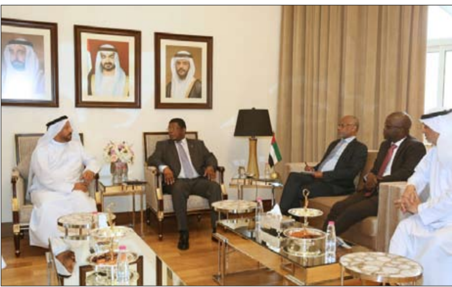
خلال لقاءين مع بعثاتهم الدبلوماسية لدى الدولة