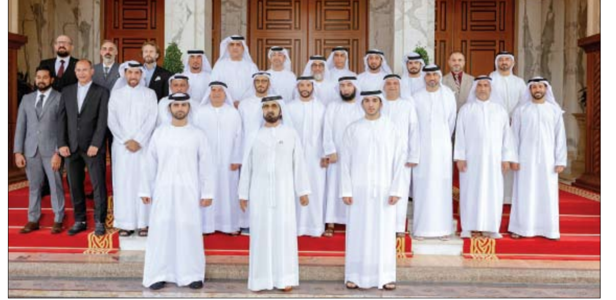
استقبل فريق شباب الأهلي بمناسبة الفوز بلقب دوري المحترفين للمرة الثامنة