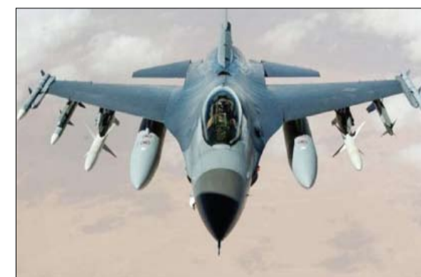
مقاتلة إف 16 المرشحة لدعم الجبهة الأوكرانية