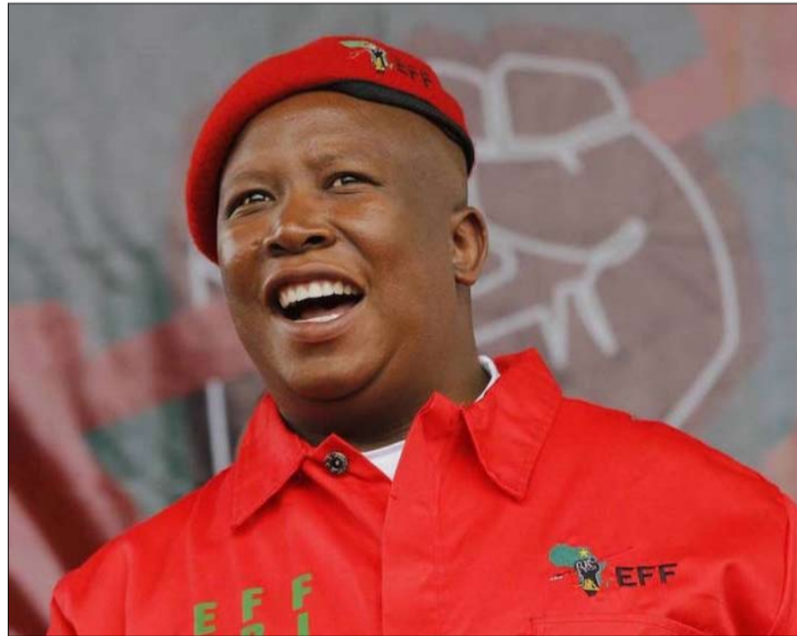
جوليوس مالينما هاجم يوم التراث

يوم التراث أمام ادواء جنوب إفريقيا سياسياً ورمزياً، دمر الاحتفال حقاً. فقد قرر حزب جوليوس مالينما الشعبي -مقاتلو الحرية الاقتصادية، المعروف بلقبه التي تستهدف الأقلية البيضاء على وجه التحديد، قرر مهاجمة يوم التراث في