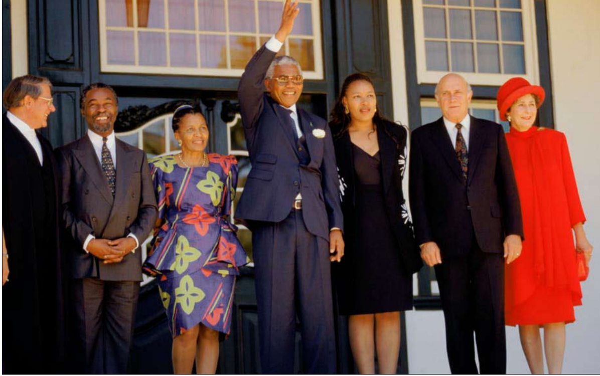
تراث سياسي تاريخي لا بد من حفظه