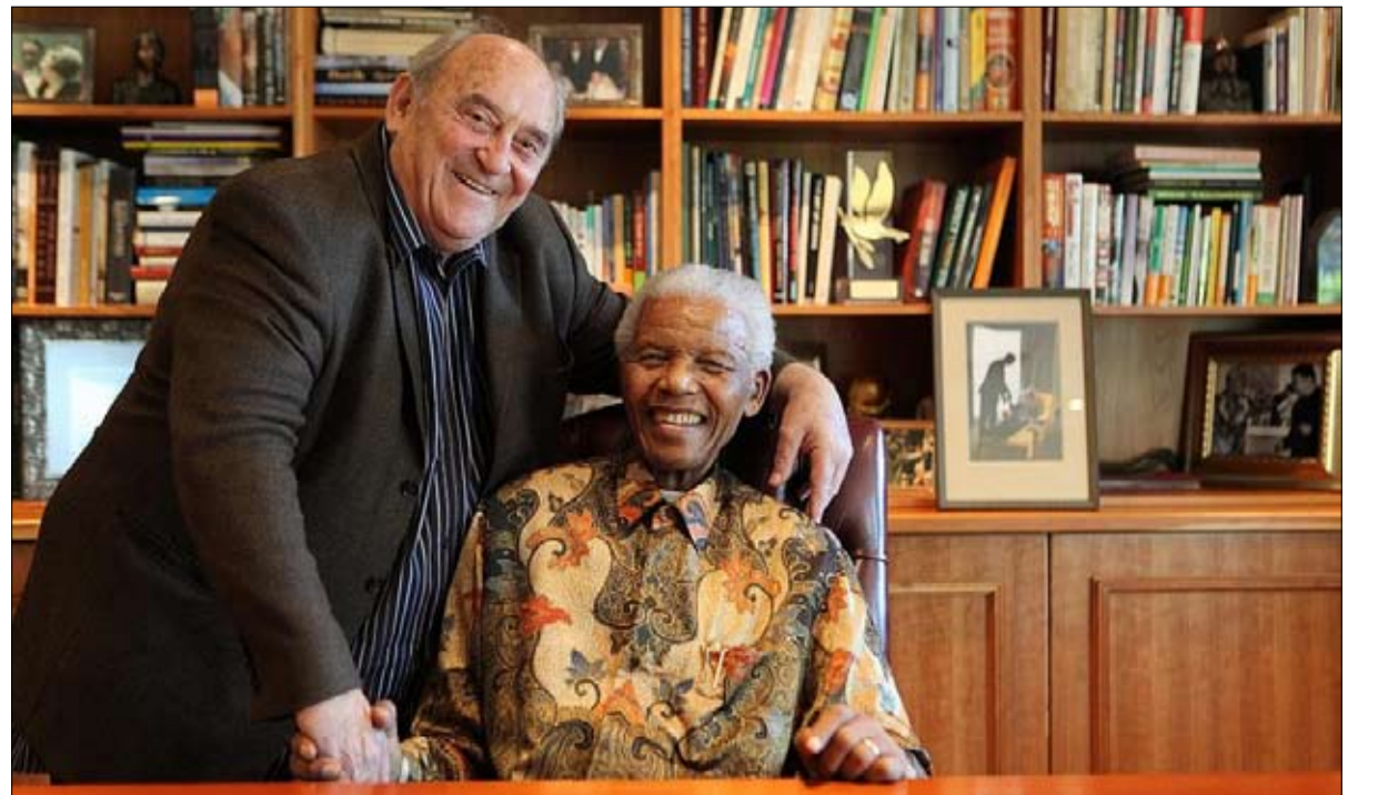
دينيس غولبرغ من رموز البلاد