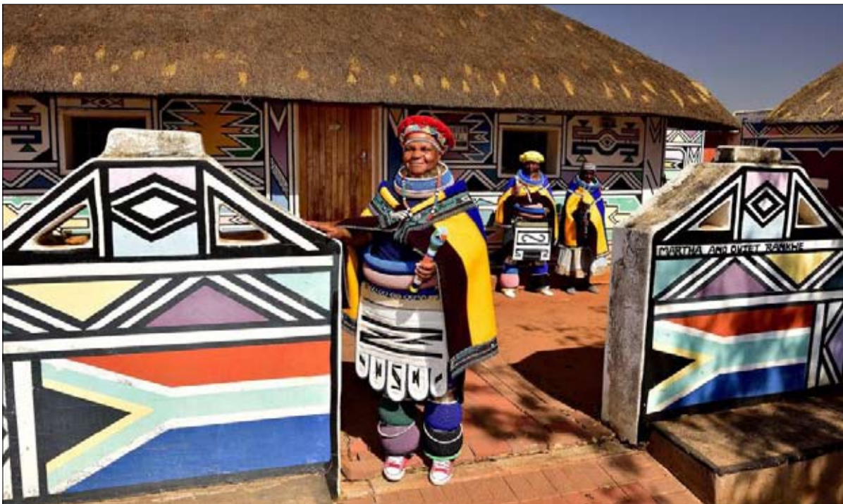
يوم التراث احتفالية للجميع

لم يعد الأمر يتعلق بالثروة الثقافية واللغوية فحسب، بل بالتراث التاريخي الذي تأسست عليه جنوب إفريقيا الجديدة