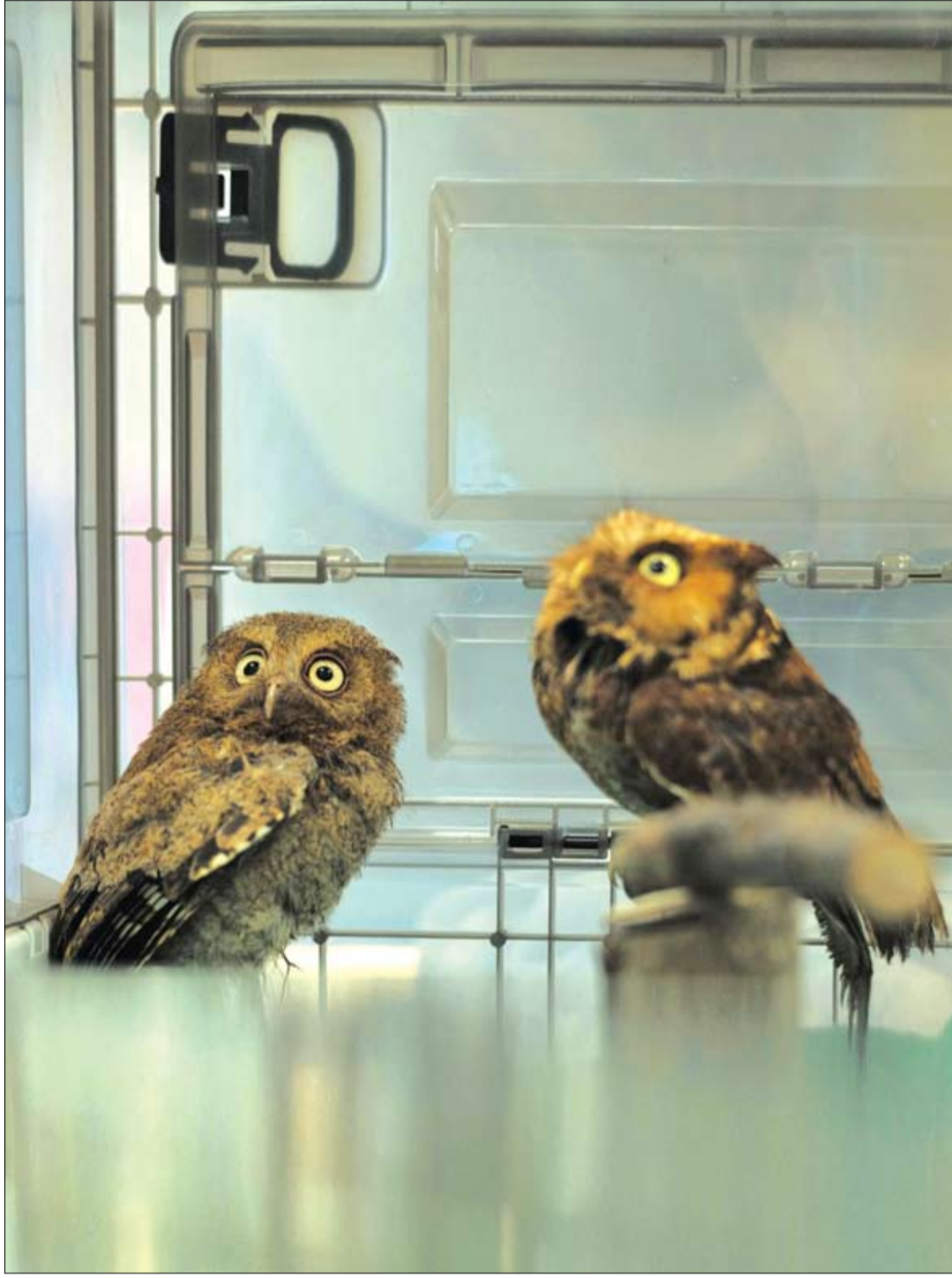
اثنان من البومة الجبلية النادرة المحمية في قفص قبل تلقي فحص طبي، في حديقة ترفيهية ورحلات سفاري في مقاطعة هسنيشو بتايوان.