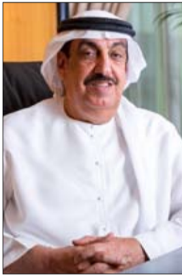
انعقاد «إيسيو 2020 دبي» وستكون أول محطة في المنطقة مؤهلة لتحمل التصنيف الذهبي

والكفاءة أعلنت فيه عن توفير 71.4 مليون درهم إماراتي بفضل اتخاذ تدابير وإجراءات مبتكرة وشاملة لتعزيز كفاءة استهلاك الطاقة خلال السنوات الخمس الماضية مما أثمر عن خفض استهلاك الطاقة في عملياتها بنسبة 23%. وفي وقت سابق من العام الجاري كشفت مجموعة اينوك عن نتائج مشروع محطة خدمة من نوعها بتصميم مستوحى من شجرة الخفاف وهي عبارة عن محطة عصرية ومستدامة تتميز بتصميم معماري فريد حيث ستقع في موقع