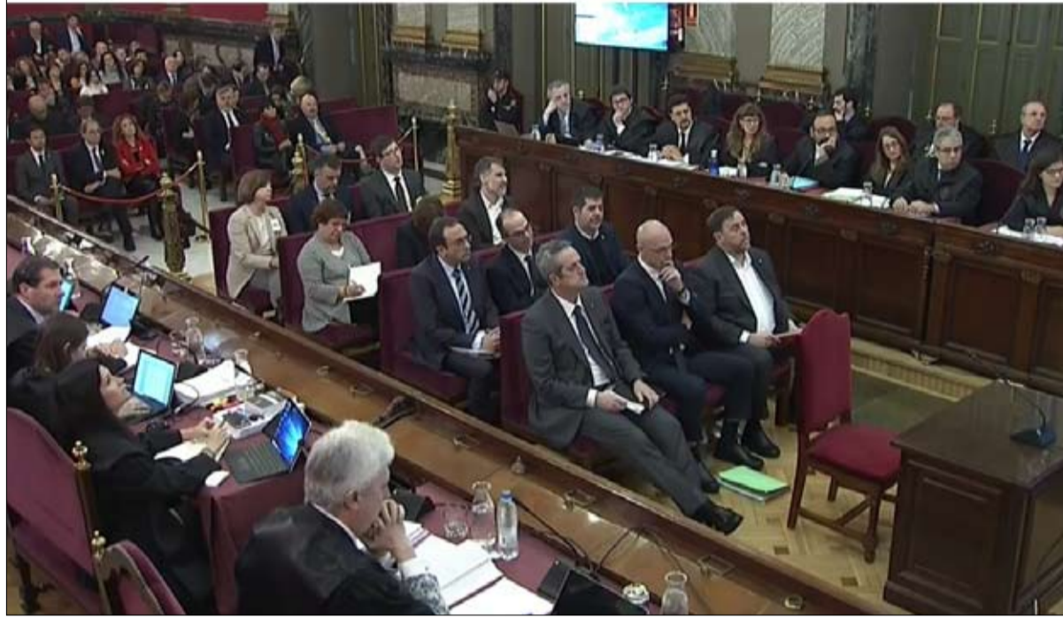
محاكمة القادة الكاتالونيين