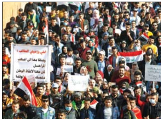
نظاهرة ضخمة لطلاب الجامعات في بغداد

رام الله-وكالات: قوبلت الأنباء التي تتحدث عن التهدئة بين حركة حماس وإسرائيل في قطاع غزة بتأييد واسع رسمي وفصائلي، معتبرين ذلك محاولة تكريس لكيان جديد في غزة. ووصف الناطق باسم الحكومة الفلسطينية، إبراهيم ملحم، التهدئة طويلة الأمد بين حماس وإسرائيل في غزة، بأنها إجراءات تأتي بالتزامن ما بين عمليات البطش الإسرائيلي ومصادرة الأراضي وقرصنة الأموال وتفرد إسرائيل بالضفة من جهة ومحاولة تكريس كيانية جديدة في غزة من جهة أخرى لتحقيق مصالح سياسية. من جهته، اعتبر عضو اللجان التنفيذية لمنظمة التحرير المركزية حركة فتح عزام الأحمد، أن التعاون بين إسرائيل وحماس على تهدئة طويلة الأمد، وكل الدول المتواطئة معها، ترسيخاً للاقتسام في الساحة الفلسطينية، وفصل غزة جغرافياً وقانونياً عن فلسطين، لمنع إقامة دولة فلسطينية على حدود عام 1967. وقال الأمين العام لجبهة التحرير الفلسطينية، إن الحديث عن التهدئة في غزة، هو خطة خبيثة مبيتة من أجل ضرب المشروع الوطني الفلسطيني