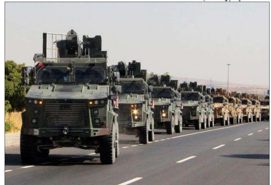
التدخل التركي في سوريا

بخصوص إيران، لن يتمكن الأوروبيون من الاستمرار في تأكيد أيهم عن السياسة الأمريكية