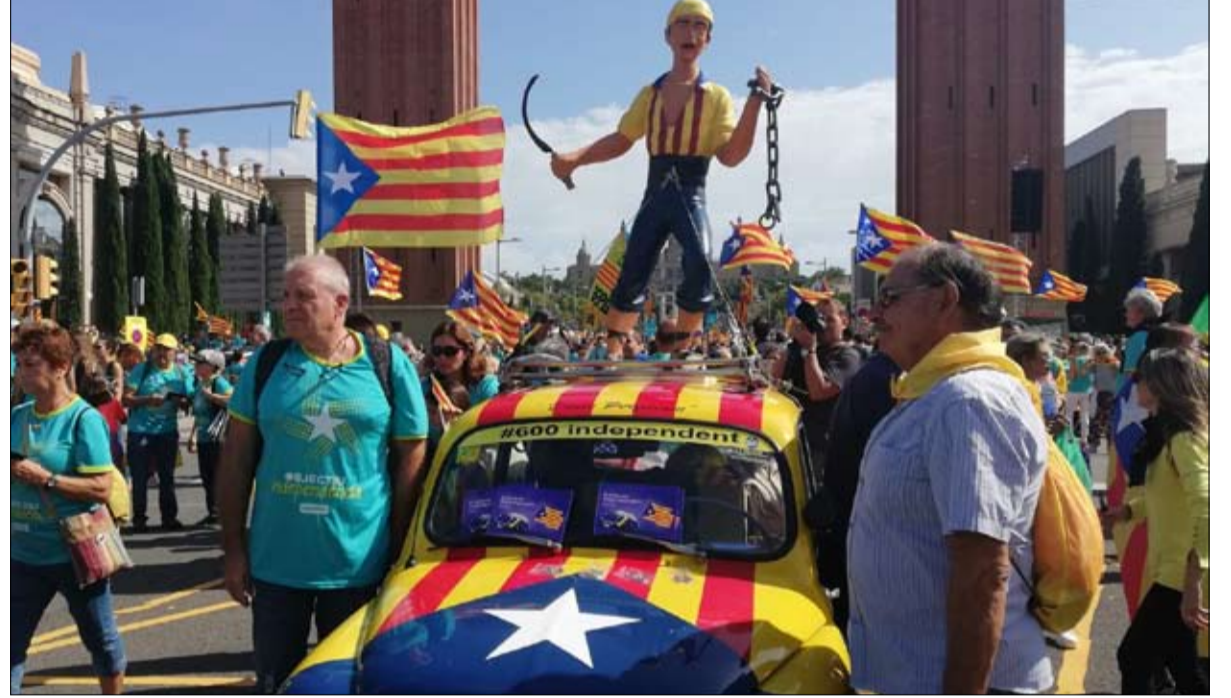
إصرار على الاستقلال