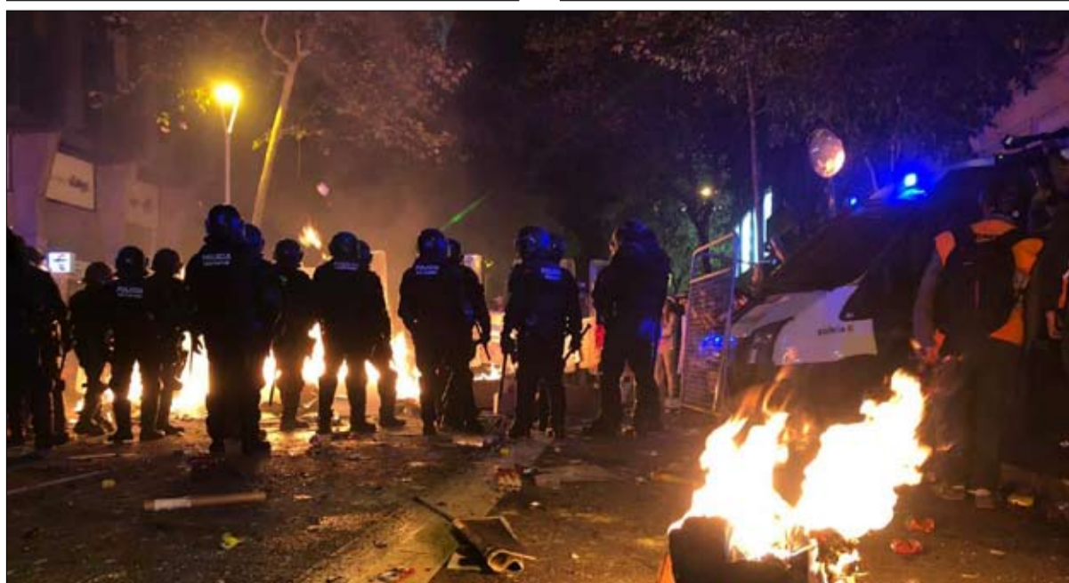
هل اخترق العنف الحركة السلمية؟

من خلال تنظيم استفتاء الاستقلال في 1 أكتوبر 2017، أظهرنا أن الدولة ليست لا تقهر