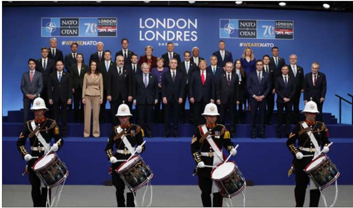
الاطلسي والهيمنة الأمريكية