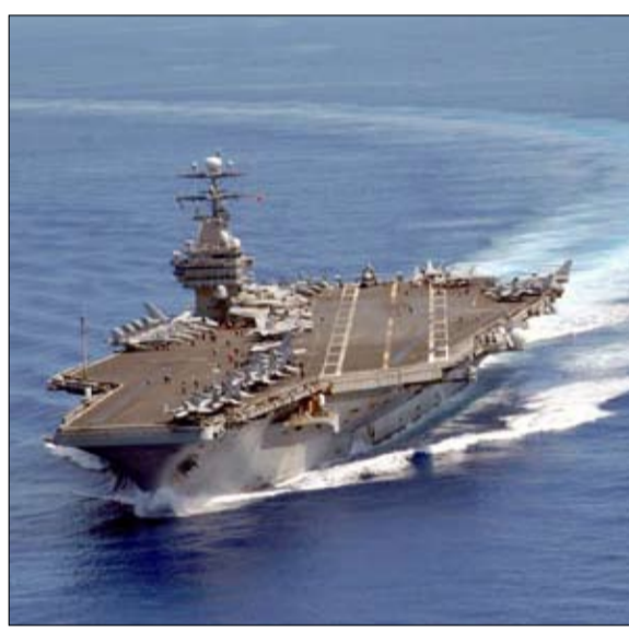
تقرير مولر.. رب ضارة نافعة للديمقراطيين

في ذلك الوقت، استخدم ييفغيني بريماكوف، وزير خارجية بوريس يلتسين، مفهوم التعددية القطبية لجعله المحور المركزي للجدل ضد نظام الأحادية القطبية المزعوم الذي فرضته الولايات المتحدة (على الأكثر لحظة القطب الاحادي). وعلى هذا الأساس، تم رسم شراكة جغرافية سياسية صينية روسية في منتصف التسعينات، وهي نقطة الانطلاق لجهة القوى التحريفية التي تتشكل اليوم. من المهم أن ندرك أن ”التعددية القطبية“، في بيكين كما هو الحال في موسكو، ليست مفهوماً يهدف إلى التفكير في العالم، ولكنها أداة قتال في صراع ازلي ضد الهيمنة الغربية الطويلة. وتقوم نظرية القيادة الروسية للعالم على منطق ثنائي للعلاقات الدولية، و فكرة أنه لا يوجد سوى ”ألعاب محصلتها صفر“ (”كتو-كتو اللينيني“ : من يفوز على من؟). وتشابه هذه الرؤية مع الماركسية