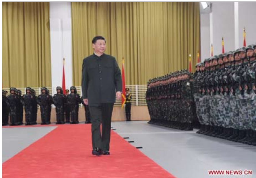
الصين.. استراتيجية كبرى

بالنسبة لإيران، فثلت الوساطة الفرنسية التي تم تنظيمها خلال مجموعة السبع في بياريتز (24-26 أغسطس 2019)، هل يمكننا تصديق ذلك؟ رغم ما يكتنف ذلك من خطر إثارة حرب، زادت طهران من التوتر حول مضيق هرمز، وقصفت الأراضي السعودية، وأعدت إطلاق برنامجها النووي، لن يتمكن الأوروبيون من التخندق لفترة طويلة في ”عالم آخر“ وهمي، وتأكيد أيهم عن السياسة الأمريكية. وأصلاً، أدانت باريس ونينج وبرلين البرنامج الإيراني لـ ”الصواريخ الباليستية ذات القدرة النووية“ (انظر رسالتهم إلى الأمين العام للأمم المتحدة، 6 ديسمبر 2019).