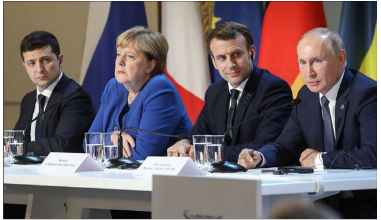
أوكرانيا جرح أوروبي نافذ

ولكن لن يكون هناك ”أحياء من قبل البربري“، من السكيتيين، (الشعب البربري في البحر الأسود في العصور القديمة) أو غيره، ان ”لحم الصيني“ الذي يصنعه شي جين بينغ، يمثل ديستوبيا تجسد أسوأ توقعات جورج أورويل أو ألدوس هكسلي. باختصار، يجب الدفاع عن الغرب.