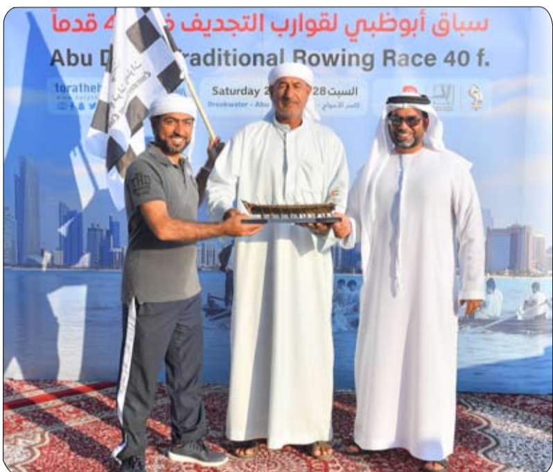
اختتام سباق أبوظبي لقوارب التجديف «40» قداماً