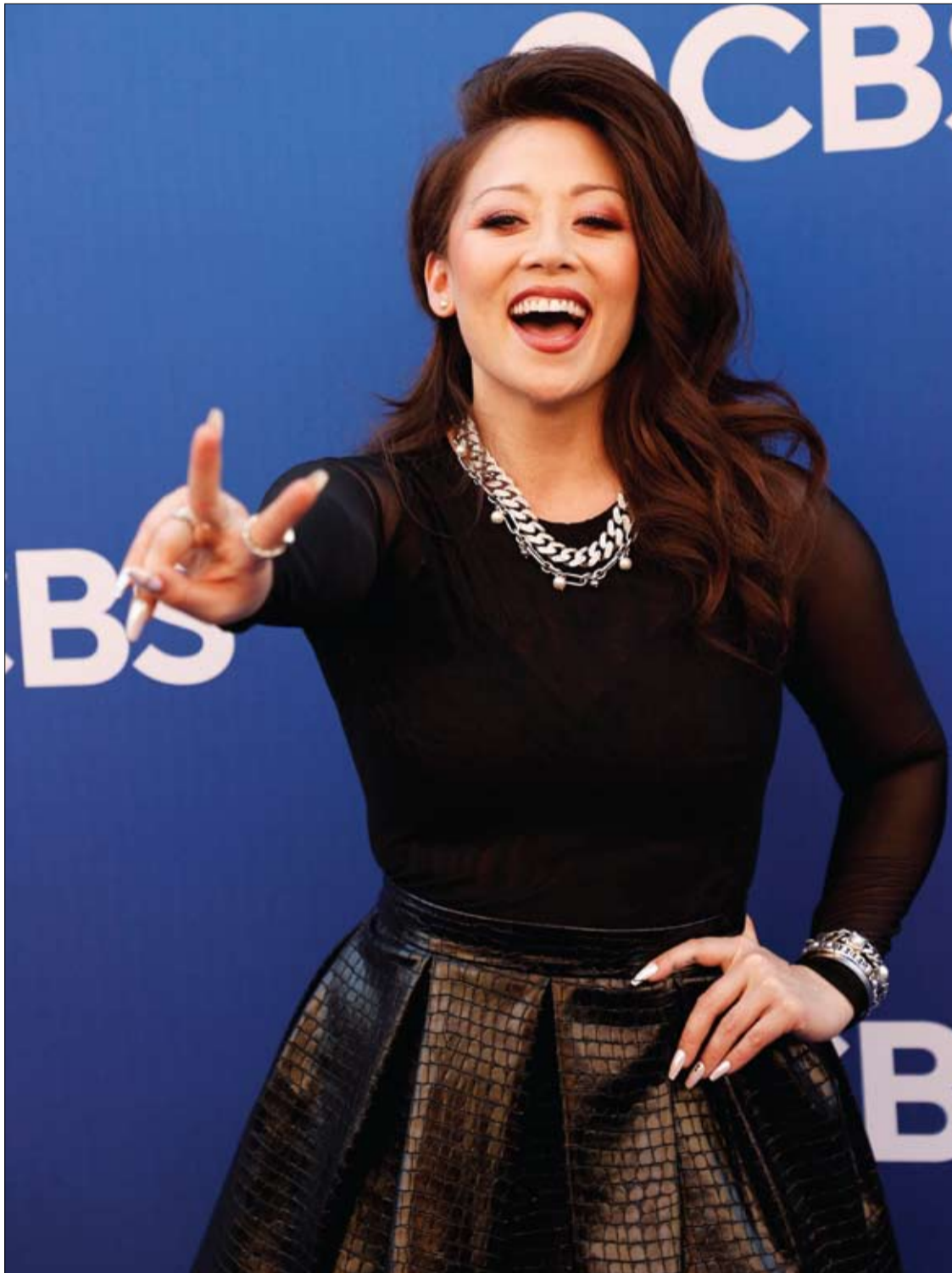
المثلة الأمريكية فيونا رينييه لدى حضورها احتفالاً بالإعلان عن جدول الخريف لشبكة سي بي إس في استوديوهات باراماونت بهوليوود.

وتعتقد الخبيرة أن تطبيق قاعدة "20/80" منطقي أكثر. تتضمن هذه القاعدة اتباع حمية غذائية في 80 بالمئة من الوقت. أما 20 بالمئة المتبقية فتتضمن مختلف العادات الغذائية للحفاظ على الصحة النفسية.