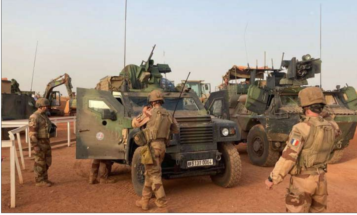
تدخل الجيش الفرنسي في منطقة الساحل والصحراء قد يفشل