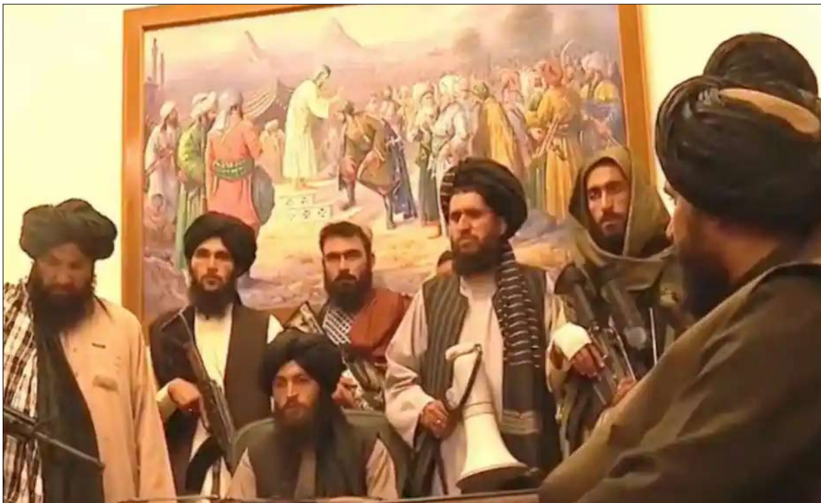
صراعات السلطة تترجم صراعات الهوية