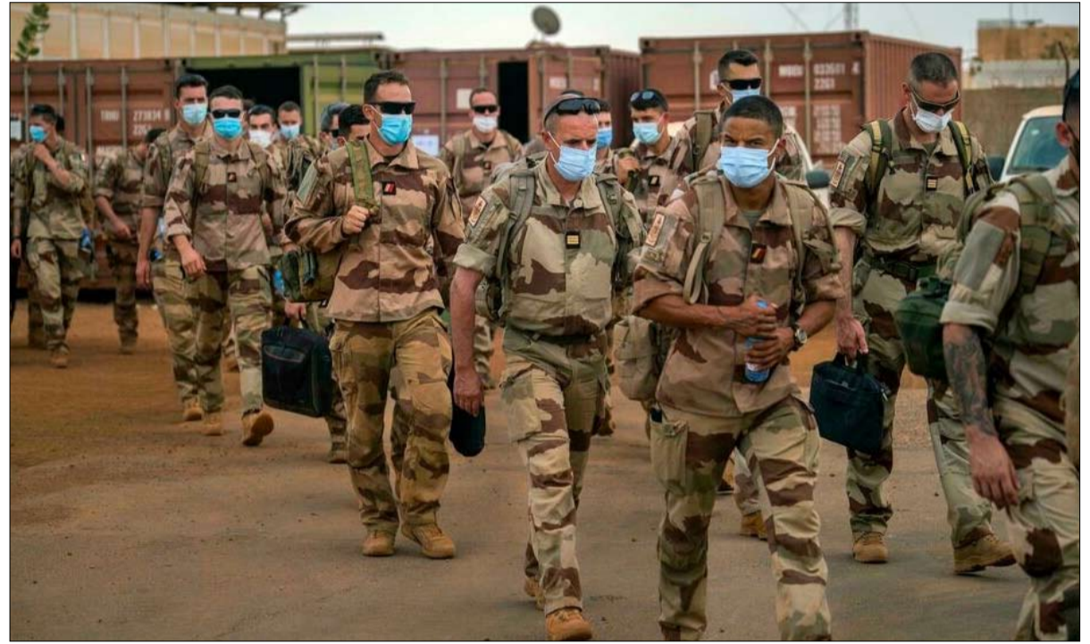
جنود فرنسيون من برخان يغادرون قاعدتهم في غاو

بعد ما يقرب من ست سنوات على المعارك الأولى ضد الجماعات المسلحة، فإن مهمة الجنود الفرنسيين ليست على وشك الانتهاء.