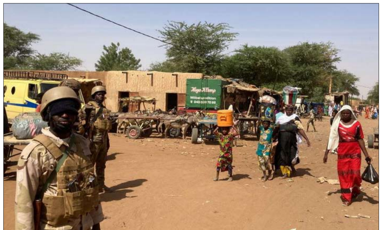
هل يعيد التاريخ نفسه في مالي؟