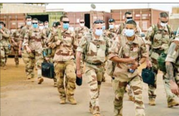
جنود فرانسيسون من برخان يغادرون قاعدتهم في غاو

يبدو التشابه غير مبالغ فيه الإرهاب؛ ماذا لو كثر الفشل الأفغاني نفسه في مالي؟