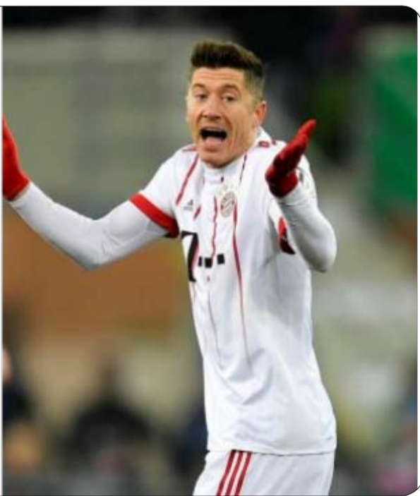
دقيقة في مباراتي الجولة الأولى يقودا فريقيهما نحو مجد محلي وحظماً رقمياً قياسياً، على أمل أن وأوروبي في نهاية الموسم.