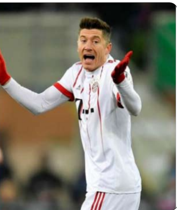
دقيقة في مباراتي الجولة الأولى يقودا فريقيهما نحو مجد محلي وحظماً رقمياً قياسياً، على أمل أن وأوروبي في نهاية الموسم.