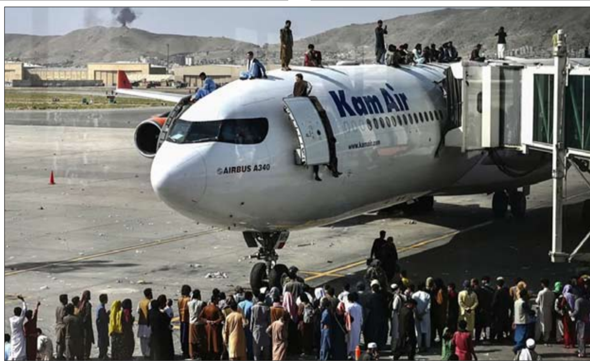
كرامة الامريكان في التراب

أما بالنسبة لأولئك الذين يستشهدون بانحدار أمريكي جديد، ويجرح أصاب كرامة الخارجية.