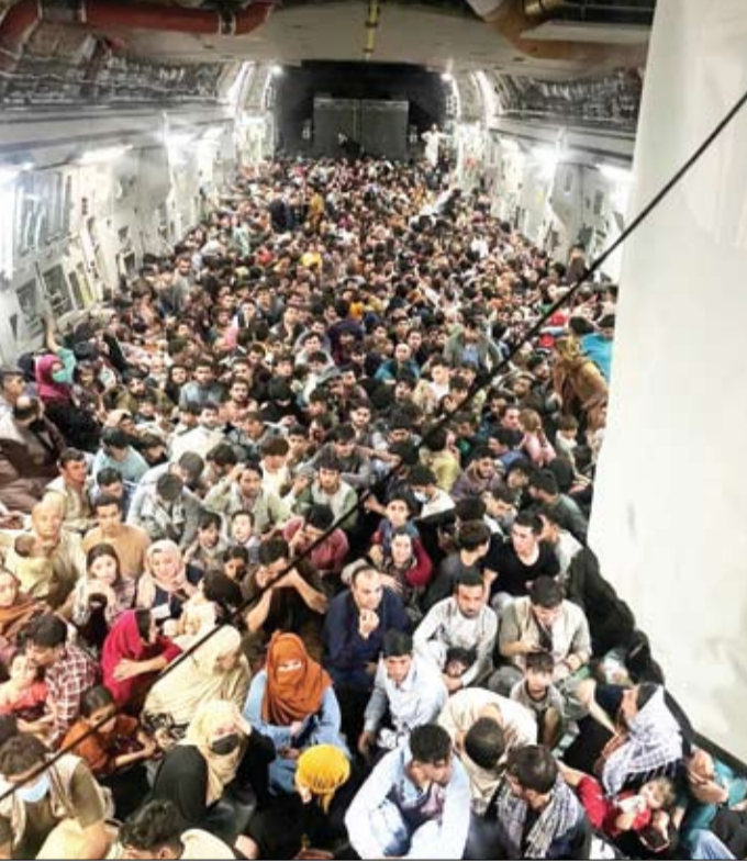
طائرة نقل للقوات الجوية الأمريكية تحمل حوالي 640 أفغانياً إلى قطر من كابول

واعتبر بايدن أن الرئيس الأفغاني (أشرف غني) رفض الانخراط في الدبلوماسية لتتوصل إلى تسوية. وشدد بايدن على أنه لن يكرر أخطاء الماضي بالبقاء والقتال في صراع ليس في مصلحة الولايات المتحدة.