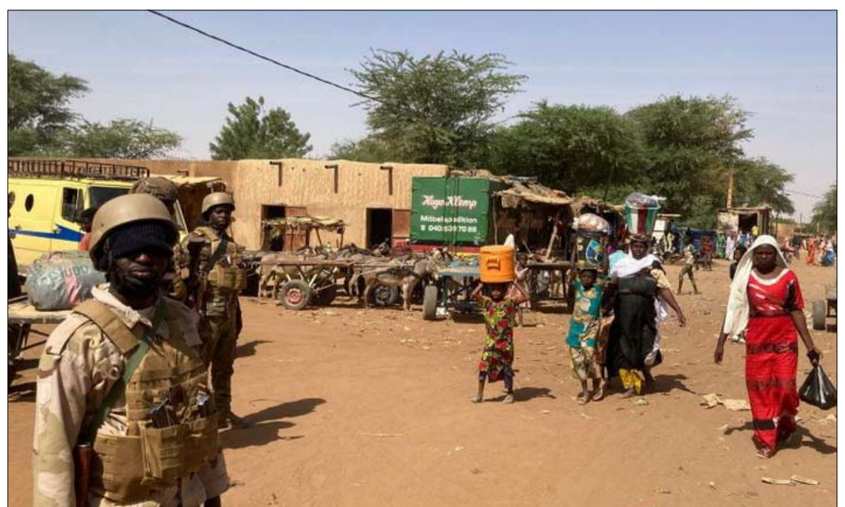
هل يعيد التاريخ نفسه في مالي؟