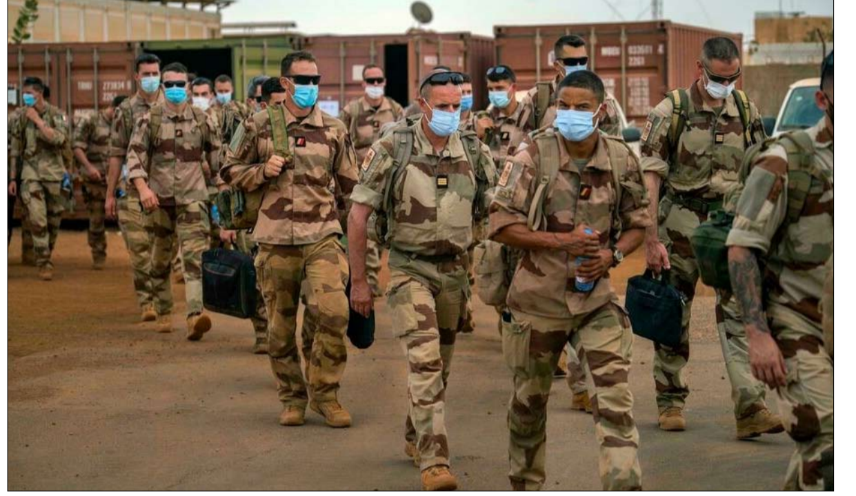
جنود فرنسيون من برخان يغادرون قاعدتهم في غاو

بعد ما يقرب من ست سنوات على المعارك الأولى ضد الجماعات المسلحة، فإن مهمة الجنود الفرنسيين ليست على وشك الانتهاء.