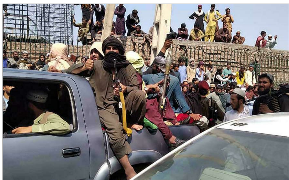
هجوم خاطف غير مجرى الاحداث