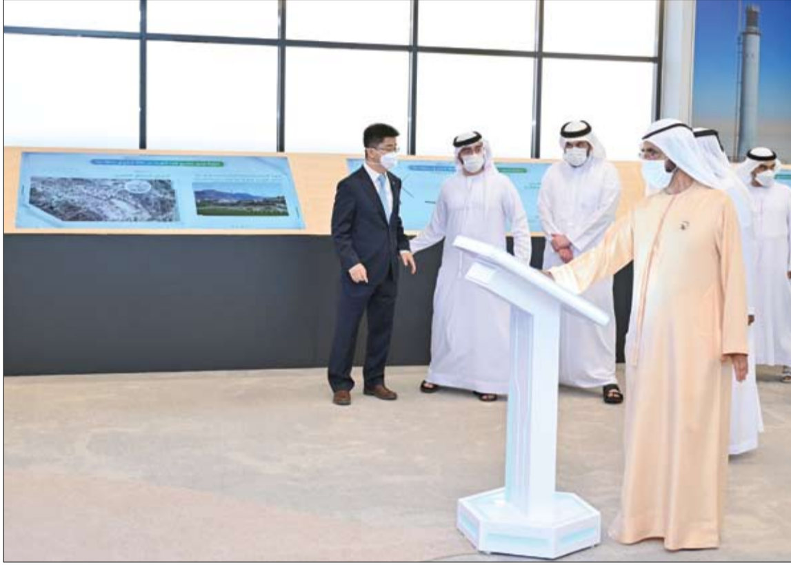
محمد بن راشد يدين المشروع الأول ضمن المرحلة الخامسة من مجمع محمد بن راشد للطاقة الشمسية

رافق سموه في حفل التدشين سمو الشيخ مكتوم بن محمد بن راشد آل مكتوم نائب حاكم دبي، وسمو الشيخ أحمد بن سعيد آل مكتوم، رئيس المجلس الأعلى للطاقة في دبي، وسمو الشيخ أحمد بن محمد بن راشد آل مكتوم، رئيس مجلس دبي للإعلام. (التفاصيل ص2)