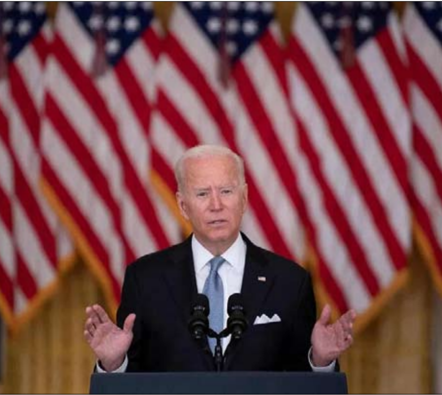
بايدن يتحمل الوزر

البلاد، نذكر أن عودة العظمة الأمريكية سرعان ما جاءت، كرد فعل عنيف، بعد سايقون، مع