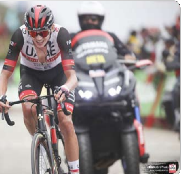
وجدت الفرصة سانحة للانطلاق بأقصى طاقتي، كما أننا وصلنا إلى مسافة التسلق النهائية متقدمين بفارق كبير على المجموعة الرئيسية، ما قادني إلى الانطلاق بهدف تحقيق الفوز، ويؤسفني أنني لم أتمكن من الفوز بالمركز