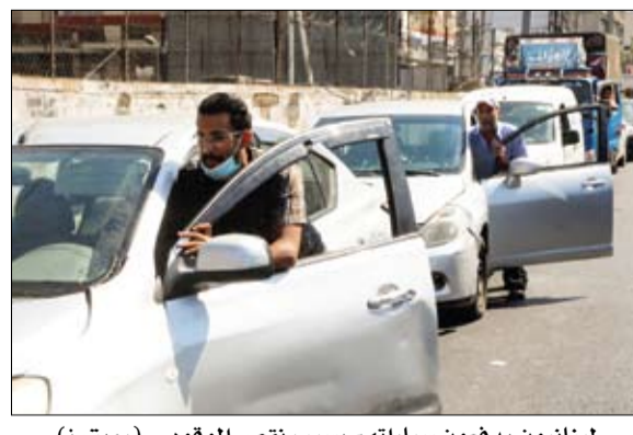
لبنانيون يدهون سياراتهم بسبب نقص الوقود

تويتر، كتب الجيش اللبناني أنه دهم مستودعا للوقود في المدينة الصناعية بمنطقة زوق مصبح بقضاء كسروان بجبل لبنان. وقالت إنه صادر ما 65 ألف لتر من المازوت و 48 ألف لتر من البنزين تم توزيعها على المستشفيات والأفران في المنطقة. وكان الجيش اللبناني دخل على خط أزمة الوقود الخائفة في لبنان في 14 من أغسطس الجاري، حيث باشر في دهم محطات الوقود التي تقفل أبوابها أمام الجمهور وتخزن كميات كبيرة من الوقود. وبسبب رفع الدعم عن الوقود، دخلت الأزمة الاقتصادية في حيزها في لبنان مرحلة جديدة، إذ شح الوقود من المحطات في أنحاء لبنان تقريبا، مما أدى إلى ظهور ما يعرف بطوابير الناز، التي يقف فيها اللبنانيون لساعات أمام المحطات.