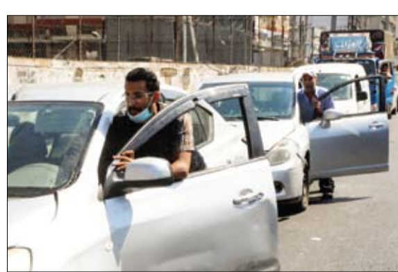
لبنانيون يدهفون سياراتهم بسبب نقص الوقود

تويزر، كتب الجيش اللبناني أنه دهم مستودعا للوقود في المدينة الصناعية بمنطقة زوق مصبح بقضاء كسروان بجبل لبنان. وقالت إنه صادر ما 65 ألف لتر من المازوت و48 ألف لتر من البنزين تم توزيعها على المستشفيات والأفران في المنطقة. وكان الجيش اللبناني دخل على خط أزمة الوقود الخائفة في لبنان في 14 من أغسطس الجاري، حيث باشر في دهم محطات الوقود التي تقفل أبوابها أمام الجمهور وتخزن كميات كبيرة من الوقود. وبسبب رفع الدعم عن الوقود، دخلت الأزمة الاقتصادية الجديدة، واضح في لبنان مرحلة جديدة، إذ شح الوقود من المحطات في أنحاء لبنان تقريبا، مما أدى إلى ظهور ما يعرف بطوابير النذل، التي يقف فيها اللبنانيون لساعات أمام المحطات.