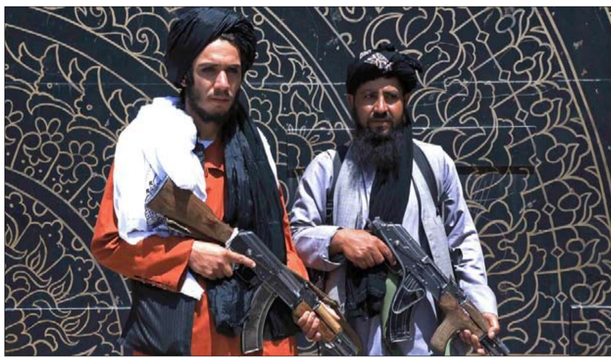
توظيف الجماعات المسلحة يقاوم العلة

والنتيجة هي مرة أخرى تفاقم الصراعات بين الجماعات والطوائف، وهي الآن في ذروتها. إن تسوية النزاع المالي على المديين القصير والمتوسط أصبحت غير ذات صلة، حيث أصبح للمنطق العسكري الأسبقية على نهج الحل السياسي للنزاعات.