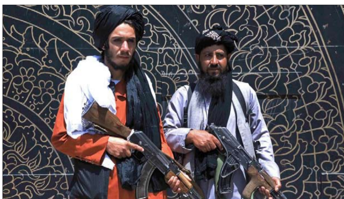
توظيف الجماعات المسلحة يقاوم العلة

والنتيجة هي مرة أخرى تفاقم الصراعات بين الجماعات والطوائف، وهي الآن في ذروتها. إن تسوية النزاع المالي على المديين القصير والمتوسط أصبحت الآن غير ذات صلة، حيث أصبح للمنطق العسكري الأسبقية على نهج الحل السياسي للنزاعات.