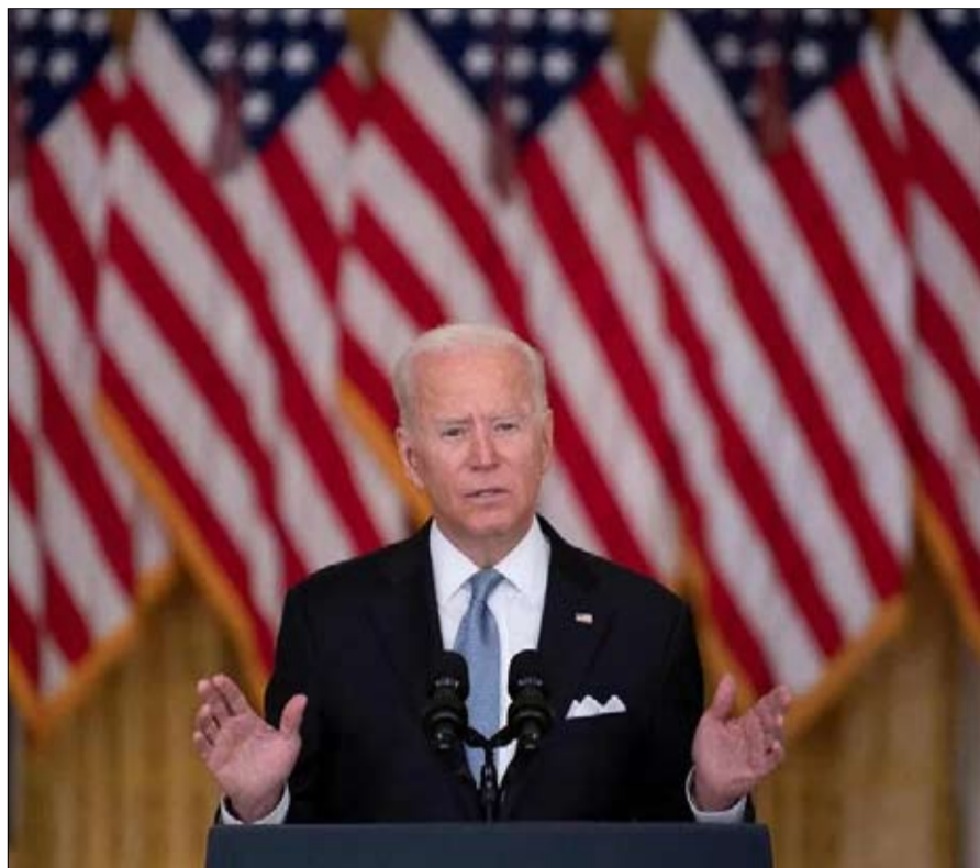
بايدن يتحمل الوزر

البلاد، نذكر أن عودة العظمة الأمريكية سرعان ما جاءت، كرد فعل عنيف، بعد سايقون، مع انتخاب ريغان.