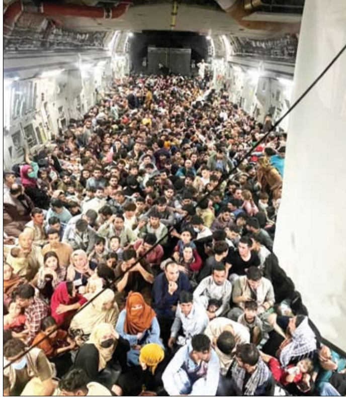
طائرة نقل للقوات الجوية الأمريكية تحمل حوالي 640 أفغانياً إلى قطر من كابول

وقال الرئيس الألماني فرانك- فالتر شتاينماير الثلاثاء، إن مشاهد الأفغان اليائسين في مطار كابول منذ أن استولت طالبان على السلطة في أفغانستان عار على الغرب.