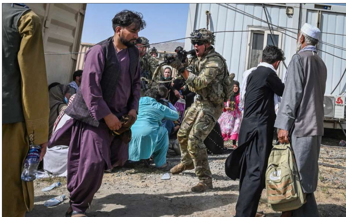
صورة لتلخص حجم الفوضى والنهائية المؤسفة