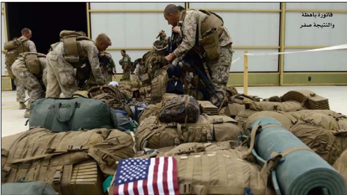
فاتورة باهظة والنتيجة صفر

- كلف الإنفاق على الرعاية الصحية للمحاربين القدامى وحده 296 مليار دولار