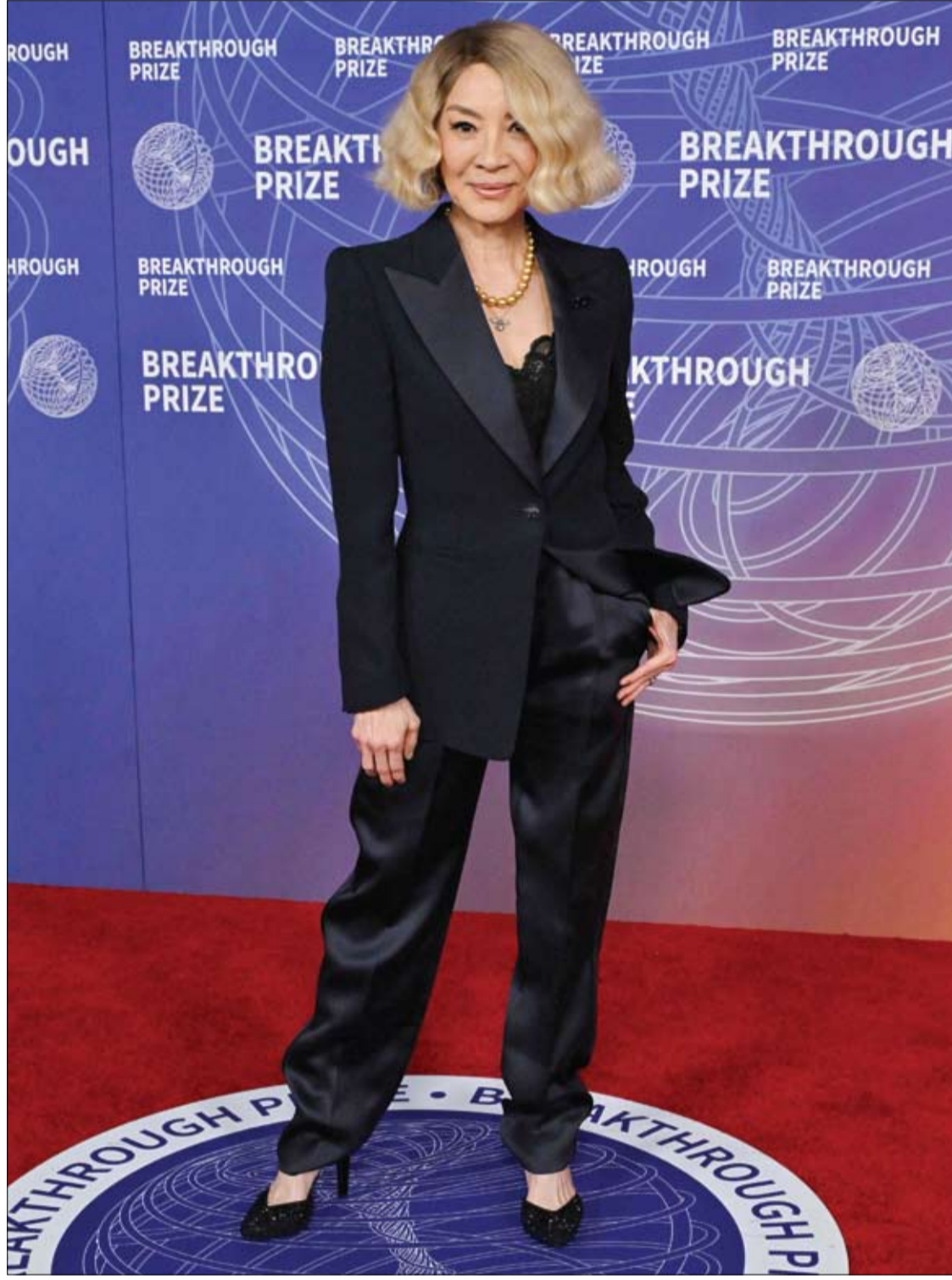
الممثلة الماليزية ميشيل يوه لدى حضورها حفل توزيع جوائز بريكترو الثاني عشر في باركر هانغرا في سانتا مونيكا، كاليفورنيا، 1

ومن جانبه يشير الدكتور اليكسي بانوف، إلى أن تناول الأدوية مع المشروبات الغازية، أو غيرها من المشروبات غير الكحولية قد يؤثر على فعاليتها، بل وقد يسبب آثارا جانبية. فمثلا، تحتوي المشروبات الغازية المحلاة على ثاني أكسيد الكربون، والسكر، والفركتوز، والمنكهات، والأحماض الغذائية، التي تغير مؤقتا درجة حموضة المعدة، وقد تسبب إنتاجا سريعا للغازات، كما قد تسرع أو تبطئ ذوبان غلاف القرص الدوائي.