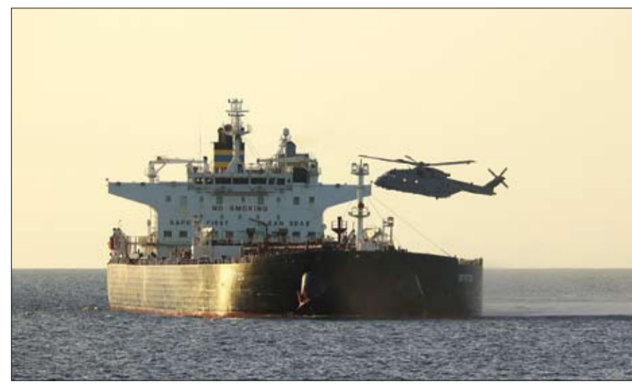
قوات كوماندوز بريطانية خلال عملية اعتراض بحري على متن السفينة «سميرتوس»..

كتب الرئيس الأوكراني فولوديمير زيليونكي الأحد على منصة إكس أن بلاده شنت هجوماً خلال الليل على منشأة نفطية في منطقة ياروسلافل الروسية، وعلى مصنع آزوت للكيماويات في منطقة تولا. وقال زيليونكي إن مصنع آزوت مهم لإنتاج المتفجرات في روسيا. وأضاف أنه تم شن هجمات أيضاً على أهداف لوجستية عسكرية روسية في المناطق المحتلة من أوكرانيا. هذا وأعلنت وزارة الدفاع الروسية، أمس إحرار تقدم ميداني ملحوظ على جميع محاور العملية العسكرية الخاصة، مشيرة إلى أن قواتها تمكنت حتى اللحظة من السيطرة وتطهير 117 مبنى في بلدة كوستيانيتيفكا الاستراتيجية الواقعة ضمن أراضي مقاطعة دونيتسك. بحسب سيوتنيك، وأوضح المتحدث الوزارة، في بيانهما الإيجازي اليومي، أن النجاحات العسكرية المتتالية والتقدم المتسارع للقوات الروسية في عمق كوستيانيتيفكا، فرضت واقعا ميدانياً جديداً أجبر السلطات الأوكرانية في كييف على بدء عمليات إجلاء واسعة للمؤسسات والإدارات الرسمية والرئيسية من بلدي كراماتورسك ودروجوفكا المجاورتين، ونقلها باتجاه مناطق غربي أوكرانيا.