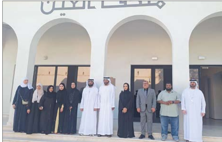
بمشاركة سالم بن ركاض

ومن المبادرات النوعية التي صاحبت البرنامج مبادرة "ههوة وكتاب"، التي استندت إلى توزيع كتاب "علمتي الحياة، لصاحب السمو الشيخ محمد بن راشد آل مكتوم ودراسة محتواه بصورة أسبوعية داخل الإدارات والأقسام بما أسهم في نشر المعرفة وتعزيز ثقافة التعلم المستمر وخلق بيئة عمل إيجابية قادرة على التعامل مع التحديات بروح المبادرة والمسؤولية. وتؤكد نتائج البرنامج نجاحه في تحقيق أهدافه حيث بلغت نسبة رضا المستبئين 99.7% وتحصل البرنامج على اعتماد عالمي إلى جانب حصول المشاركين على تسع شهادات محلية ودولية متخصصة دعمت مسيرتهم المهنية والقيادية. وانعكس أثر البرنامج بصورة مباشرة على ما يقارب 200 موظف يعملون ضمن الفرق التي يقودها المشاركون الأمر الذي أسهم في تعزيز الأداء المؤسسي ورفع مستوى الجاهزية المستقبلية داخل