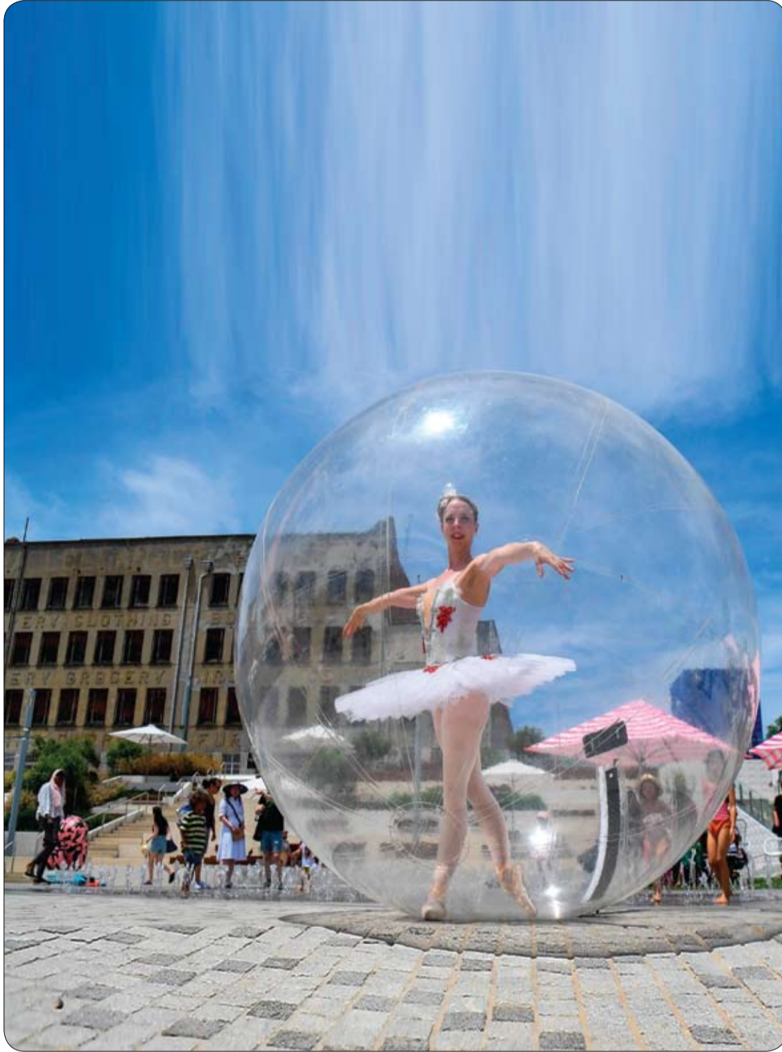
راقصة باليه تقف في فقاعة بلاستيكية عملاقة أثناء فعاليات ترفيهية للمتسوقين بمناسبة أعياد الميلاد في ملبورن.

وقال اختصاصي أمراض القلب بادما كول، من المعاهد الكندية للأبحاث الصحية: "هناك فجوات في التشخيص وجودة الرعاية والمتابعة لجميع المرضى. نحن بحاجة إلى أن نكون يخطئين، وأن ننتبه إلى تحيزاتنا ولأولئك الأكثر عرضة للخطر، للتأكد من أننا فعلنا كل شيء ممكن في تقديم أفضل علاج".