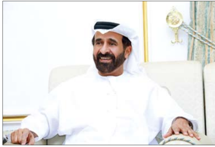
مسلم بن حم يطلق مجلس «بن حم الذكي»