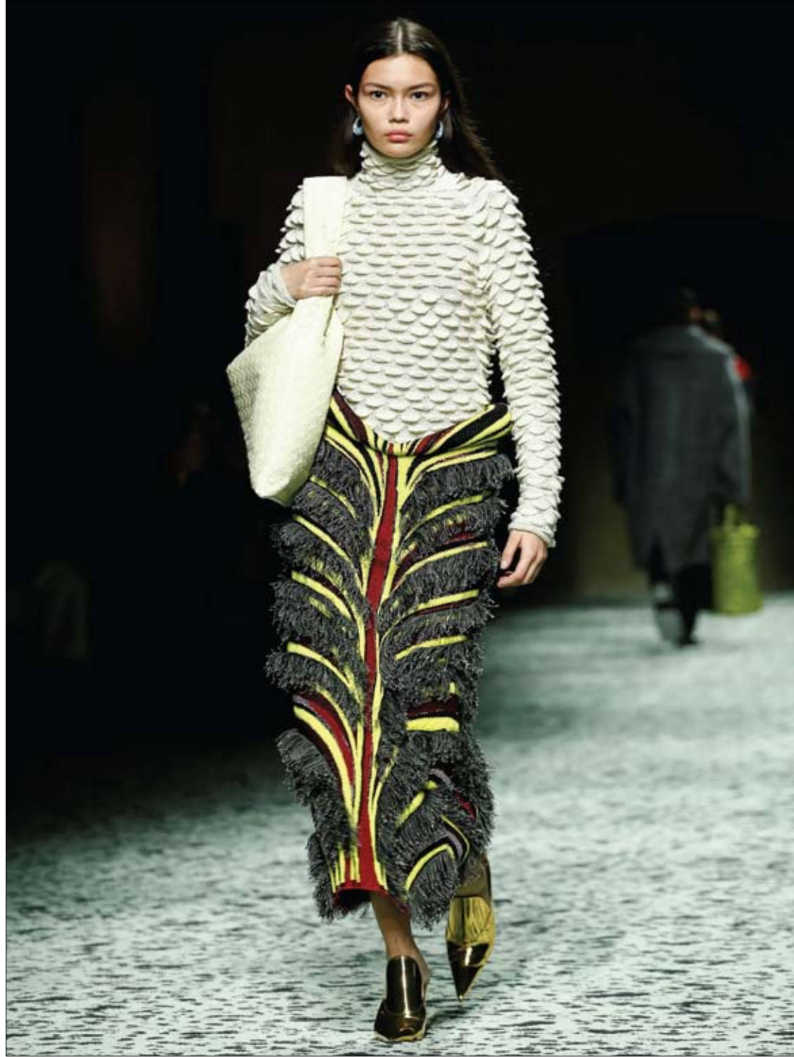
عارضه تقدم زيا من مجموعة بوتيجا فينيتا خلال أسبوع الموضة في ميلانو، إيطاليا.

على الرغم من أن ضعف البصر أمر لا مفر منه مع التقدم في العمر، إلا أن العمى ليس كذلك بالنسبة لمعظم الناس. وفي الواقع، يمكنك تجنب العمى من خلال اتباع أسلوب حياة صحي، وإضافة ما يكفي من فيتامين A في نظامك الغذائي لأن نقصه يمكن أن يسبب العمى بشكل مباشر. وفي الواقع، نقص فيتامين A هو "السبب الرئيسي للعمى الذي يمكن الوقاية منه" لدى الأطفال في جميع أنحاء العالم، كما تحذر الأكاديمية الأمريكية لطب العيون (AAO). ويلعب الفيتامين دورا مهما في رؤيتك. وكما توضح AAO، لرؤية الطيف الكامل للضوء، تحتاج عينك إلى إنتاج أصباغ معينة لشبكية عينك لتعمل بشكل صحيح. وتوضح: "نقص فيتامين A يوقف إنتاج هذه الأصباغ، ما يؤدي إلى العمى الليلي. وتحتاج عينك أيضا إلى فيتامين A لتغذية أجزاء أخرى من عينك، بما في ذلك القرنية". وتضيف: "بدون فيتامين A الكافي، لا تستطيع عينك إنتاج رطوبة كافية للحفاظ على ترطيبها بشكل صحيح". كيفية زيادة فيتامين A تشمل المصادر الجيدة لفيتامين A (الريتينول) ما يلي: - جبنة. - بيض. - الأسماك الزيتية. - الحليب والزبادي. - منتجات الكبد.