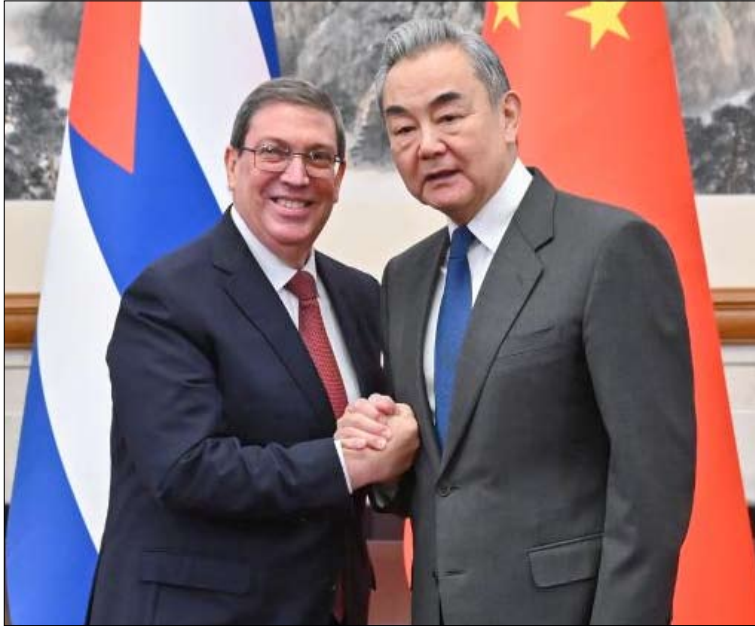
وزير خارجية الصين خلال استقباله نظيره الكوبي