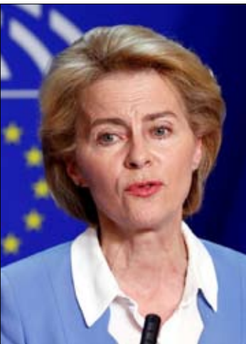
أورسولا فون دير لاين

كشفت موقع «يوراكتيف» وإي يو نيوز، عن صراع داخلي حاد على السلطة. كالاس، الدبلوماسية الإستراتيجية التي تقود الدائرة الدبلوماسية، أعربت عن مخاوفها من أن إنشاء وكالة جديدة تابعة للمفوضية قد يهبط