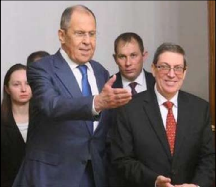
وزيرا خارجية روسيا وكوبا يبحثان التعاون