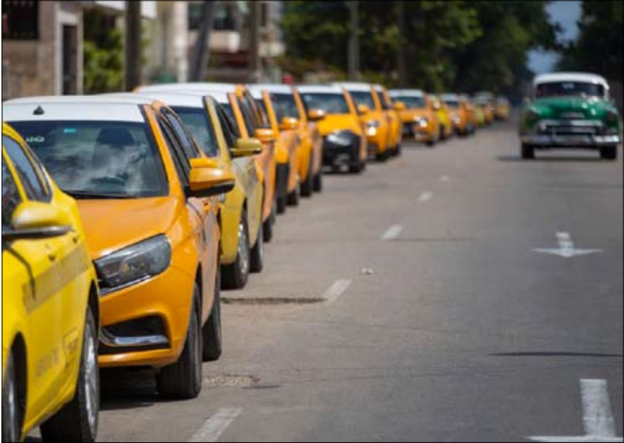
طوابير السيارات أمام محطات الوقود في كاراكاس