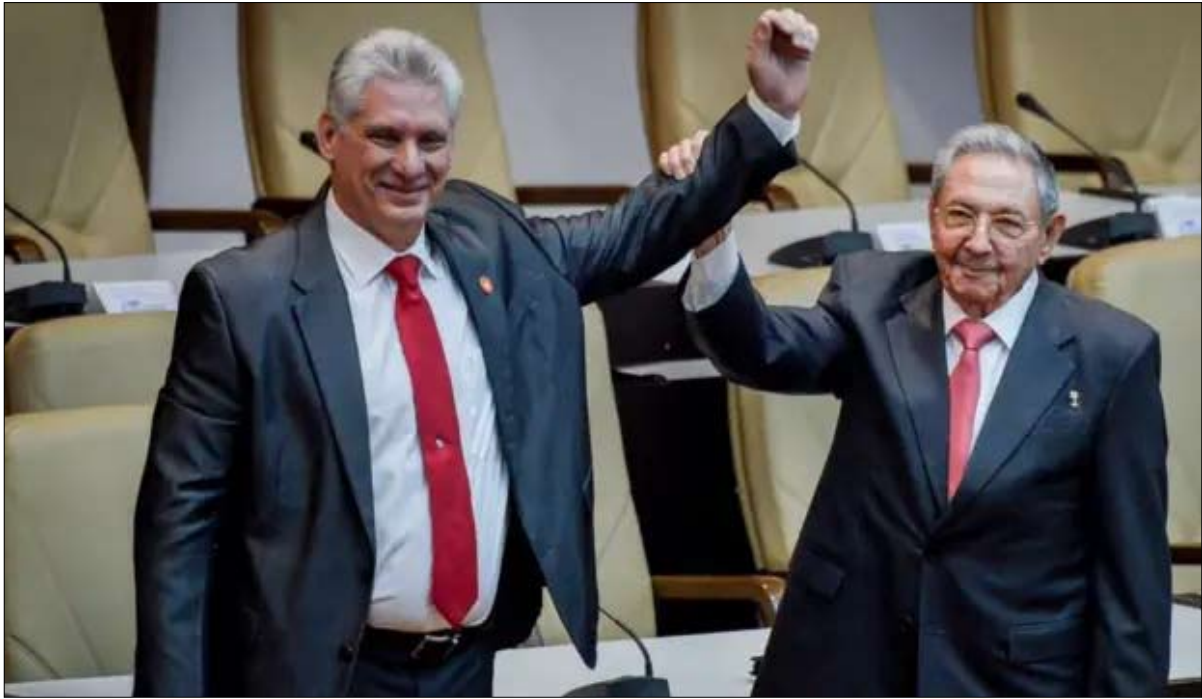
ميغيل دياز كانييل المهندس الذي خلف الأخوين كاسترو في قيادة كوبا

«لا يمكن لأحد أن يتجاهل معاناة الشعب الكوبي. إن العقوبات المفروضة على بائعي النفط ظالمة للغاية، ونحن نسعى إلى حل دبلوماسي مواصلة إمداد كوبا بالوقود». وتشير التقارير إلى أن المكسيك عرضت التوسط في هذا النزاع، ولكن وفقًا لألنوجاري، «لا كوبا ولا الولايات المتحدة مهتمتان بوجود دولة ثالثة، لطالما كان من سمات البلدين التكتّم التام على محادثاتهما. فمادًا قد تتناول أي مفاوضات محتملة؟ تقول جانيت هابيل: «بإمكان كوبا أن تعرض إطلاق سراح السجناء السياسيين الذين يُقدّر عددهم بنحو ألف سجين وتنفيد