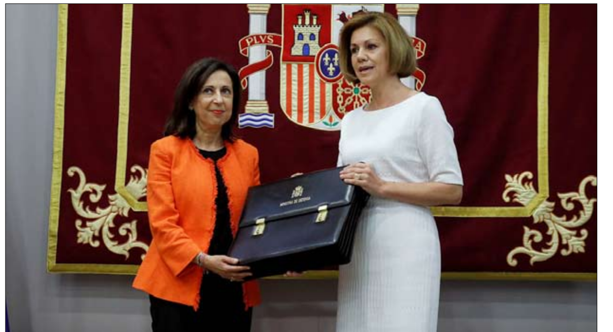
الوزيرة الجديدة - بين الصورة- تتسلم حقيبة الدفاع