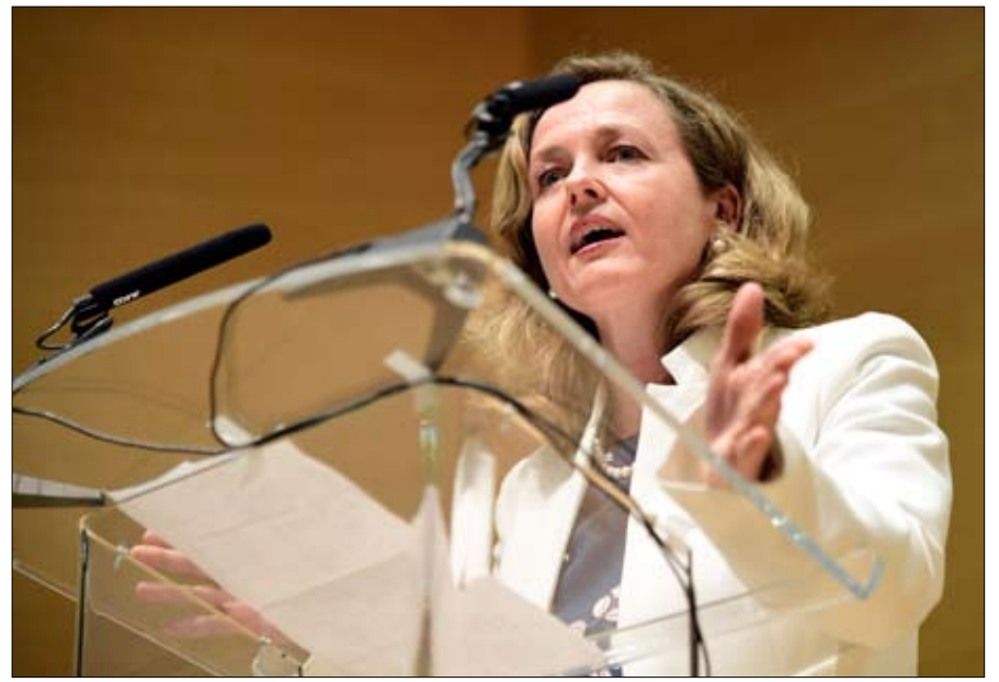
وزيرة الاقتصاد الجديدة

تحويل الضرورة الى فضيلة.. هذا هو الإنجاز الذي حققه رئيس الحكومة الإسبانية، بيدرو سانشيز، الذي، على رأس حزب اشتراكي دون بوصلة، ومهدد من قبل بوديموس، ولا يملك سوى أقلية من النواب في الغرفة الثانية (68 من أصل 350، أي أقل من 20 بالمائة). تمكن من تشكيل حكومة ذات شخصية مميزة جدا، بأوريته، وخاصة بنسويتها، وبالأفضلية