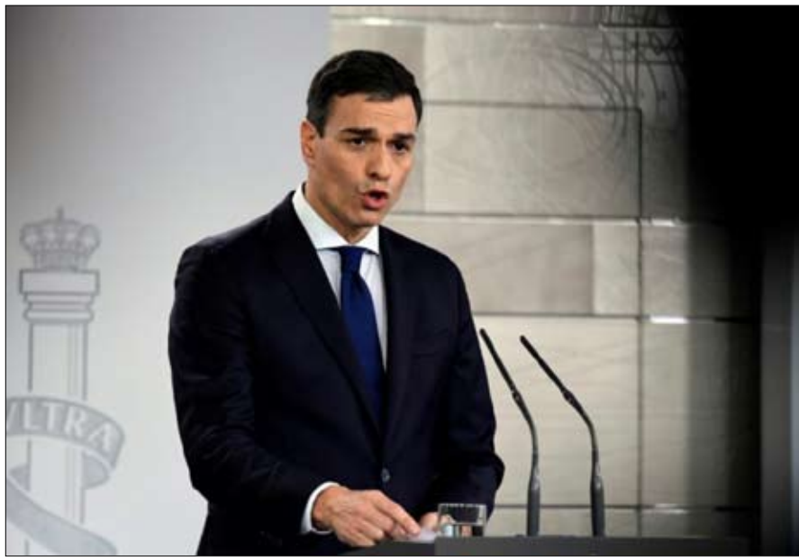
بيدرو سانشيز رسالة للمستقبل في صورة الفوز

«تلاميذ نجباء لبروكسل» وحتى سيودادانوس «المواطنون»، وهو الحزب الليبرالي من يمين الوسط الذي يستلهم من الرئيس الفرنسي ماكرون - وتمنحه استطلاعات الرأي الافضلية في الانتخابات المتوقعة - يصف لهذه المستجدات: "هذا مثال على الأوربية والتقدم"، يعترف الزعيم توني رولدان. خصوصا فيما يتعلق باختيار وزير