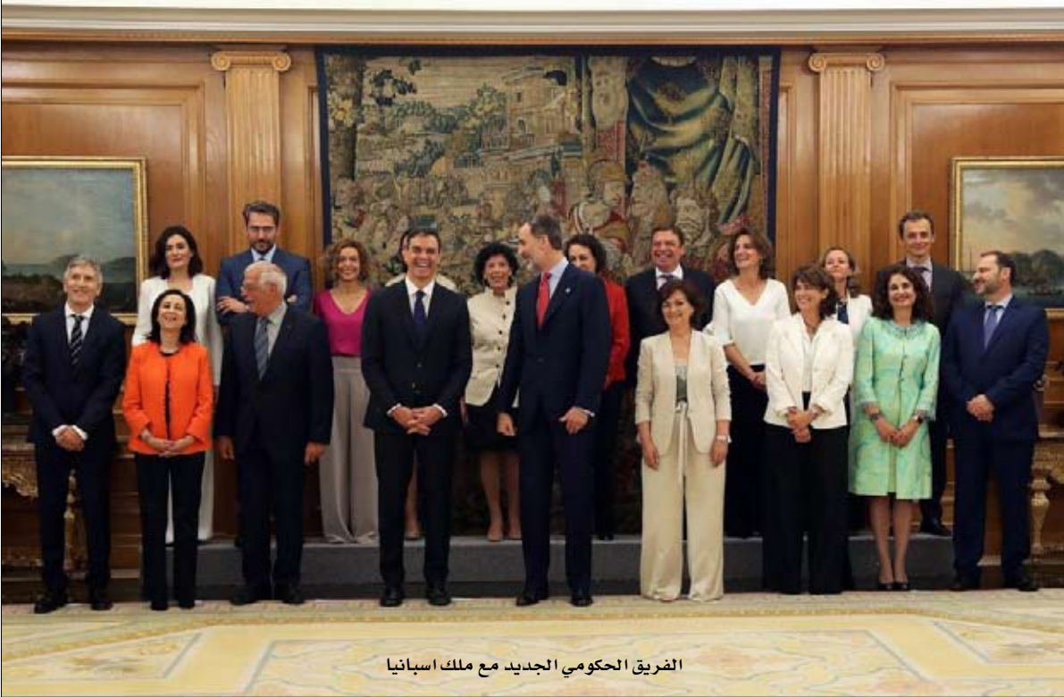
الفريق الحكومي الجديد مع ملك اسبانيا

الخارجية الأوروبي جدا جوزيب بوريل. ومع ذلك، على المستوى السياسي، قد يبدو بناء مثل هذه الحكومة القوية والكفوءة متناقضا، بما أنها لن تعمّر طويلا.