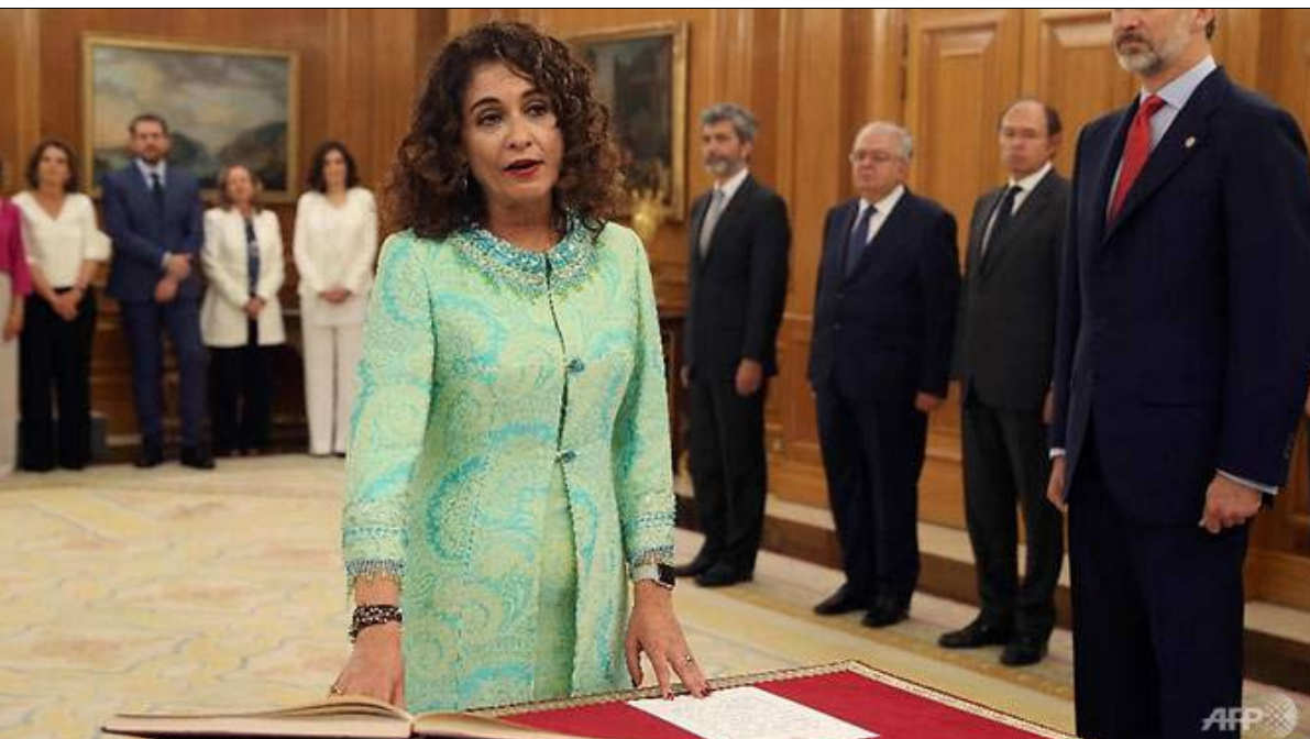
وزيرة المالية تؤدي اليمين الدستوري