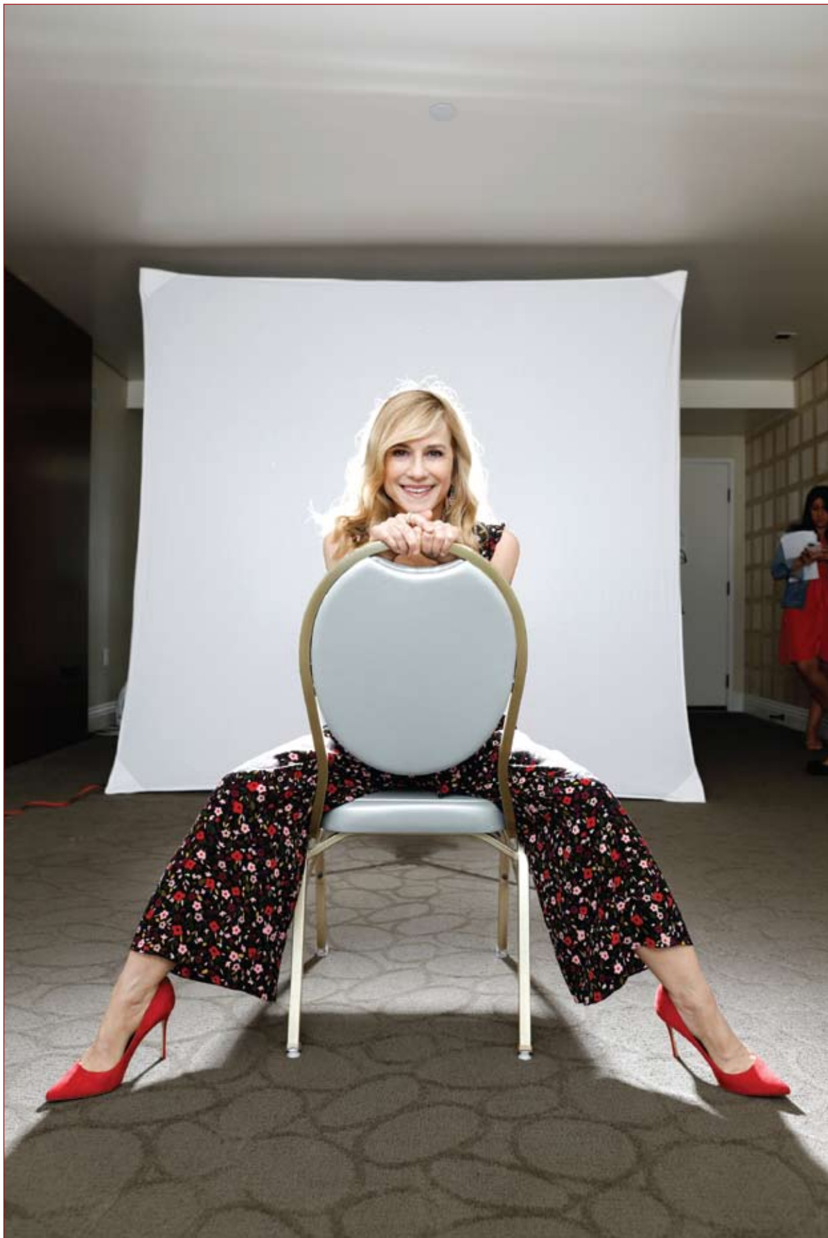
الممثلة هولي هنتر في صورة شخصية للترويج لفيلم "الخارقون 2" في غرب هوليوود، كاليفورنيا.

تجبر فضيلتان لحبواين برمائيتين عاشا في الدائرة القطبية الجنوبية قبل 360 مليون سنة العلماء على إعادة التفكير في أصول الفقاريات البرية وأين نشأت والظروف المناخية التي حيات ذلك. وقال علماء إنهم عثروا في باطن الأرض على بقايا حيوانات برمائية بدائية عاشت في العصر الديفوني ويطلق عليها (توتوسيسوس أوملامبو) و(أومزانتسيا أمازانا) في موقع ووترلو فام بالقرب من جراهامز تاون في جنوب أفريقيا. ورغم أن البقايا التي عثر عليها كانت عبارة عن أجزاء غير مكتملة، قال العلماء إن الفضيلتين كان لديهما على الأرجح أربعة أرجل وكان هيكلها يشبه غالبية البرمائيات الأولى بجسد يمزج بين التمساح والسمكة وكانت تتغذى على الأسماك الصغيرة عندما تكون في الماء وربما على الحيوانات اللاقارية بينما تكون على اليابسة. وكان طول حيوان فضيلة (أومزانتسيا) 70 سنتيمترا وله فك سفلي نحيل وطويل يحوي على الأرجح أسنانا بارزة صغيرة. أما حيوان فضيلة (توتوسيسوس) فكان طوله متر تقريبا، وقد سُمي على اسم ديزموند توتو كبير الأساقفة الأنجليكانيين في جنوب أفريقيا وناشط حقوق الإنسان.