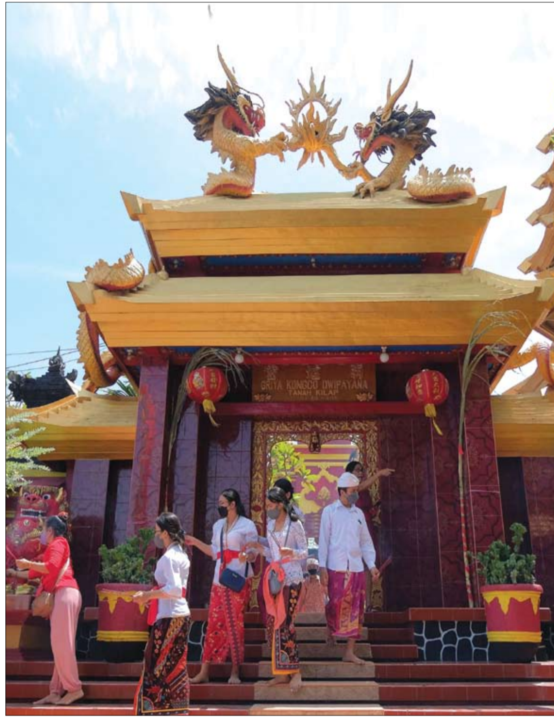
مصلون يرتدون ملابس تقليدية من جزيرة بالي في معبد أونج تاي جين جريا كونجو دويبايانا خلال احتفالات السنة القمرية الصينية الجديدة في دينباسار، بالي.

وقالت مؤلفة الدراسة الرئيسية مينا تهراني، زميلة ما بعد الدكتوراه في كلية جونز هوبكنز: "أحد الطرق الرئيسية لتسويق السجائر الإلكترونية هي أنها تعمل في درجات حرارة أقل من الاحتراق، ما يجعلها أكثر أماناً من التدخين التقليدي. وتُظهر دراستنا أنه يمكن تطبيق نهج البصمات الجديد هنا لتقييم ما إذا كانت العمليات الشبيهة بالاحتراق مستمرة".