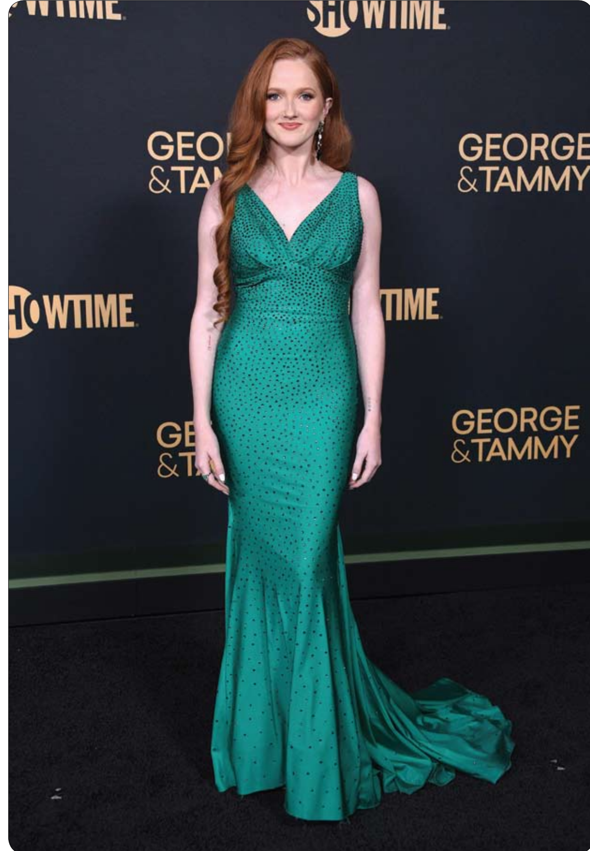
الممثلة الأمريكية أبي جلودر لدى وصولها لحضور العرض الأول لمسلسل شوتايم المحدود «جورج وتامي»، في لوس أنجلوس

وقال بوتينغر: "الأضرار التي لحقت بالمركبة تشير إلى أنها اصطدمت بشيء ثم انقلبت عدة مرات"، مضيفا أن السيارة استقرت على عجلاتها.