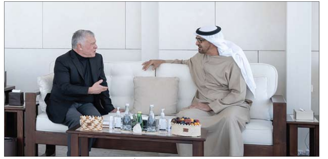
رئيس الدولة خلال استقباله ملك الأردن

مالية عالمية، وهدفنا استقطاب استثمارات أجنبية مباشرة تتجاوز 650 مليار درهم خلال 10 سنوات، وسيضيف التحول الرقمي الحالي 100 مليار درهم لاقتصاد دبي سنويا.. لدينا اليوم أكثر من 300 ألف مستثمر في دبي.. وأدعو الجميع للانضمام لرحلتنا لتكون إحدى أسرع المدن نمواً في العالم..» (التفاصيل ص3)