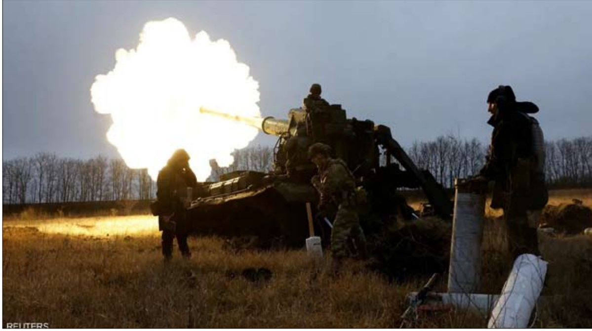
المخابرات الغربية الموجودة داخل أوكرانيا.

بداية ساعنة لعام 2023 بين موسكو وكيفيف، فكيف سترد روسيا، وإلى أين تتجه الحرب؟