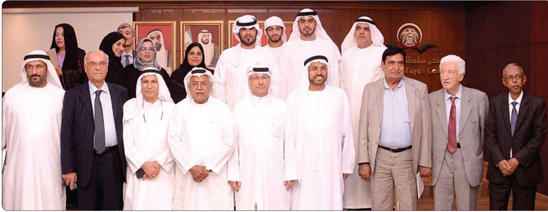
في مركز سلطان بن زايد