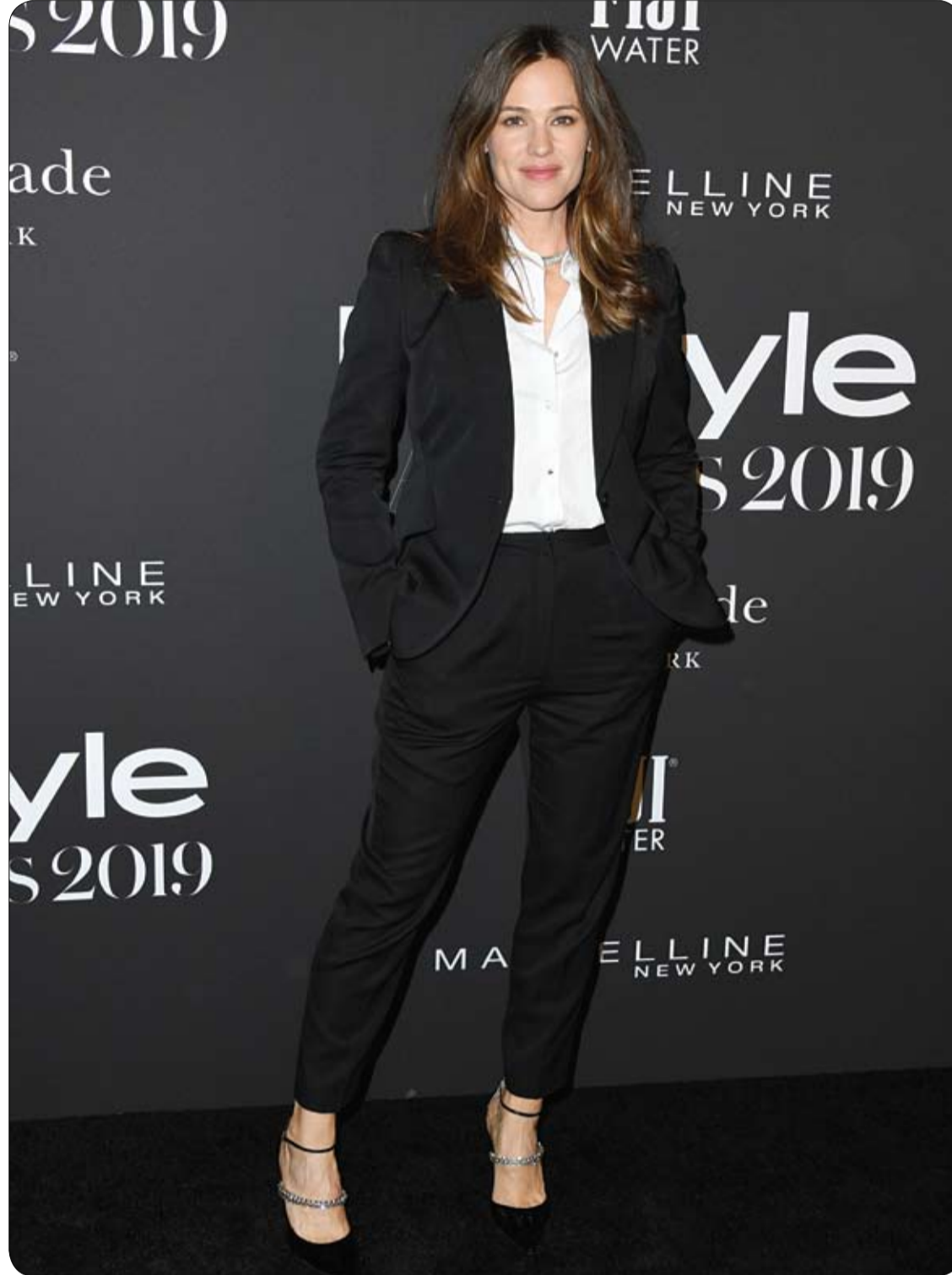
جنيفر غارنر خلال حضورها جوائز InStyle لعام 2019 في لوس أنجلوس، كاليفورنيا. 1 ف ب

التغذية لابد من تناول طعام متوازن؛ 50% منه أطعمة نيئة وعصائر طازجة، وأن يكون معظم الطعام من الفواكه والخضروات والحبوب الكاملة. تناول منتجات الألبان الحامضة بانتظام مثل: الزبادي واللبن الرائب للتغلب على الإجهاد المزمن، مع تناول الكثير من الماء 8-8 أكواب- بمعدل كوب كل ساعتين أو ثلاث ساعات في النهار. ممنوع أكل المحار والأطعمة القليلة، المملحة، وكذلك الأطعمة المعبأة والتقليل من السكر والدقيق الأبيض. الاستحمام بالماء البارد بشكل منتظم يخفف من أعراض الإجهاد المزمن. تناول الكوسة والقرع بجميع أشكالهما مع قدر قليل من اللحوم الحمراء. مرزولة بعض التمرينات الرياضية بانتظام، فالعقل السليم في الجسم السليم، مع الحرص على النوم وأخذ الراحة الكافية للمساعدة في التركيز. تناول السبانخ والطماطم لاحتوائهما على مواد تحفز المخ، ويستحسن أن يكون تناوله بعيداً عن وقت النوم.