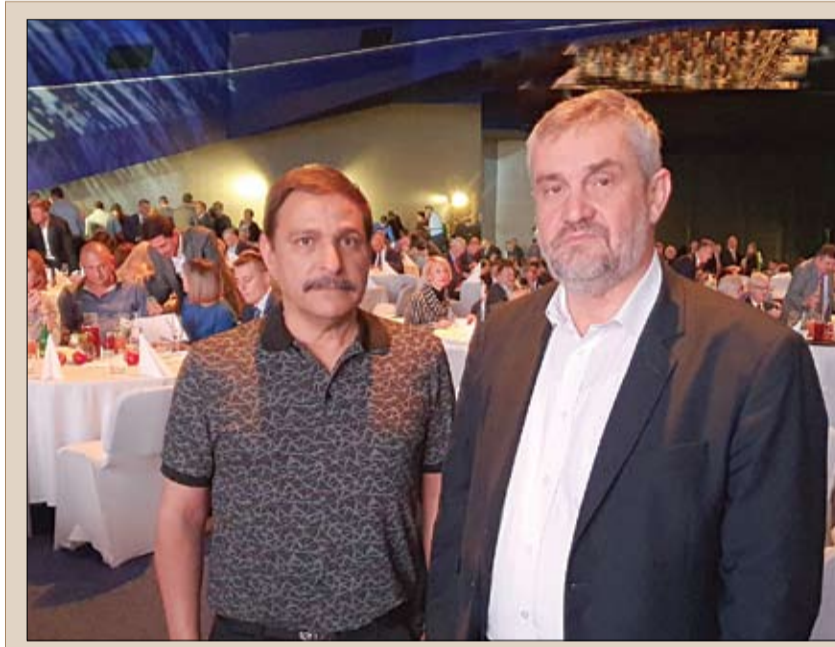
مدير التحرير خلال لقائه بوزير الزراعة البولندي

وأضاف أن ثقنتنا الكبيرة في قدرة دبي على إبهار العالم في اكسبو 2020 جعلتنا نشارك بجناح كبير وغير تقليدي إيمانا منا بأنه سيشكل منصة عالمية تسمح لنا بتقديم أنفسنا ومنتجاتنا وثقافتنا وهنوتنا ومقوماتنا السياحية لشعب الإمارات وللملايين من زوار المعرض.