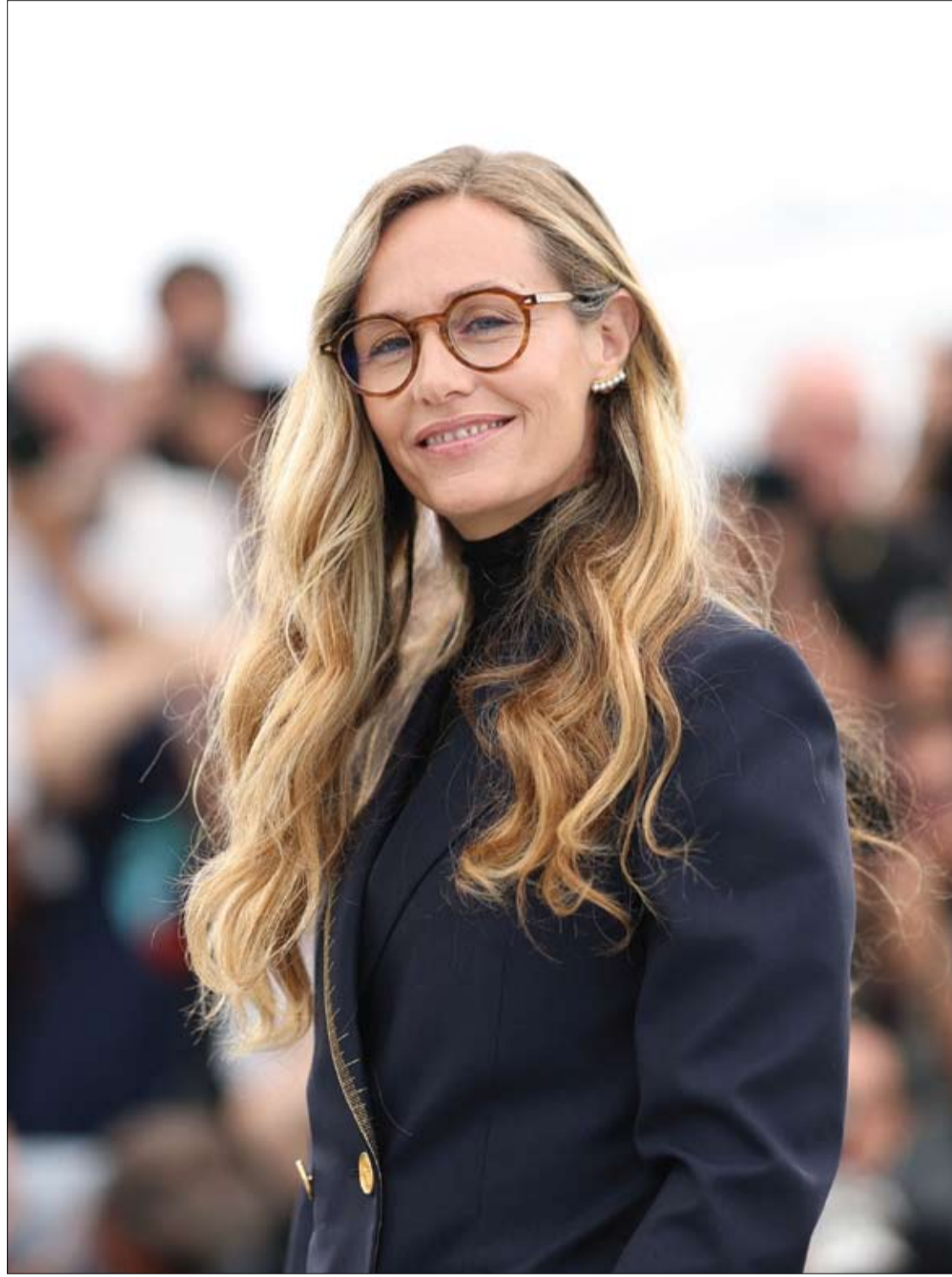
الممثلة البلجيكية سيسيل دي فرانس خلال جلسة تصوير لفيلم 'L'Affaire Marie-Claire'، في الدورة 79 لمهرجان كان السينمائي.