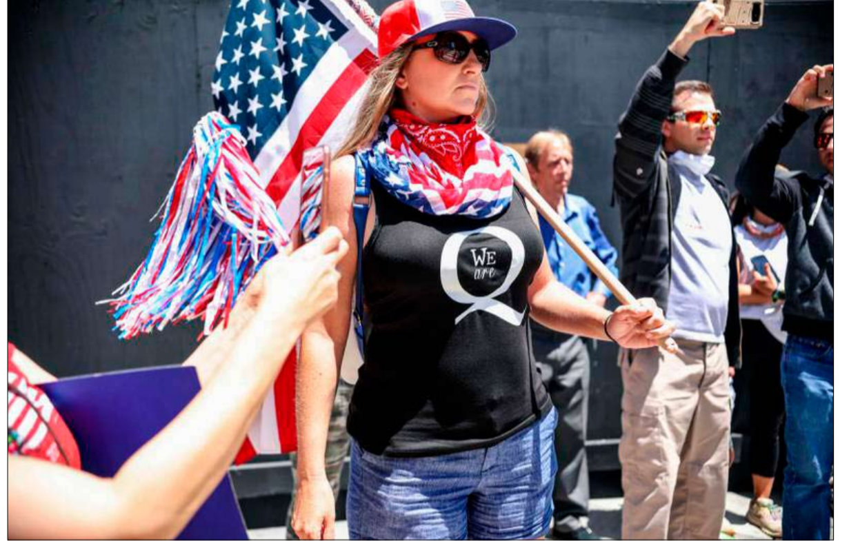
خلال مظاهرة ضد الإجراءات الصحية

إلى قاعدة غوانتانامو. وكشف الحقيقة، للعالم الذي "استفاق" أخيراً، على الطبيعة الشيطانية والمستغلة جنسياً للأطفال وللدولة العميقة والنخب الديمقراطية، ودور ترامب الحارس. الموعد النهائي، حتماً، يتم تأجيله باستمرار، وأتباع كيو أنون كانوا يراهنون على يوم 4 مارس، موعد تنصيب الرؤساء الأمريكيين حتى الثلاثينات، للإعلان عن العودة الكبرى لدونالد ترامب، وانتصار قوى الخير ضد الشر.