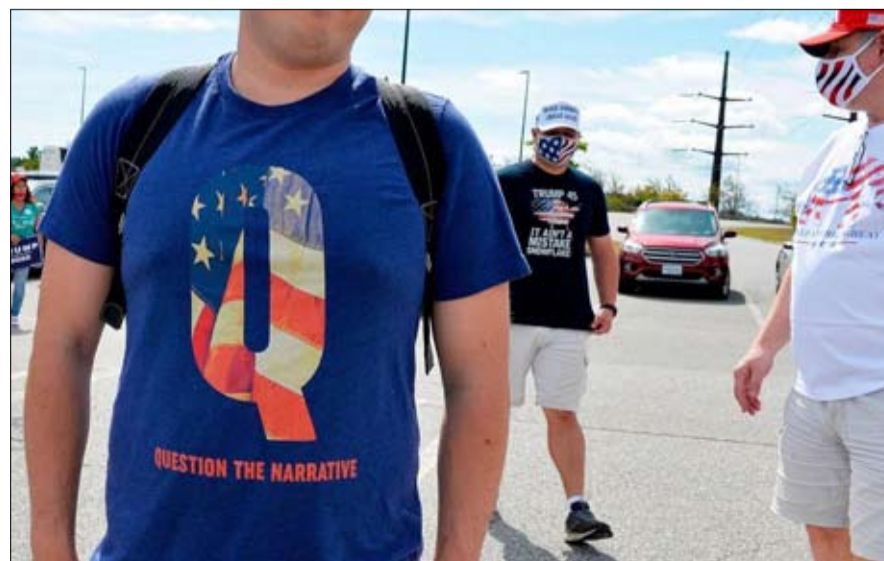
عدد الاتباع في ازدياد