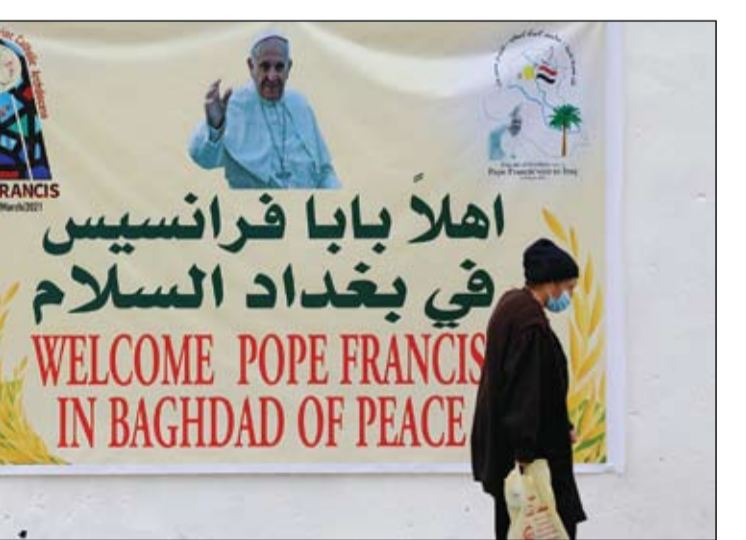
امرأة تسير بجوار ملصق يرحب بزيارة البابا فرانسيس للعراق

كذلك، لفت إلى أنه لا يتوقع حصول تغيير في مهام البعثة وستبقى استشارية، دون أن يكون هنالك دعم للعمليات القتالية. يذكر أن مسألة رفع عدد قوات الناتو في البلاد، كانت تردت كثيرا في الأونة الأخيرة محليا ودوليا. والشهر الماضي، أكد أمين عام الناتو، ينس ستولتنبرغ، أن الحلف قرر توسيع مهمة تدريب القوات العراقية ورفع تعدادها من 500 إلى 4000.