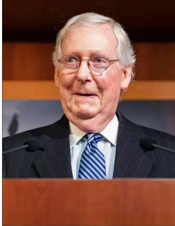
ميتس ماكونيل هل ينتصر الاعتدال على التطرف؟

دونالد ترامب)، هل يمكنكم أخيراً أن يحلوا محل الجناح الراديكالي، يتامى المستأجر السابق للبيت الأبيض؟ ليس متأكدًا، وفقاً للتفسير الاستراتيجي ويت أيريس: "هذا الفصل الشعبي، المناهض للخبعة، والمناهض للفكر، والمناهض للاستبلاشمنت، والمناهض للإعلام، والمناهض للمهاجرين، والمناهض لـ"توري"، كان موجوداً قبل ترامب بفترة طويلة، وسوف يعيش بعده. على المدى القريب، يواجه ترامب تحقيقين يتعلقان بالضغط التي مارسها في 2 يناير لعكس نتيجة الانتخابات في جورجيا، ومسؤوليته عن التمرد في الكابيتول هيل في 6 يناير. تضاف إليها الإجراءات، قيد التنفيذ، أمام محاكم نيويورك بتهمة الاحتيال والتهرب الضريبي. عودة دونالد ترامب الكبيرة ليست مؤكدة بعد... وفي الانتظار، تستمر مطاردة "الخونة".