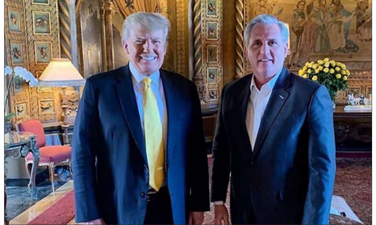
زار زعيم الجمهوريين في مجلس النواب كيفين مكارثي ترامب في فلوريدا