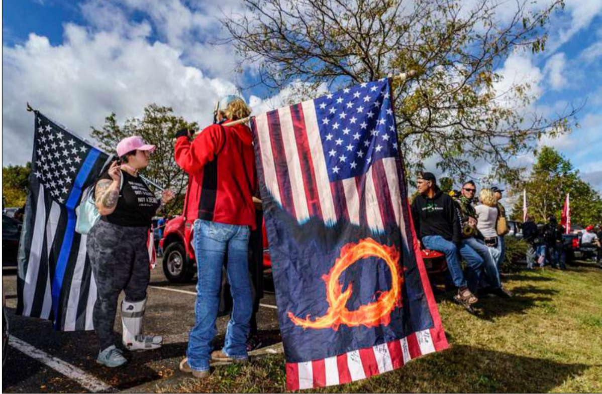
في مظاهرة لليمين المتطرف نظمها برود بوير

في 30 مايو 2019، أضاف مكتب التحقيقات الفيدرالي إلى "قائمة الإرهابيين الخطرين على الجبهة الداخلية" مجموعة لم يسمع عنها سوى عدد قليل من الناس: كيو أنون، شائعة نشأت في