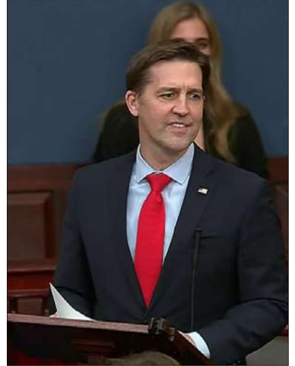
بن ساس...رأسه مطلوبة

الترامبيون يستخدمون كل الوسائل ضد «الخونة»...! إنقاذ الحركة المحافظة، يقتضي تقديم جبهة موحدة ضد سياسات جو بايدن