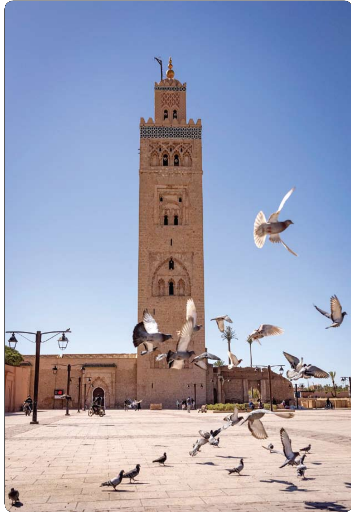
حمام يطير في ساحة مسجد الكتبية في مدينة مراكش المغربية.

قُدر سعر وعاء صغير من الخزف الصيني سيُطرح للبيع في مزاد تنظمه دار "سودنيز" بما بين 300 ألف و500 ألف دولار، علماً أن مالكه كان اشتراه لقاء 35 دولاراً بحسب من سوق للأغراض المستعملة في ولاية كونيتيكت في شمال شرق الولايات المتحدة. وكان "المكتشف" المحظوظ الذي لم يُعلن عن اسمه طلب من "سودنيز" تخمين الوعاء المزين بزخارف زهرية دقيقة، فأرسل إليها أولا صورة، ثم أحضر القطعة نفسها، فاتضح أنها تعود إلى القرن الخامس عشر وأن زخارفها رسمت لبلابل الإمبراطور يونغل، ثالث الأباطرة من سلالة مينغ. وقالت رئيسة قسم الفنون الصينية في دار "سودنيز" في نيويورك أنجيلا ماكاتير لوكالة فرانس برس إن شكل الوعاء "المميز للغاية" ونمطه الزهري يضعه في فئة نادرة للغاية من الأوعية، إذ لا يوجد منه في العالم، وفق ما يتوافر من معلومات، سوى ستة نماذج أخرى مماثلة. وأوضحت أن خمسة من الأوعية الستة محفوظة في متاحف، بينها اثنتان في تايبيه وأخران في لندن وواحد في طهران. أما السادس "فشهد آخر مرة في السوق عام 2007"، على ما أفادت. وتوقعت أن يكون المزاد الذي يقام في 17 آذار-مارس محط اهتمام جامعي الأعمال والمؤسسات على السواء، في ضوء هذه المعطيات.