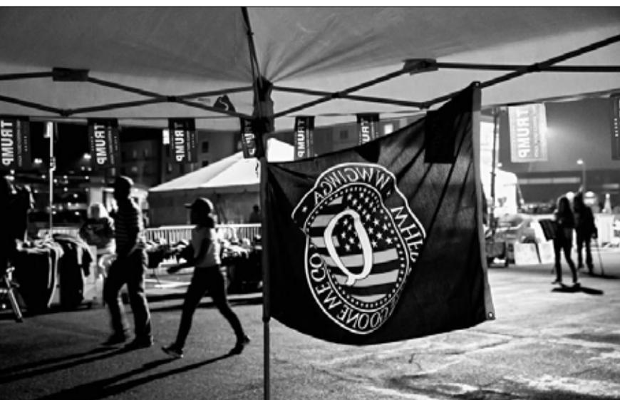
علم كيو أنون في مسيرة مؤيدة لترامب