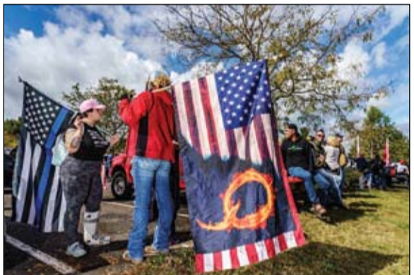
في مظاهرة اليمين المنظر نظهما برود بوبز

في 6 يناير ويقال إنها على وشك ارتكاب عمليات أخرى لزعزعة الاستقرار على الأراضي الأمريكية. في شهادته يوم الثلاثاء أمام مجلس الشيوخ، هجمات. (التفاصيل ص13)