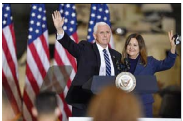
مايك بنس في الصف الأول من المدنيين

في 6 يناير ويقال إنها على وشك ارتكاب عمليات أخرى لزعزعة الاستقرار على الأراضي الأمريكية. في شهادته يوم الثلاثاء أمام مجلس الشيوخ، هجمات. (التفاصيل ص13)