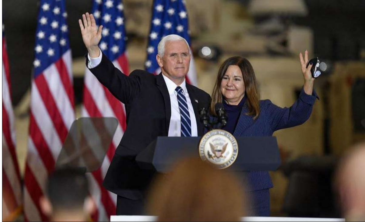
مايك بنس في الصف الأول من المدانين

إذا استمر الجمهوريون في مغازلة كيو انون واستعداد الناخبات والأقليات العرقية، ستخفض أعدادهم