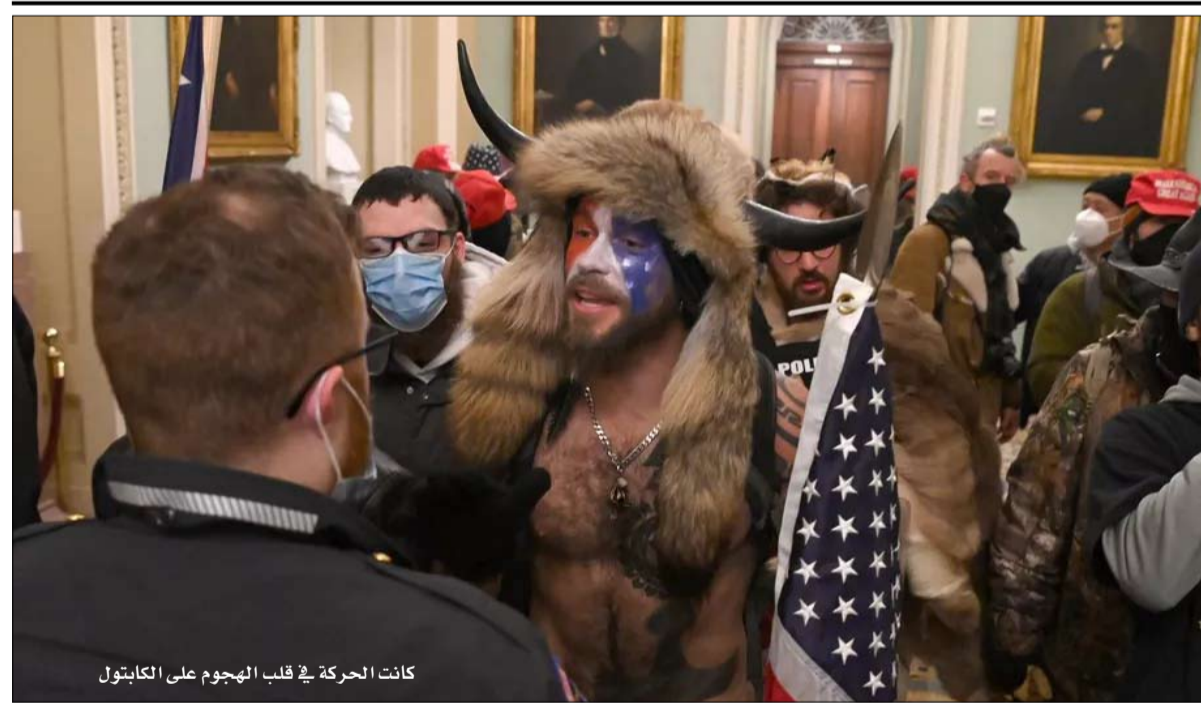
كانت الحركة في قلب الهجوم على الكابيتول