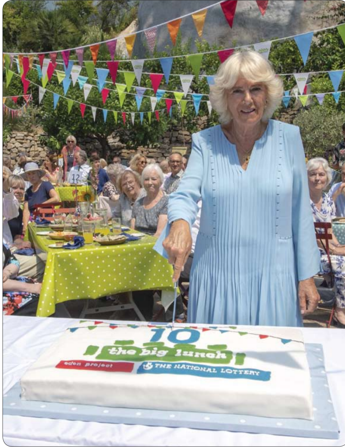
كاميلا ، دوقة كورنوال البريطانية خلال قيامها بتقطيع كعكة عيد ميلاد أثناء حضورها الاحتفال بالذكرى العاشرة لمبادرة الغذاء الكبير في مشروع إيدن بجنوب غرب إنجلترا بهدف جمع الجيران لقضاء بضع ساعات من الصداقة والمرح معا.

احذر الحمية القاسية ومن جانبها حذرت خبيرة التغذية الألمانية أنتيه جال من اتباع ما يعرف بالحمية الغذائية القاسية (Crash Diet) التي تعد بخسارة الكثير من الكيلوغرامات في غضون فترة زمنية قصيرة، وذلك خوفا من تأثير (اليويو) حيث يزداد وزن الجسم مجددا بعد الرجوع إلى العادات الغذائية القديمة. وتتمثل أفضل طريقة لإنقاص الوزن بشكل صحي -تقول الأخصائية- في تعديل النظام الغذائي على المدى الطويل، أي الإكثار من الخضراوات والفواكه والإقلال من الحلويات والوجبات السريعة والأغذية الجاهزة، بالإضافة إلى ممارسة الرياضة والأنشطة الحركية لمدة تتراوح بين ثلاثين وستين دقيقة يوميا.