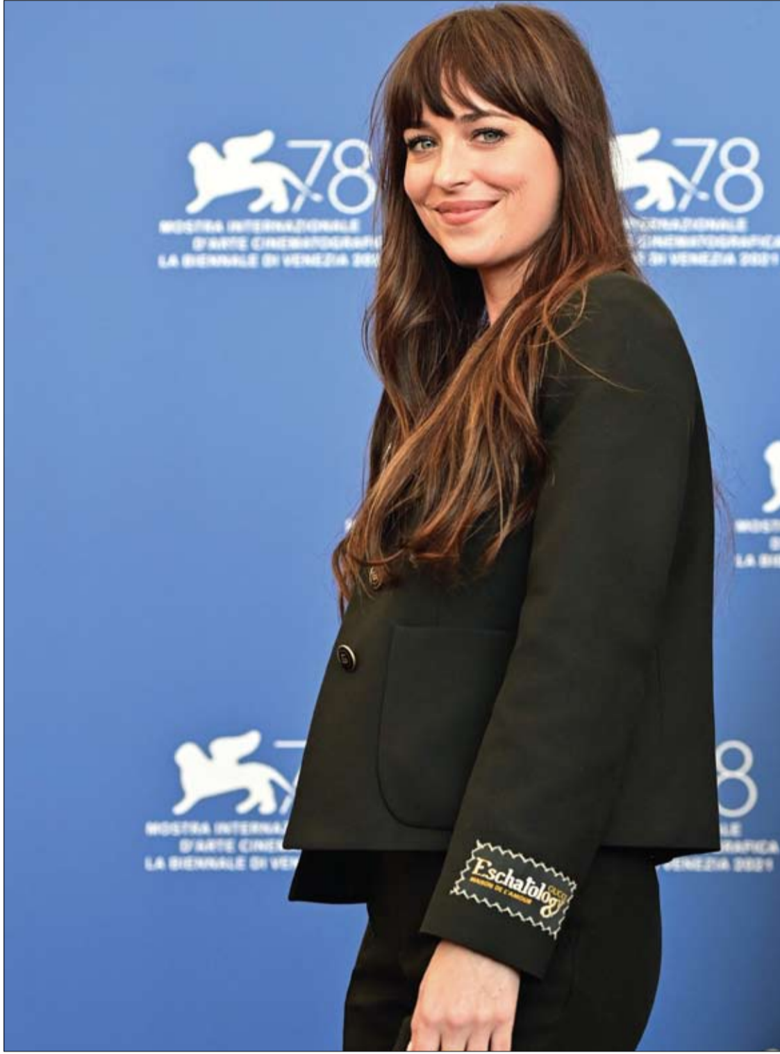
الممثلة الأمريكية داكوتا جونسون لدى حضورها عرض فيلم «الابنة المفقودة»، ضمن مهرجان البندقية السينمائي. اف ب