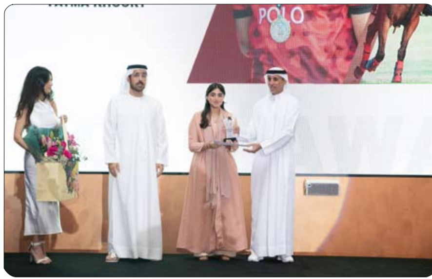
أصحاب الألقاب الذين ابدعوا في الموسم الحالي وشدد على حرصه التي تم تنظيمها مما ضاعف من أوجه الحبتور التهنئة الى الفرق أصحاب الإنجازات واللاعبين هذه المكاسب والنجاحات.

الاتحاد والأندية على تشجيع وتكريم البراعم والمواهب الواعدة من اللاعبين ولللاعبات المواطنين على حد سواء منوها الى ان هذا الحفل جاء توجيهاً لجهود كبيرة وتميهاً لها وليكون حافظاً وشاحداً لمن لم يحالفه الحظ هذا الموسم. وأختتم رئيس اتحاد الامارات للبولوب تصريحه بالتأكيد على حرص اتحاد الامارات للبولوب على بذل الغالي والنفس في سبيل رفع اسم وعلم الدولة في جميع المحافل الرياضية. شمل التكريم أكثر من 28 شخصاً وفريقاً وشركة راعية حيث نال فريق الامارات بقيادة سمو الشبيخة مينا بنت محمد بن راشد آل مكتوم جائزة أفضل فريق راعي اسمهم في إدارة بطولاته بشكل مثالي وشامل الى جانب تسخير كافة الإمكانيات