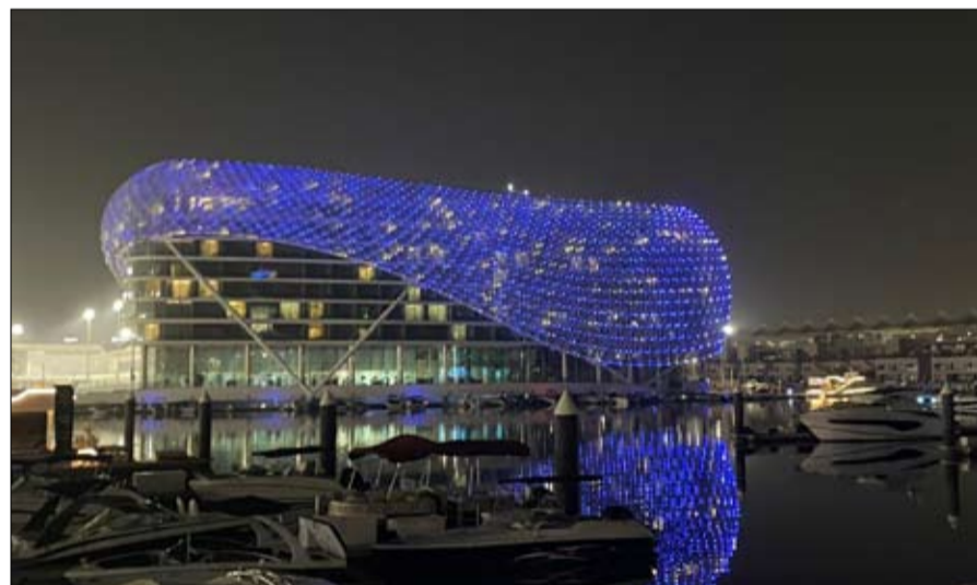
بتوجيهات من سمو الشخة شيخة