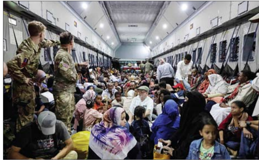
مواطنون بريطانيون تم إجلاؤهم من السودان على متن طائرة سلاح الجو الملكي البريطاني

العامة بالجيش، وأن وحدات من الجيش تقوم بعمليات تمهيدية في منطقة حلفايا بالخرطوم بحري. وقد غرق السودان في الفوضى منذ انفجر في منتصف أبريل الصراع الدامي بين قائد الجيش عبدالفتاح البرهان وقائد قوات الدعم السريع محمد حمدان دقلو حميدتي. وقد أوقعت الحرب مئات القتلى و75 ألف شخص إلى الدول المجاورة مصر وإثيوبيا وتشاد وجنوب السودان وفق مكتب الأمم المتحدة لتنسيق الشؤون الإنسانية، فيما تنظم دول أجنبية عمليات إجلاء واسعة.