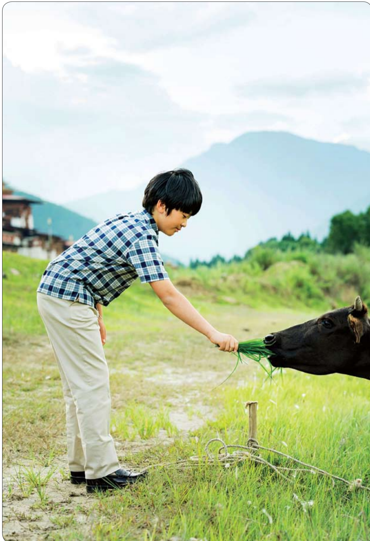
الأمير الياباني هيمايتو، نجل ولي العهد أكيشينو خلال جولة حول حقول الأرز في يوناخا، بوتان. حيث بلغ الأمير هيمايتو من العمر 13 عاماً يوم أمس 6 سبتمبر، 2019.

ذكرت صحيفة بريطانية، أن قناصاً تمكن من إنقاذ امرأة احتجزت كرهينة لدى خاطفها. وأكدت صحيفة "ديلي ميل" البريطانية، أن القناص تمكن من إنقاذ امرأة احتجزت كرهينة لدى خاطفها، وذلك بعد أكثر من ساعتين من التفاوض الفاشل بين الشرطة والخاطف لإطلاق سراحها. وأفادت الصحيفة أن كاميرات المراقبة الموضوعة داخل محطة مترو أنفاق مدينة "نانينغ"، جنوبي الصين، قد أظهرت مشاهد لرجل اختار امرأة عشوانيا، وهددها بسكين، وسحبها بيده إلى إحدى زوايا المترو. وأوردت الصحيفة أنه فور وصول أفراد من الشرطة الصينية بدأوا بالتفاوض مع الخاطف، الذي يدعى تسنغ هاو، ويعمل لدى مكافحة الإرهاب في الصين، لإخلاء سبيل المرأة، ولكنه رفض، ولم يكشف عن مطالبه والسبب من وراء اختطافها، بينما كان القناص يجهز سلاحه لتقصص الخاطف.