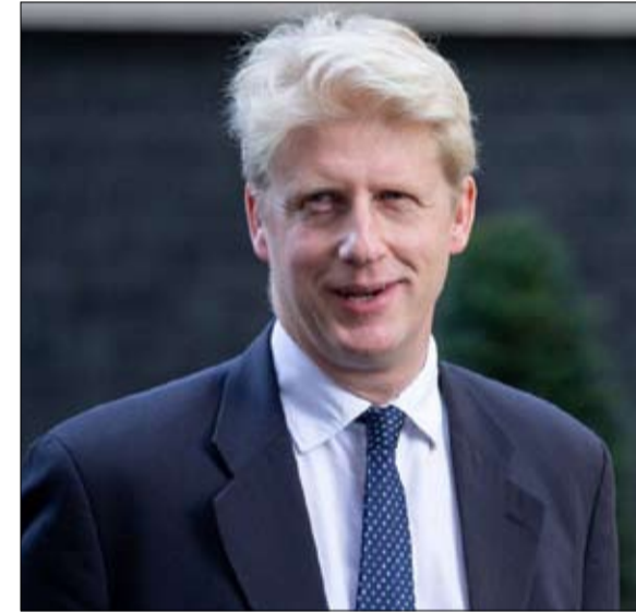
جو جونسون يغادر سفينة المحافظين

وكارداشيان، متعشقة للسلطة، و بالقدر نفسه للدعاية. في قمة العائلة، يتربع ستانلي، الأب الذي لا يمكن الانتقاد عليه، نائب سابق في البرلمان الأوروبي وناشط بيئي. ثلاثة أخوة وأخت من زواجه الأول، يتصارعون من أجل الأضواء: بوريس، 55 عاماً، رئيس الوزراء؛ وراشيل، 53 سنة، صحفية-سياسية، وهي في الوقت نفسه شخصية وكاتبة عن المجتمع