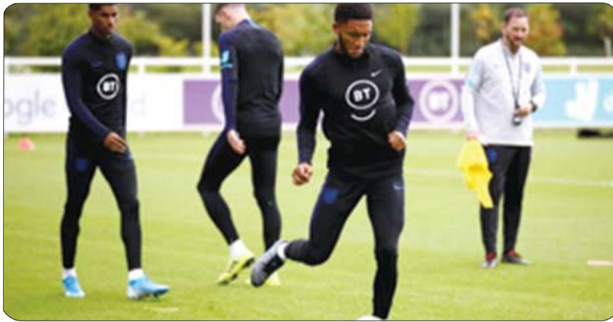
نقاط من ثلاث مباريات. ويؤكد مدرب إنجلترا غاريت

ساوثغيت، أهمية المباراتين وهو ما يتضح من سعيه نحو الدفع بكامل قوته الضاربة. وقال ساوثغيت: مبارياتنا في التصفيات نرغب في حسمها، الشيء المهم بالنسبة لنا كل يوم هو العمل كمجموعة من أجل تطوير مستوانا. وأضاف: عدنا من كأس العالم ولم تكن سعداء بنتائجنا، كما عدنا من دوري الأمم الأوروبي دون أن نكون سعداء بالشكل الكلي مما قدمناه. ويواصل ساوثغيت الاعتماد على عناصر الشباب وهو ما سيحدث أيضاً في المباراتين التاليتين.