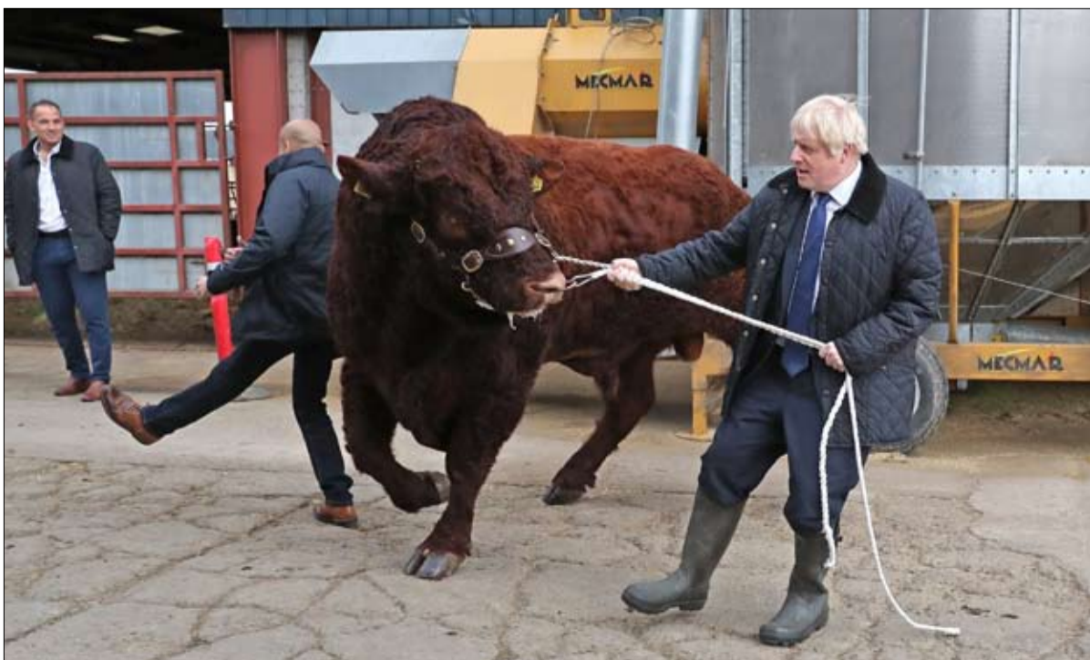
بوريس جونسون الثور الهائج

يعتقد جو أن شقيقه بوريس يهدد المصلحة الوطنية، وإنهاء مسيرته تعني انحيازه لضميره