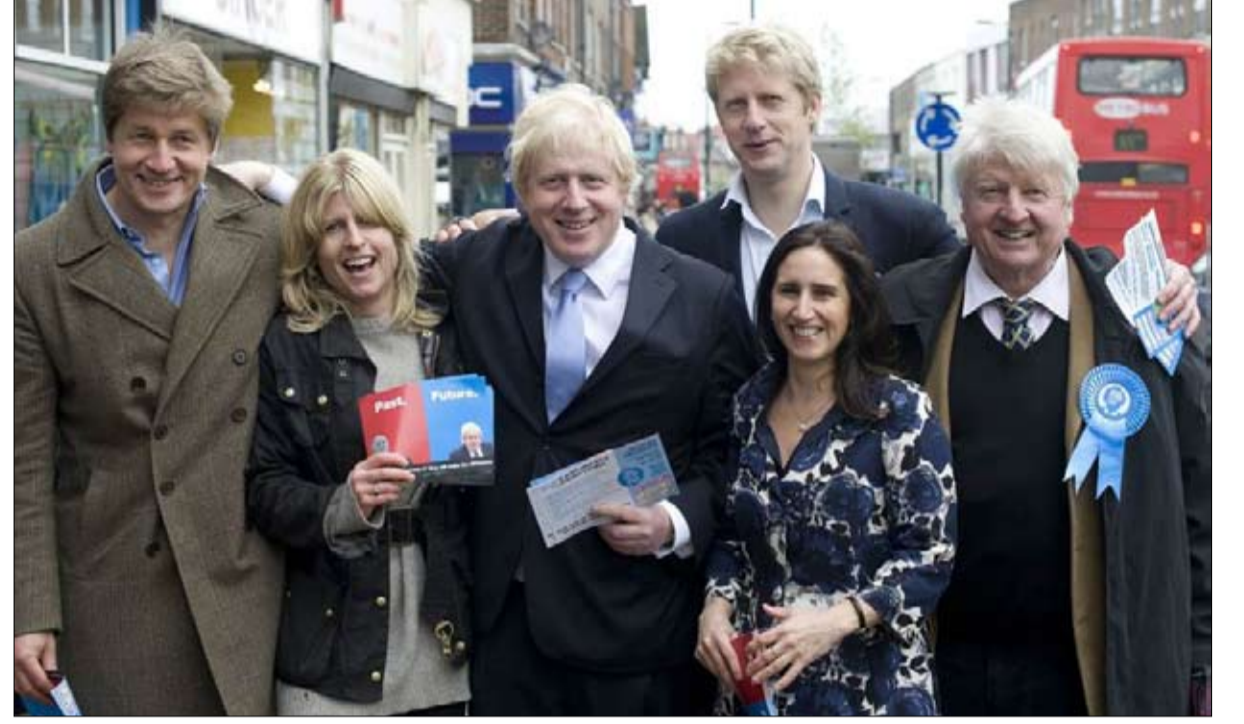
آل جونسون أسرة نخبوية

الآباء وأولادهم يصبح رئيس وزراء؟ ولكن هناك أيضاً بعض المعارضة، كنت متحمساً لأوروبا، وأبني يحصل على وظيفة قطع العلاقات مع أوروبا..