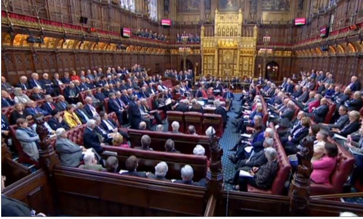
بوريس خسر المعركة في البرلمان داخل الأسرة