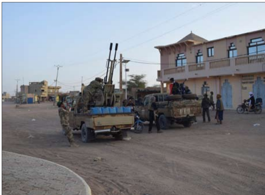
سيارة مفخخة يقودها انتحاري، منزله، وفق ما أفادت معه فرانس برس، كأنه يستهدف المدينة للمرة الإعلان الرسمي عن مقتل كامارا المتحدر من المدينة. الثانية، الصدمة هائلة.

خيم هدوء حذر صباح أمس الاثنين في باماكو ومدينة كاتي المحصنة التي تعد مقعلا للمجلس العسكري الحاكم في مالي، بعد يومين من المعارك العنيفة بين الجيش ومسلحين متشددين متحالفين مع المتطرفين الطوارق. ويسود الترقب في مالي بعد مقتل وزير الدفاع الجنرال ساديو كامارا، فيما لا يزال قائد المجلس العسكري الجنرال أسيمي غويتا متواريا ولم يصدر عنه أي تصريح منذ بدء المعارك. وتشهد مالي وضعا أمنيا حرجا بعد سلسلة الهجمات المنسقة غير المسبوقة التي شنها السبب اريهابيون متحالفتون مع جماعة نصرة الإسلام والمسلمين التابعة لتنظيم القاعدة الإرهابي، والمتطرفين الطوارق في جبهة تحرير أزواد الانفصالية التي تطالب بمنح سكان الإقليم حق تقرير المصير. وتسجل نزاعات وأعمال عنف إرهابية منذ العام 2012 في هذا البلد الواقع في غرب أفريقيا والذي يحكمه مجلس عسكري منذ العام 2020. وبعد يومين من المعارك العنيفة السبت والأحد بين الجيش والجموعات المسلحة، عاد الهدوء صباح الاثنين إلى باماكو وكاتي الواقعة على مسافة حوالي 15 كلم من العاصمة، وللتين شهدتا أعنف المعارك. ولم تسمع أي طلقات نارية الاثنين في كاتي، غير أنه كان ممكنا رؤية حطام سيارات متفجعة وأثار رصاص، ما يشهد على عنف المعارك، بحسب ما أفادت وكالة فرانس برس. كذلك خيم الهدوء في منطقة المطار في حي سينو عند أطراف كاتي، مع تحليق بعض الطائرات العسكرية بشكل دوري. وقال أحد الضباط لفرانس برس: «قمنا بعمليات تمشيط طوال الليل، سمحت لنا بتخفيف نقاط التفتيش. والأ نعمل على السكان لإبلاغنا بوجود أشخاص مشبوهين في الأحياء». وقتل في هذا الحي ذاته السبت وزير الدفاع الذي يعتبر من أبرز مسؤولي المجلس العسكري، حين استهدفت