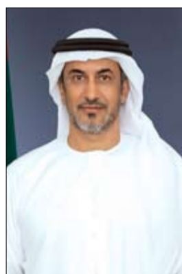
الرئيس المدير العام لشركة جلاكو

أكدت شركات أدوية عالمية وإقليمية أن دولة الإمارات رسخت مكانتها نقطة ارتكاز موثوقة في النظام الدوائي، في ظل التحولات المتسارعة التي تشهدها سلاسل الإمداد العالمية، وتنامي متطلبات الاستجابة الفعالة في القطاع الدوائي، مستندة إلى شبكة واسعة من الشراكات التي تعمل بدعم من مؤسسة الإمارات للدواء، في صورة تعكس متانة وجاذبية بيئة الأعمال بالقطاع الدوائي في الإمارات، وتبرز ثقة مؤسسية راسخة وتكاملاً تشغيلياً متقدماً تتمتع به المنظومة الدوائية في الدولة.