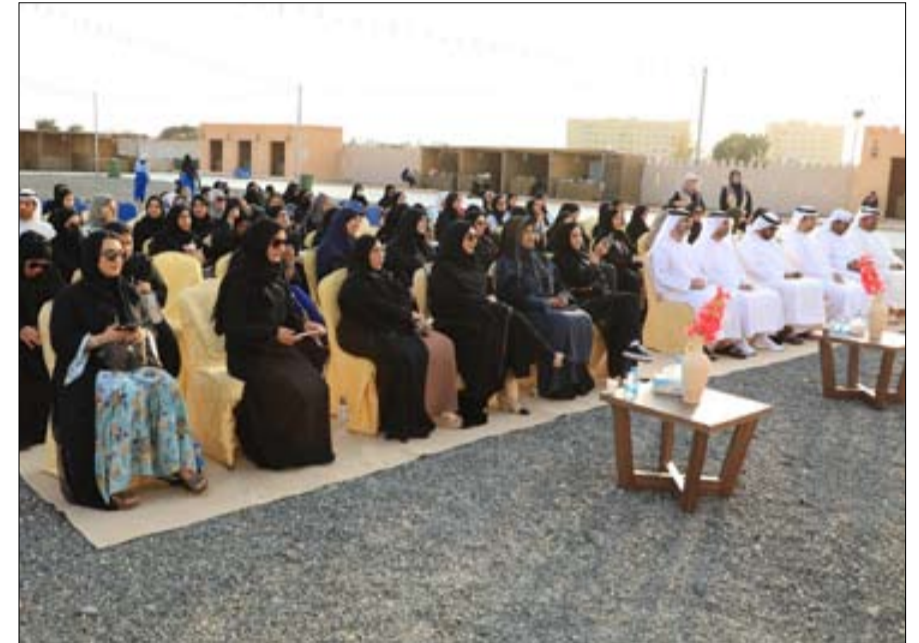
تحت شعار موروثنا صناعة مستدامة