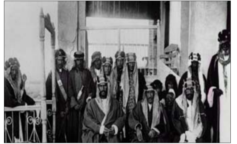
بالقرية العالمية بدبي