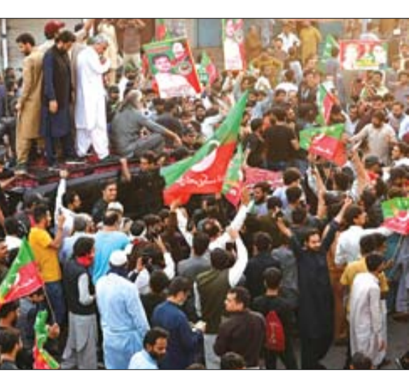
رجال أمن وأمناء يرافقون سيارة عمران خان خلال مسيرة انتخابية في لاهور.

•• إسلام آباد-وكالات: أصدرت محكمة جنائية في باكستان مذكرة اعتقال جديدة بحق رئيس الوزراء السابق، عمران خان، على خلفية ما بات يعرف بقضية، تهديد، قاضية محكمة جنائية. وأصدر قاضي المحكمة قراره بسبب تكرار تغيب عمران خان عن حضور جلسة المحاكمة، وبعد رفض التماس قدمه محامي عمران خان لاستثنائه من حضور المحاكمة، بسبب ما وصفها بتهديات، وطلب القاضي ضمان مثول عمران خان أمام المحكمة بتاريخ 29 مارس الجاري. القضية تتعلق بتصريحات عمران خان المثيرة للجدل والتي اعتبرت بمثابة تهديد لقاضية المحكمة الجنائية وضباط في شرطة العاصمة أمام تجمع لأنصاره بتاريخ 20 أغسطس من العام الماضي.