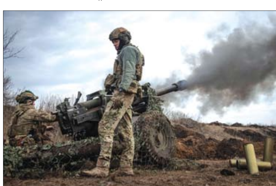
جنود أوكرانيون يطلقون مدفع هاوتزر M119 على خط أمامي، بالقرب من مدينة باخموت، (رويترز)

•• عواصم-وكالات: أعلن قائد القوات البرية الأوكرانية أمس الإثنين أن معارك عنيفة تدور مع القوات الروسية من أجل السيطرة على وسط مدينة باخموت في شرق أوكرانيا. وأكد قائد القوات البرية الأوكرانية، أولكسندر سيرسكي، معلومات سابقة أفاد بها الجانب الروسي. ونقل المكتب الإعلامي للجيش عن سيرسكي قوله إن الروس يهاجمون باخموت من عدة اتجاهات.. للتقدم نحو أحياء الوسط. وكان سيرسكي أعلن في وقت سابق أن الوضع على خط التماس في منطقة باخموت لا يزال صعباً. وقال سيرسكي لوسائل إعلام أوكرانية: قوات فاغنر الهجومية تتقدم في عدة اتجاهات في محاولة لاختراق دفاعات قواتنا والتقدم إلى المناطق الوسطى من المدينة. ويعد مقترح السلام الذي قدمته