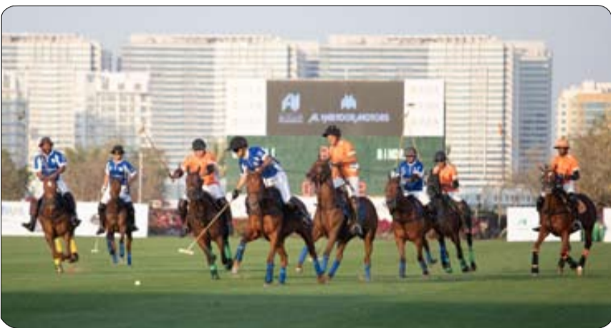
بن دري الذي لم يظهر بمستواه المعروف. وبهذه النتيجة سوف يلعب بنجاش المقبل.

في المباراة الثانية توقع الخبراء ان يعود فريق بن دري بعد غياب الى الواجهة ويكون حسان البطولة خاصة وانه يحمل هاندكاب 10 جول مقابل 9 جول لفريق بنجاش بنسائي الا ان أداء الفريق كان مخيبا للأمل وخسر امام منافسه التقليدي فريق بنجاش بنسائي وبنتيجة ثمانية اهداف ونصف جول مقابل خمسة اهداف في مباراة تقدم فيها فريق بنجاش بنسائي من