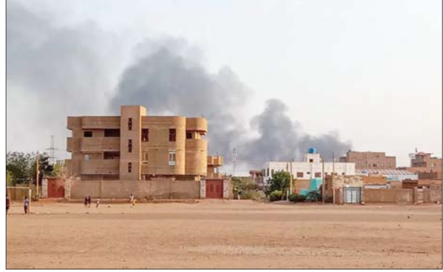
الخرطوم ما زالت تحت وابل القصف ومعاناة الاقattال

جنوب المدينة، وأبلغ سكان بأن قصفاً مدفعا مكثفا للجيش استهدف أحياء المنشية والرياض ويرى شرق الخرطوم، والتي تنتشر فيها قوات الدعم السريع بشكل كبير. وذكر السكان أن القصف المدفعي طال أيضا أحياء النهضة والإنقاذ والأزهري، جنوب العاصمة، والجاورة للمدينة الرياضية من الجهة الجنوبية. وقبلها بيوم، ناشدت غرفة طوارئ جنوب الحزام المواطنين بأخذ الحيطة والحذر والبقاء في منازلهم، وعدم الاقتراب من الأبواب والنوافذ واستخدام الساتر المناسب، مشيرة إلى أن أنحاء متفرقة من المنطقة تتعرض لقصف مدفعي، وذكر سكان أن الجيش نفذ أيضا ضربات جوية على أهداف لقوات الدعم السريع في منطقة الجريف شرق بحلية شرق النيل، وفي محيط سلاح المدرعات جنوب الخرطوم.