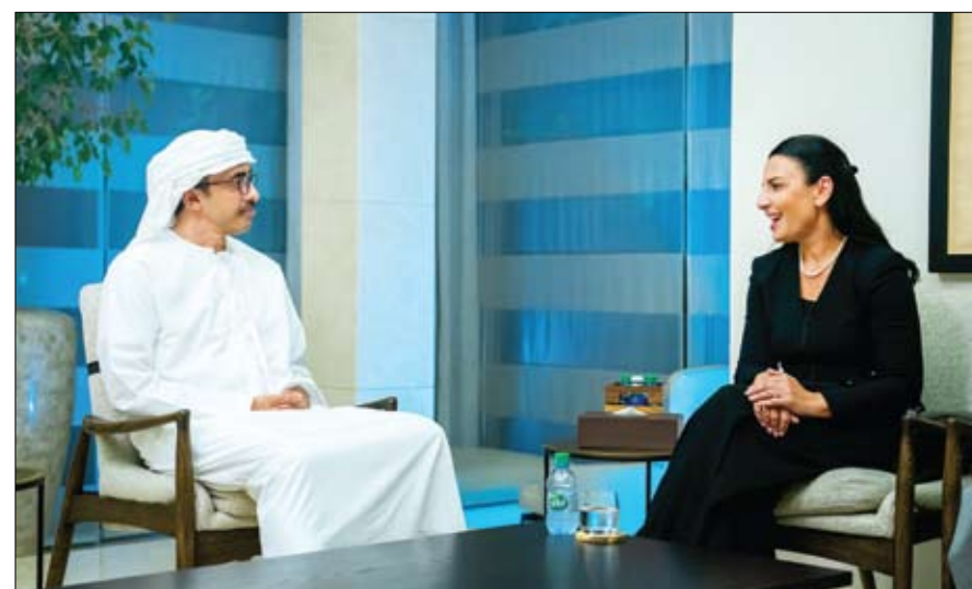
و جمهورية ألبانيا في قطاع الطاقة بالتعاون المشترك بين البلدين في كما ناقش سموه ومعالي بيندا بالوكو التعاون بين دولة الإمارات والمناخ، خاصة مع استعدادات

استقبل سمو الشيخ عبدالله بن زايد آل نهيان وزير الخارجية معالي بيندا بالوكو نائبة رئيس وزراء ألبانيا ووزيرة الطاقة والبنية التحتية. جرى خلال اللقاء الذي عقد في أبوظبي بحث علاقة الصداقة وأفاق التعاون الثنائي في مختلف المجالات، ومنها الاقتصادية والتجارية والتنمية والتبادل المعري الحكومي. واستعرض الجانبان مخرجات زيارة العمل التي قام بها سمو الشيخ عبدالله بن زايد آل نهيان إلى جمهورية ألبانيا شهر أبريل الماضي ودورها في دفع أفاق