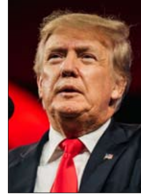
في استطلاع وطني أجرته شبكة سي بي إس بالتعاون مع يوغوف في أوائل الشهر الماضي، وافق ما يزيد بنقل عن نصف الأمريكيين على أن ترامب حاول البقاء في منصبه بعد انتخابات 2020 "من خلال نشاطات غير قانونية وغير دستورية". وقال مستطلع الآراء لصحيفة بايدن جون أنزولون: "تمهت أشخاص قد تعجبهم أجدتهم لكنهم لا يريدون العودة إلى الفوضى".

يقوم بايدن كل أسبوع تقريباً بقص شريط لمشروع طموح في البنية التحتية أو لحظة جديدة للطاقمة التنظيمية. والفوضى المتوقعة على الحدود الجنوبية حين أنهى بايدن سياسة ترامب لمواجهة كوفيد لم تتحقق قط، بينما معدلات الجريمة أخذت بالانخفاض في العديد من المدن الكبرى. ومع ذلك، تظهر استطلاعات الرأي الوطنية وكذلك الدراسات الاستقصائية في الولايات المتأرجحة الرئيسية، وبشكل مستمر، أن بايدن وترامب يتنافسان بشدة عندما يُسأل الناخبون عن عودة المنافسة المحتملة بينهما سنة 2024. إنهما حقيقة محزنة أن يكون السباق متقارباً إلى هذا الحد بالنظر إلى موقف ترامب، ولكنه كذلك" كما يقول الخبير الديمقراطي في استطلاعات الرأي أندرو بومان. ويضيف "أعتقد أنه من الواضح جداً أن ترامب يمكنه