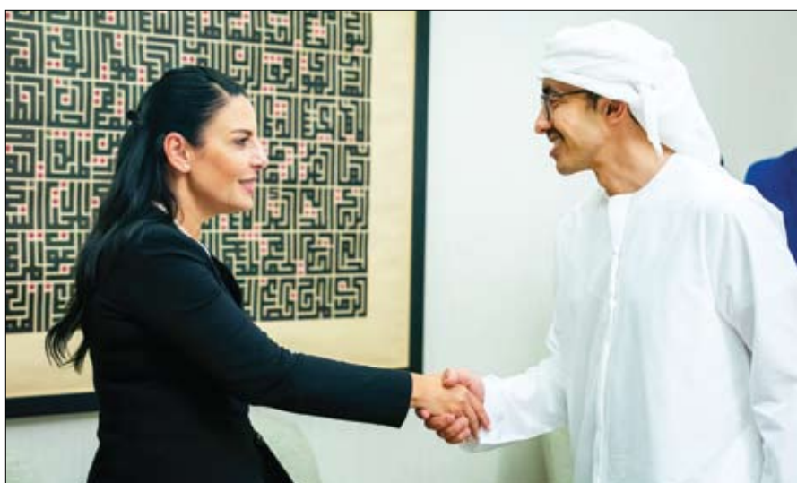
الدولة لاستضافة الدورة الثامنة والعشرين من مؤتمر الأطراف في اتفاقية الأمم المتحدة الإطارية بشأن تغير المناخ "COP28" دبي. واستعرض الجانبان عدداً

من الملفات ذات الاهتمام المشترك وتبادلاً وجهات النظر بشأنها. ورحب سمو الشيخ عبدالله بن زايد آل نهيان بزيارة معالي بيندا بالوكو مؤكداً على أهمية العلاقات الإماراتية الألبانية وحرص دولة الإمارات على تعزيزها وتطويرها على مختلف الأصعدة. من جانبها أعربت معالي بيندا بالوكو عن تطلع بلادها إلى تعزيز علاقات الصداقة والتعاون المشترك مع دولة الإمارات في المجالات كافة. حضر اللقاء معالي ريم بنت إبراهيم الهاشمي وزيرة دولة لشؤون التعاون الدولي ومعالي محمد حسن السويدي وزير الاستثمار.