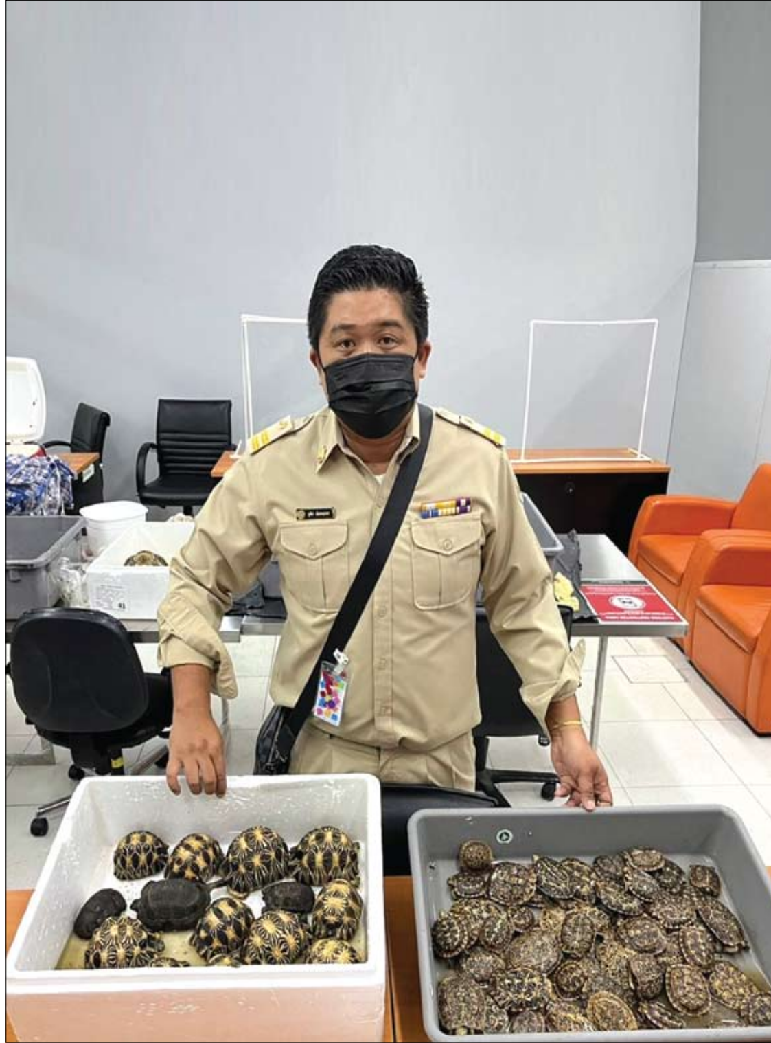
مسؤول يعرض 116 سلحفاة تم إنقاذها بعد العثور عليها في أمتعة امرأة أوكرانية في مطار سوفياريانوبولي الدولي في باتوكوف.

قارن الباحثون معدلات الوفيات من أي سبب والاستشفاء القلبي الوعائي وزيارات قسم الطوارئ القلبية الوعائية في مجموعتي الدراسة، لكن لم يجدوا فرقاً ذا دلالة إحصائية، ولكن وجدوا تحسينات متسقة للمجموعة منخفضة الصوديوم باستخدام ثلاث أدوات مختلفة لتقييم جودة الحياة، بالإضافة إلى تصنيف فشل القلب لجمعية نيويورك للقلب، وهو مقياس لشدة قصور القلب.