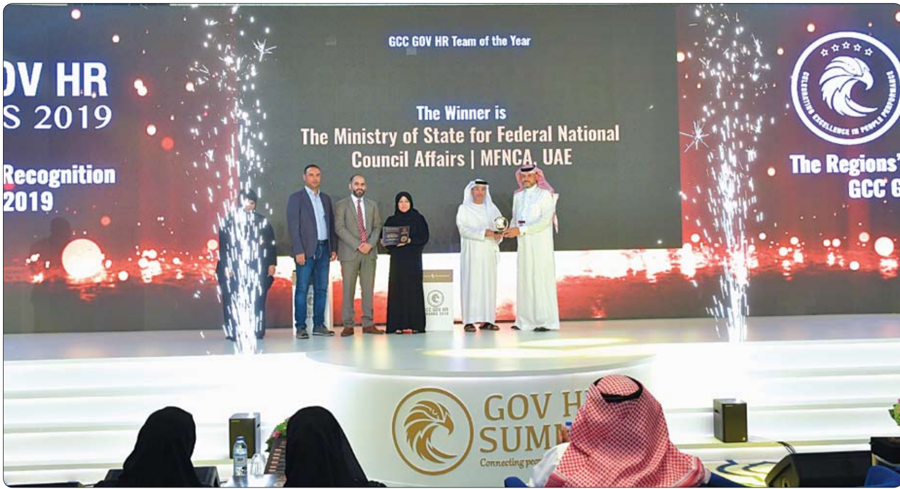
خلال حفل توزيع جوائز الخليج للموارد البشرية الحكومية 2019