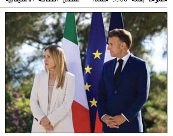
الرئيس الفرنسي لدى استقباله ميلوني في الريفييرا

•• كراكاس-أ ف ب: قتل وأصيب المئات جراء زلزال مزدوج هو الأقوى في فنزويلا منذ 1900 دفع السلطات إلى إعلان حالة الطوارئ، فيما رأى صحفيون من وكالة فرانس برس مباني منهارة ومشاهد دعر في كراكاس. وقاتل رودريغيز أعلنت حالة الطوارئ، كما أغلق مطار العاصمة الذي تعرض لأضرار جسيمة بحسب رودريغيز. وقع الزلزال الأول بقوة 7.2 درجات في الساعة 18.04 (22.04 بتوقيت غرينتش) على عمق 21.9 كلم، على مسافة حوالي 200 كلم من كراكاس، وتلاه بعد 39 ثانية زلزال بقوة 7.5 درجات وعمق 10 كلم على مسافة 45 كلم، أعقبته حوالي ثلاثين هزة ارتدادية، وفق المعهد الأمريكي للمسح الجيولوجي (يو اس جي سي). وذكرت الهيئة الأمريكية أن الحدث كان زلزالا مزدوجا وهو كارثة يتوقع أن تكون تبعاتها جسيمة، مرجحة أن تكون حصيلة الوفيات مرتفعة وأن تكون الأضرار واسعة النطاق. وذكرت الهيئة أن هذا أقوى زلزال يضرب فنزويلا خلال أكثر من قرن، منذ أن سجلت في 29 أكتوبر 1900 زلزالا بقوة 7.7 درجات قبالة، تسبب في أضرار كبيرة. في كراكاس، شاهد مصورو وكالة فرانس برس عمليات الإنقاذ تبدأ حول مبان منهارة حيث جرى انتشال أشخاص من تحت الأنقاض. وأعلن الرئيس الأمريكي عبر شبكته تروث سوشال إن الولايات المتحدة جاهزة ومستعدة وقادرة على تقديم مساعدتها لفنزويلا.