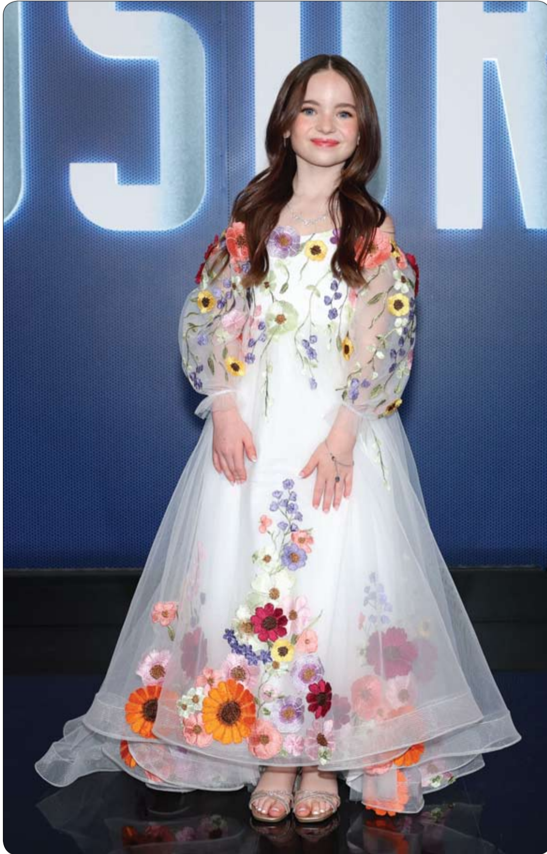
الممثلة الأمريكية ديلاني آن كوثبرت لدى حضورها العرض الأول لفيلم «يوم الاكتشف» في مسرح ديفيد إتش. في نيويورك. (د. ف. ب.)

نشر وزير الدولة الهندي كيرتي فاردان سينغ مقطع فيديو يوثق رحلة تعاليف فيلة صغيرة أطلق عليها اسم «مايا»، بعد إنقاذها في ولاية كيرالا إثر تخلي قطيعها عنها عقب ولادتها مباشرة. وأوضح سينغ أن الفيلة الصغيرة نُقلت إلى مركز «إيهارانيام» لإعادة تأهيل الأفيال، بعد أن عثرت عليها إدارة الغابات في كيرالا وهي مهجورة، مشيراً إلى أن نجاتها تمثل «معجزة بكل معنى الكلمة». وأضاف أن «مايا»، واجهت تحديات كبيرة خلال مراحل العلاج، واستغرقت نحو 40 يوماً حتى تمكنت من الوقوف على قدميها، بفضل الجهود المتواصلة التي بذلها مسؤولو الغابات والأطباء البيطريون. وقال الوزير في منشور عبر حساباته: «أطلقت عليها اسم مايا؛ لأن نجاتها معجزة حقيقية، ودليل على الصمود والرعاية والرحمة». وأظهر الفيديو سينغ خلال زيارته لمركز التأهيل وهو يطعم الفيلة الصغيرة الموز، ويتابع عن قرب جهود الفرق المختصة التي أشرفت على علاجها ورعايتها. وأكد الوزير أن «كل حياة تُقَد هي انتصار لحماية البيئة»، واصفاً تجربته مع الفيلة الصغيرة بأنها مؤثرة للغاية. وبيّز تعاليف «مايا» أهمية التدخل السريع وعمليات الإنقاذ وإعادة التأهيل في حماية الأفيال المهددة وضمان فرص بقائها على قيد الحياة.