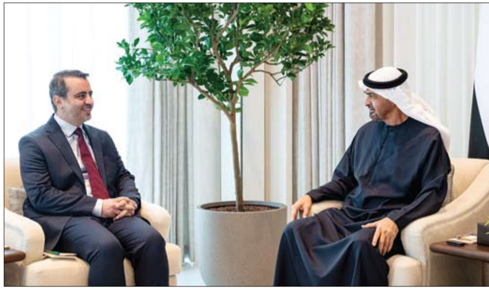
رئيس الدولة خلال استقباله وزير الخارجية السوري

•• أبو ظبي-وام: بعث صاحب السمو الشيخ محمد بن زايد آل نهيان رئيس الدولة حفظه الله، برقية تعزية إلى فخامة ديلسي رودريغيز رئيسة جمهورية فنزويلا البوليفارية بالإنابة، في ضحايا الزلزالين اللذين ضربا البلاد، والذي أسفر عن وقوع عدد من الوفيات والجرحى، متمنيا سموه الشفاء العاجل لجميع المصابين. كما بعث صاحب السمو الشيخ محمد بن راشد آل مكتوم، نائب رئيس الدولة، رئيس مجلس الوزراء، حاكم دبي رعاها الله وسمو الشيخ منصور بن زايد آل نهيان، نائب رئيس الدولة، نائب رئيس مجلس الوزراء، رئيس ديوان الرئاسة، برقيتي تعزية ممانئتين إلى فخامة ديلسي رودريغيز رئيسة جمهورية فنزويلا البوليفارية بالإنابة. هذا وقد أعربت دولة الإمارات عن خالص تضامنها مع جمهورية فنزويلا البوليفارية إثر الزلزالين اللذين ضربا البلاد، وأسفر عن وفاة وإصابة عدد كبير من الأشخاص، إضافة إلى أضرار مادية جسيمة. وعبرت وزارة الخارجية، في بيان لها، عن خالص تعازيها وصداق مواساتها إلى أهالي وذي الضحايا، وإلى جمهورية فنزويلا البوليفارية وشعبها الصديق في هذا الصاب الأليم، متمنية الشفاء العاجل للمصابين.