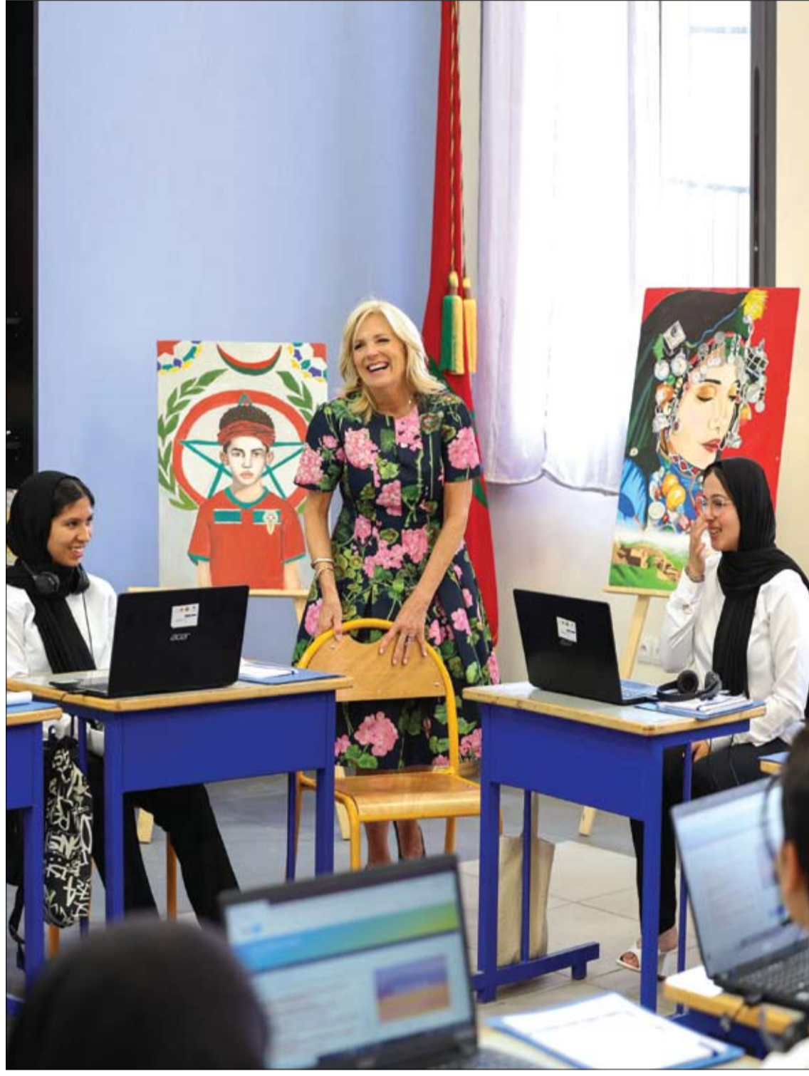
السيدة الأولى الأمريكية جيل بايدن تتحدث إلى تلاميذ في مدرسة ابن العارف بمراكش