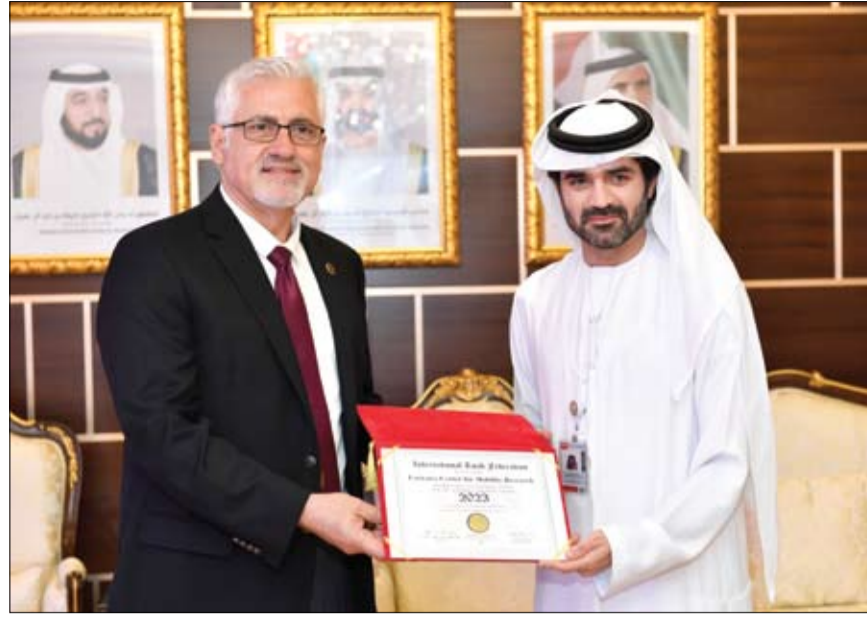
أول مركز بحثي في الإمارات