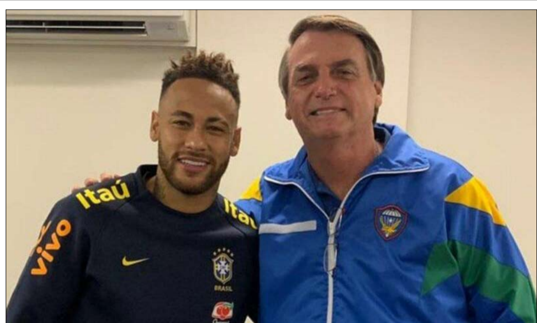
نيمار يساند بولسونارو في الرئاسة