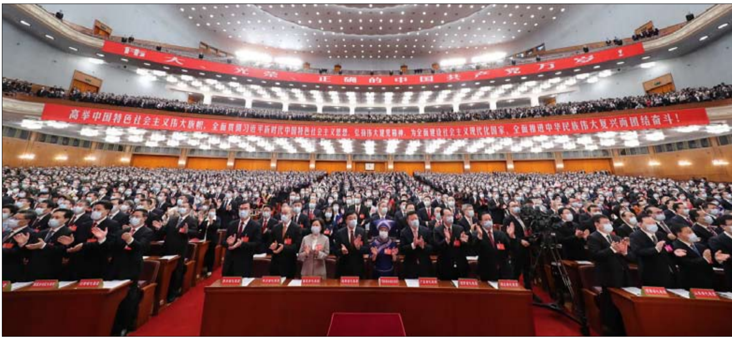
مؤتمر المراجعة الاستراتيجية

وسيكون له تأثير قوي على التوجهات السياسية والاقتصادية حتى المؤتمر القادم عام 2027. وهكذا، كيف ستكون "بدلة الرئيس شي الجديدة" في نهاية اجتماع الحزب-الدولة الكبير هذا، وما هو هامش مناوئته؟