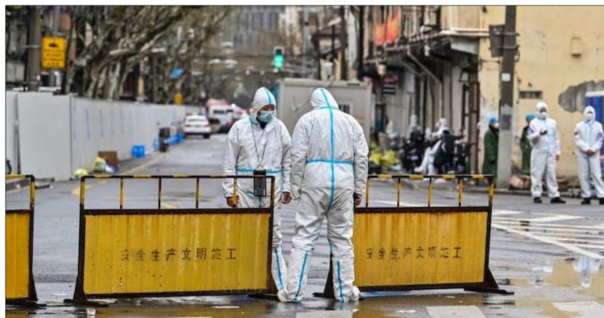
التطبيق الصارم لسياسة صفر كوفيد له آثار ضارة على الاقتصاد الصيني