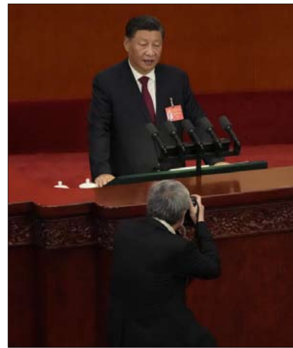
شي جين بينغ ولاية ثالثة تبحث عن عنوان