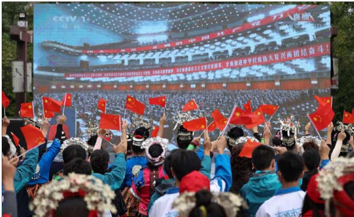
افتتاح المؤتمر العشرين للحزب الشيوعي الصيني

في الأولى، أن تشدد الدبلوماسية الصينية الذي تجلى في تصلب دبلوماسيتها، الذين وصفوا بـ "الذئاب المقاتلة"، قد بلغ ذروته خلال السنوات الخمس الماضية بانتقاد مستمر للديمقراطيات الغربية وبصرامة ضد كل الذين يجروون على الإشارة إلى المناطق الرمادية في هذا البلد. في العالم الغربي، تعتبر هذه الاستراتيجية فاشلة تماماً، وقد أساءت إلى الخطاب الصيني مع شركائها. لكن ما وراء الطريقة والاسلوب، هناك أيضاً الوقائع. وهكذا تميزت