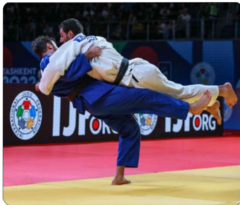
برعاية هزاع بن زايد :