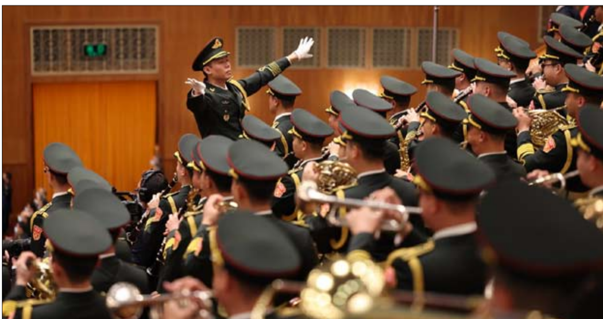
هل تستعيد الصين دور قوتها الناعمة؟