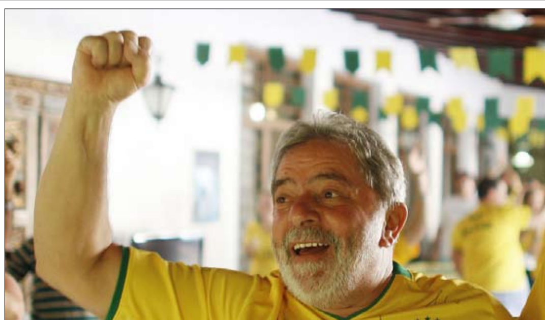
لولا يتهم نيمار بصفقة ضريبية مع بولسونارو

أعلنت منظمة "سايف ذي تشيلدرن" الإغاثية غير الحكومية أن حوالي 1.4 مليون طفل دون سن الخامسة في جنوب السودان يعانون من سوء التغذية، محذرة من أن الدولة الفتية تواجه "أسوأ أزمة جوع" سببها خصوصا فيضانات متتالية ونزاعات مسلحة. ودولة جنوب السودان التي رأت النور في 2011 عندما انفصلت عن السودان، غارقة في أعمال عنف سياسية-إثنية، وقد شهدت هذا العام، للسنة الرابعة على التوالي، فيضانات تضررت منها حتى الآن تسع من ولايات البلاد العشر. وبحسب الأمم المتحدة، فإن 8.9 مليون شخص في هذا البلد، أي 70% من سكانه، هم بحاجة إلى مساعدات إنسانية. وقالت "أنقذوا الطفولة" في بيان إن هذا العدد "يشمل 1.4 مليون طفل دون سن الخامسة يعانون من سوء التغذية". وأوضحت المنظمة أن الوضع يتفاقم في الأشهر الأخيرة مع تضرر أكثر من 615 ألف شخص من جراء سنة رابعة على التوالي من فيضانات دمّرت مساكن ومحاصيل وتسببت بزيادة حالات الإصابتة بالمalaria، ولا سيما بين النساء والأطفال..