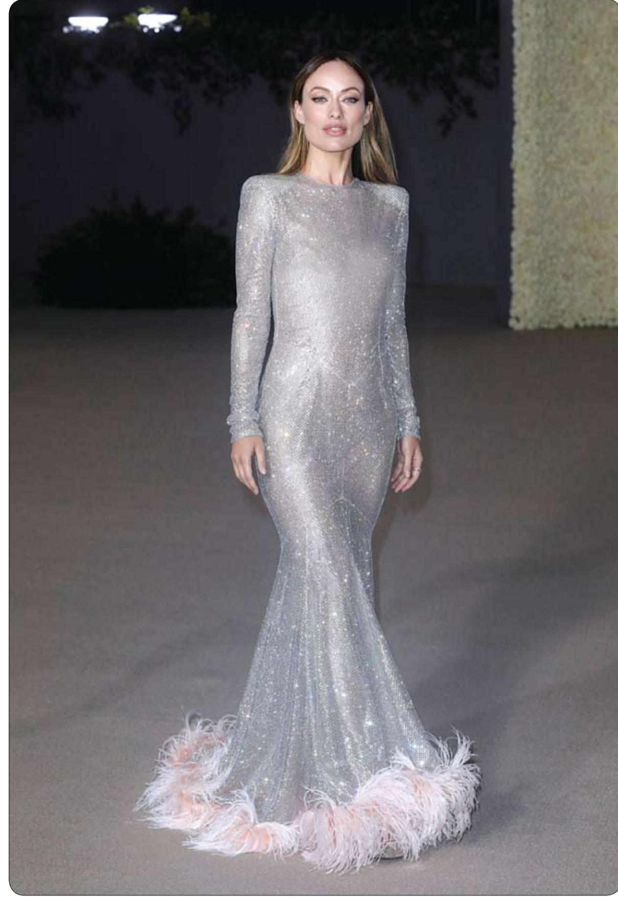
أوليفيا وايلد خلال حضورها حفل المتحف الأكاديمي للصور المتحركة في لوس أنجلوس

وأضافت أنه لم تقع إصابات ولم يؤثر الحادث على عمليات المطار وغادرت الطائرة نيوارك في وقت لاحق. ولم يشر أحد من الأطراف المعنية إلى كيفية صعود الثعبان على متن رحلة طيران تجاري.