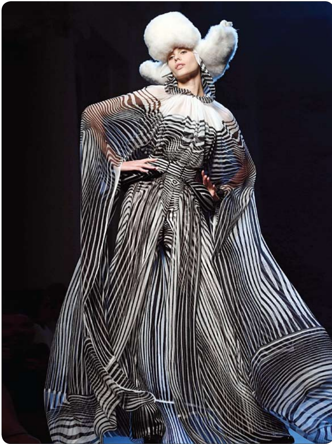
عارضة تقدم زيا من تصميم جان بول غوتيه خلال عرض أزياء مجموعة خريف وشتاء 2019-2020 في باريس.

وأخيراً أوصى الخبير الألماني بأنه من الأفضل أن يخصص هواة ممارسة الرياضة في الصباح قرابة ساعتين أو ساعتين ونصف ساعة لممارسة الرياضة والاسترخاء قليلاً بعدها، وكذلك لتناول الإفطار.